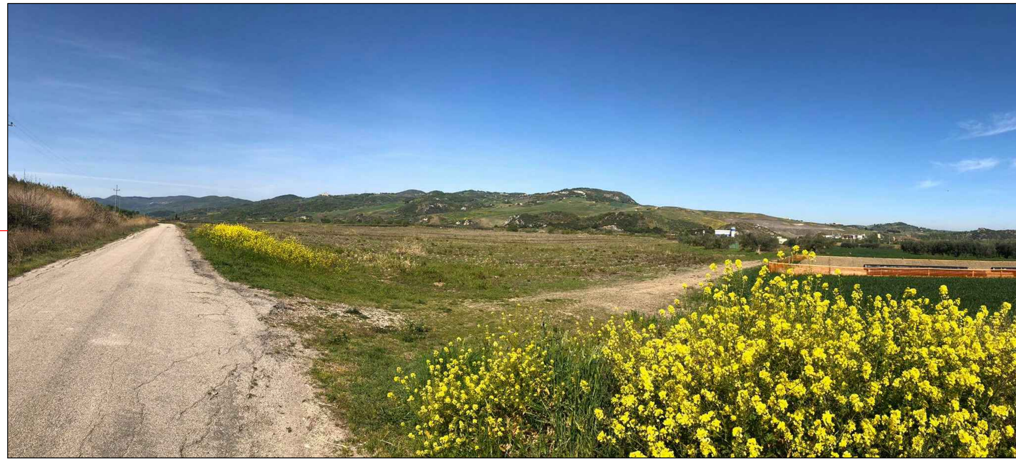
③ (41°59'00.47"N - 14°43'13.50"E) VISTA DELL'IMPIANTO ANTE-OPERAM