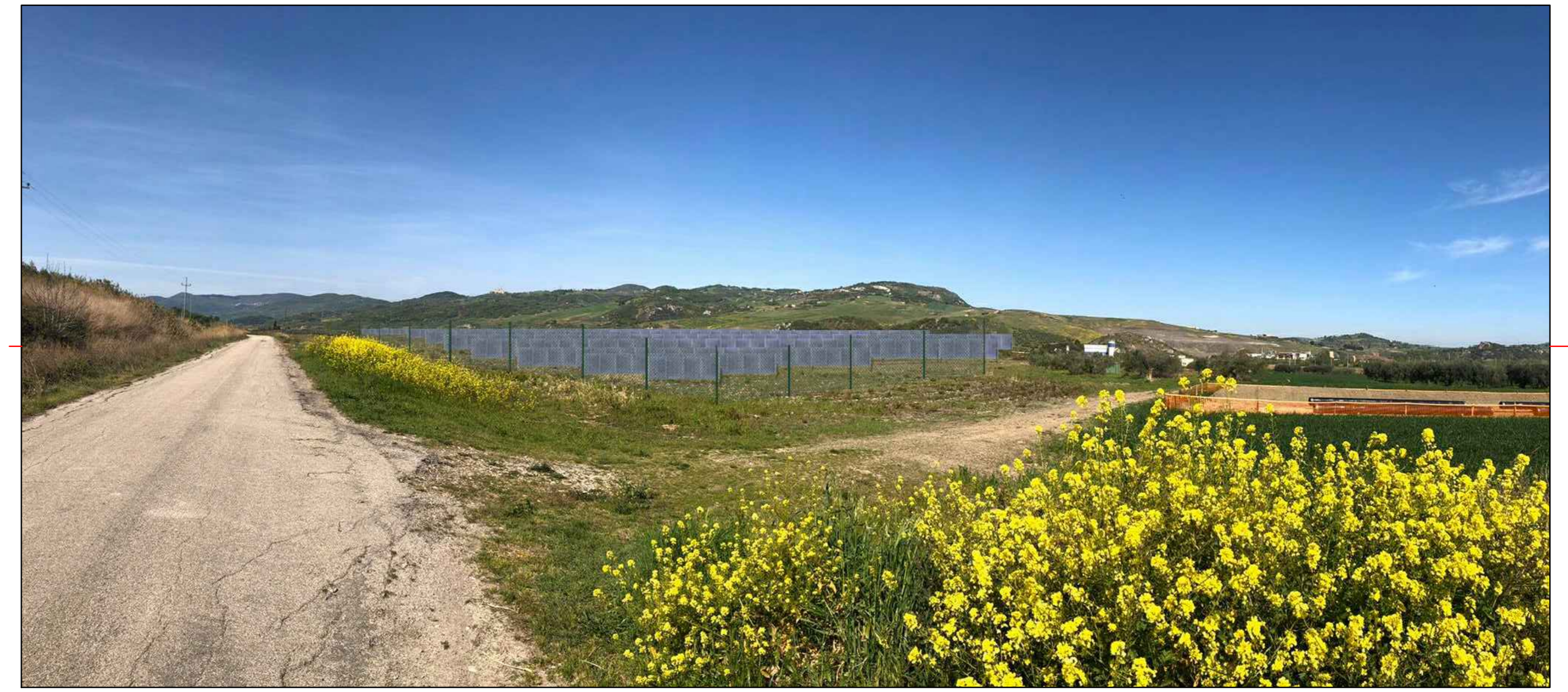
③ (41°59'00.47"N - 14°43'13.50"E) VISTA DELL'IMPIANTO SENZA MITIGAZIONE