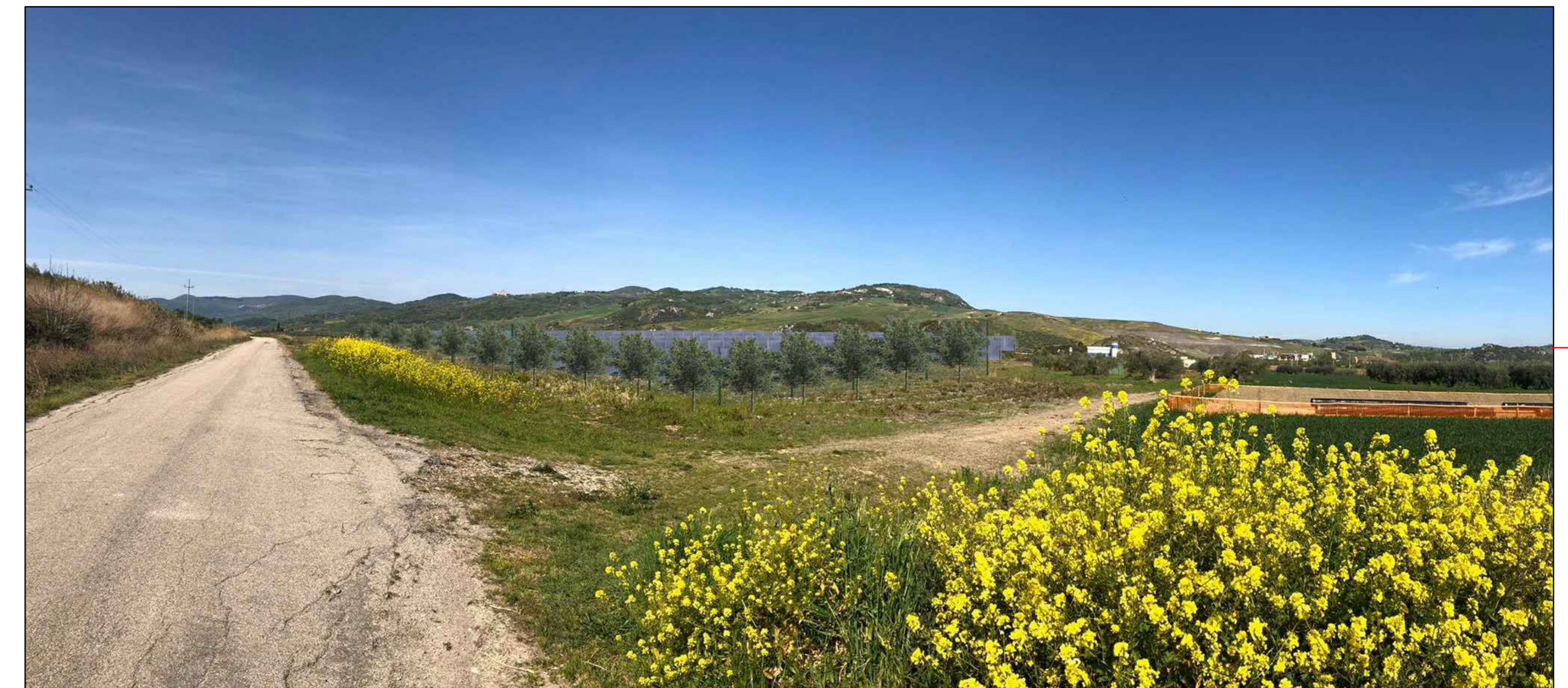
③ (41°59'00.47"N - 14°43'13.50"E) VISTA DELL'IMPIANTO CON MITIGAZIONE