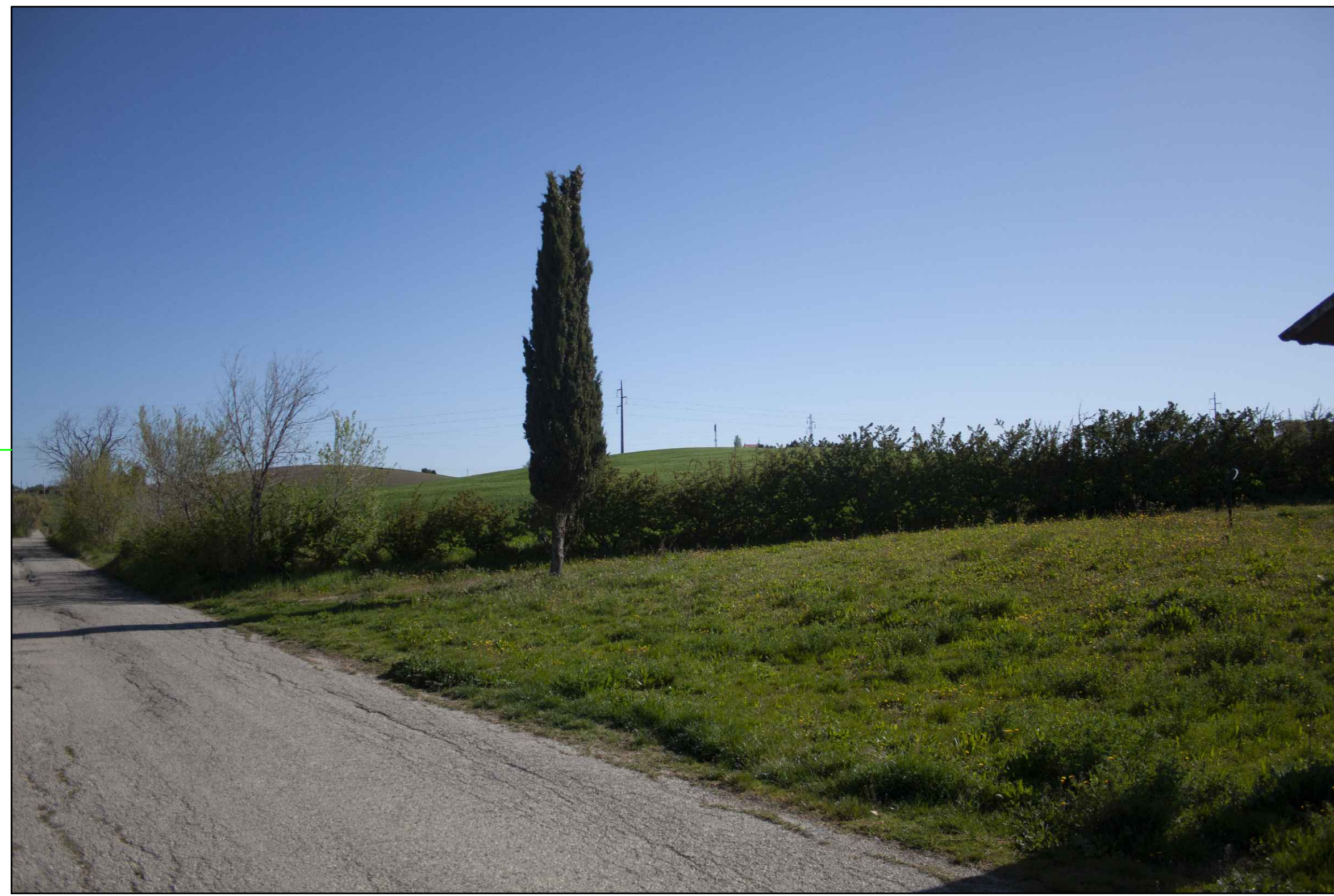
⑥ (42°00'11.13"N - 14°47'26.01"E) VISTA DELL'IMPIANTO ANTE-OPERAM