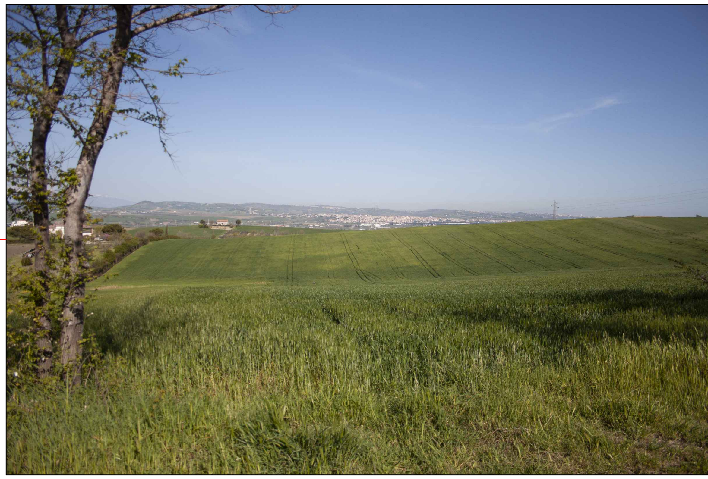
⑥ (42°00'11.13"N - 14°47'26.01"E) VISTA DELL'IMPIANTO ANTE-OPERAM