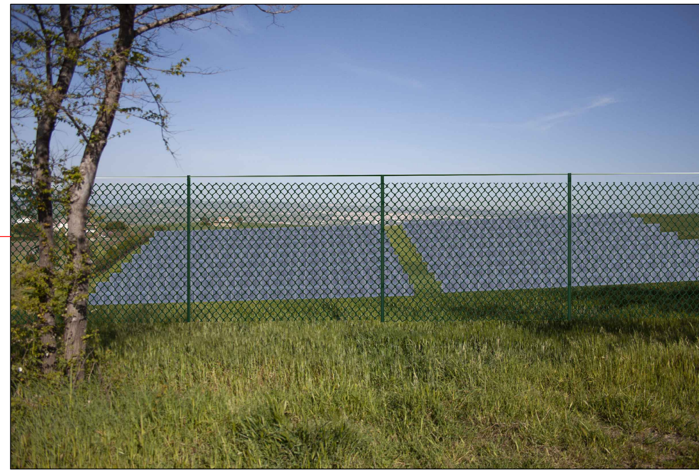
⑥ (42°00'11.13"N - 14°47'26.01"E) VISTA DELL'IMPIANTO SENZA MITIGAZIONE