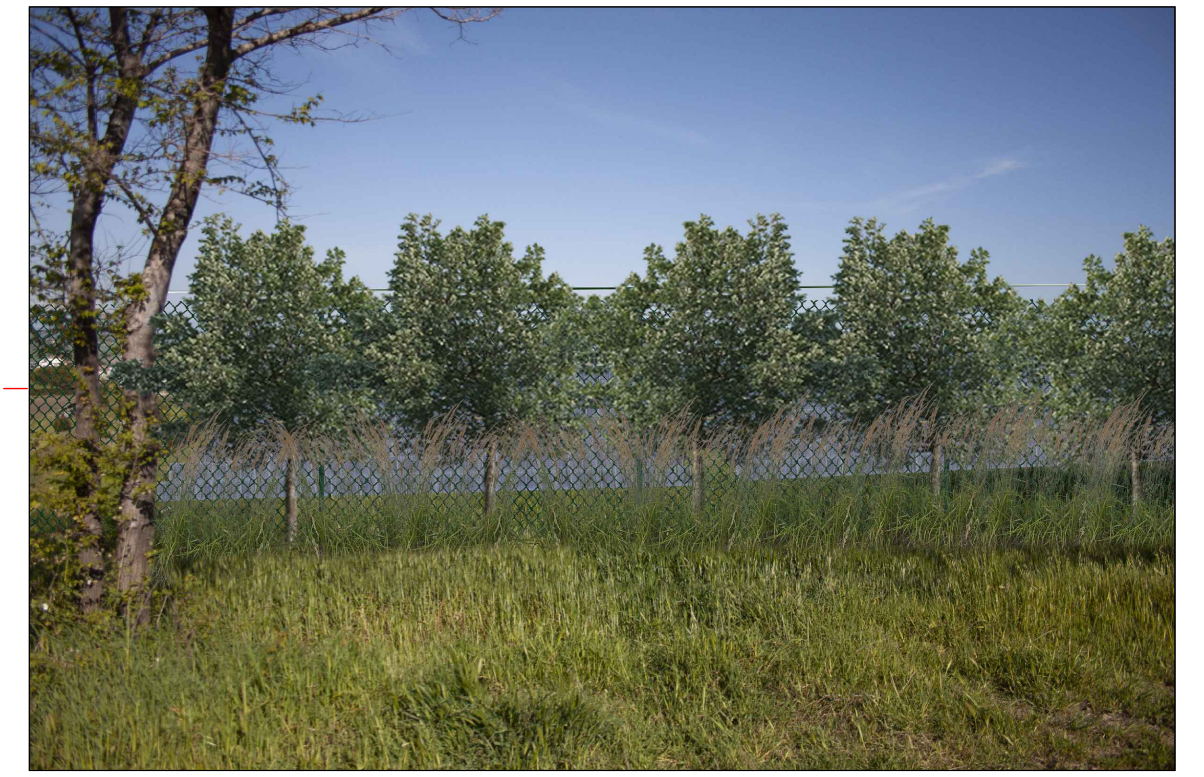
⑥ (42°00'11.13"N - 14°47'26.01"E) VISTA DELL'IMPIANTO CON MITIGAZIONE