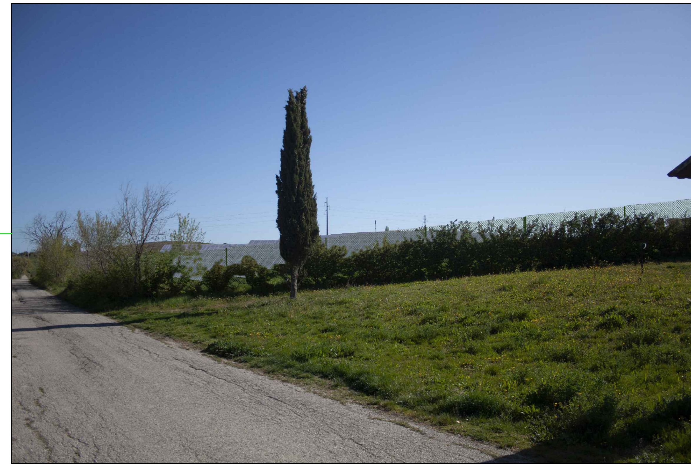
⑥ (42°00'11.13"N - 14°47'26.01"E) VISTA DELL'IMPIANTO SENZA MITIGAZIONE