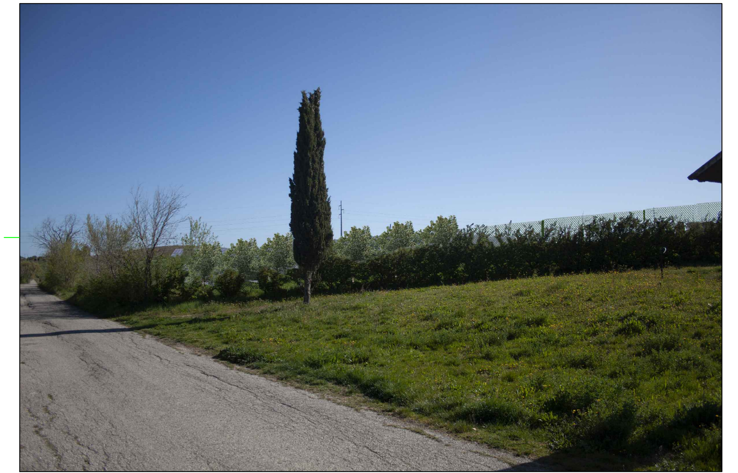
⑥ (42°00'11.13"N - 14°47'26.01"E) VISTA DELL'IMPIANTO CON MITIGAZIONE