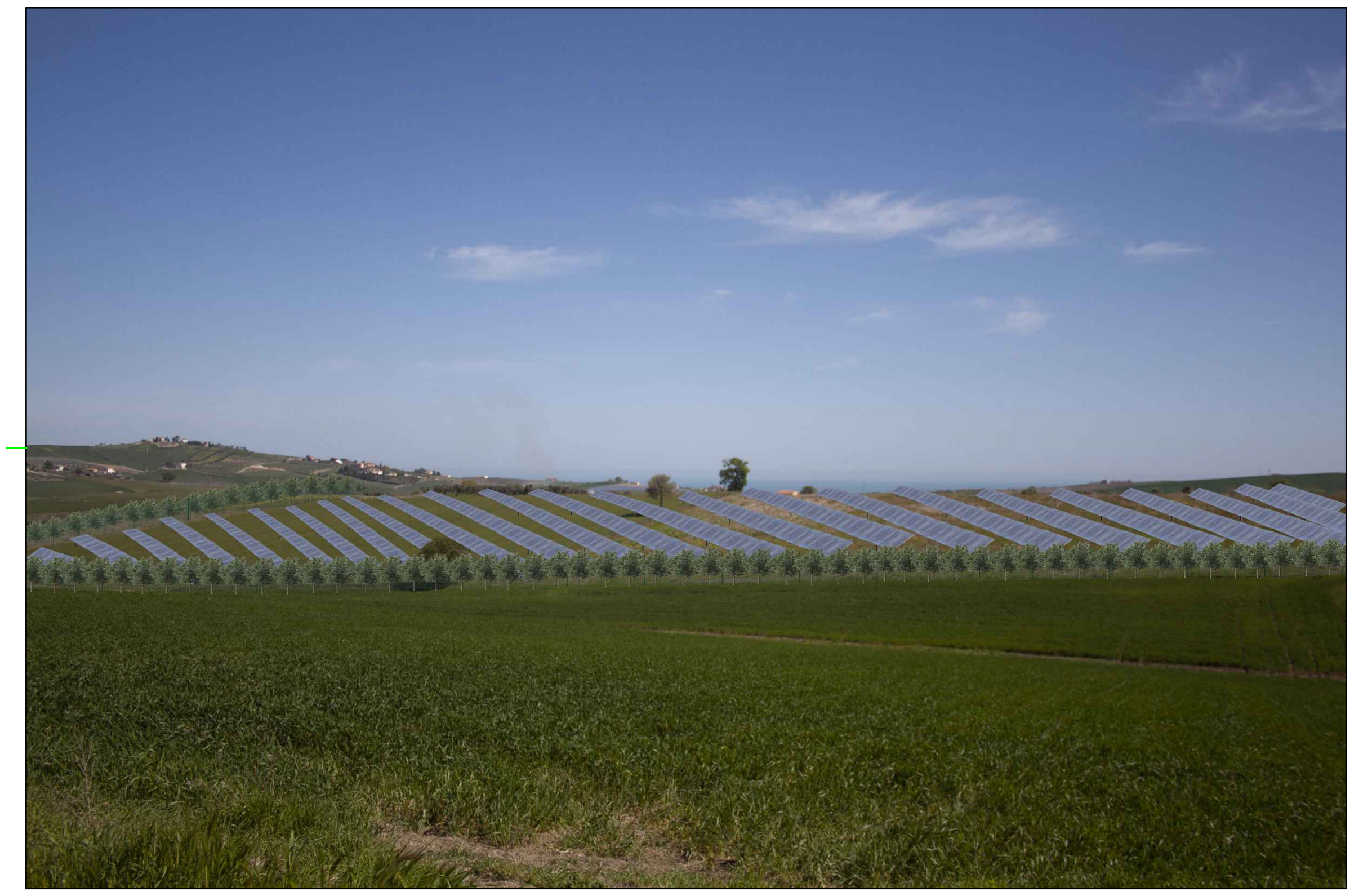
⑦ (42°01'29.31"N - 14°48'40.29"E) VISTA DELL'IMPIANTO CON MITIGAZIONE