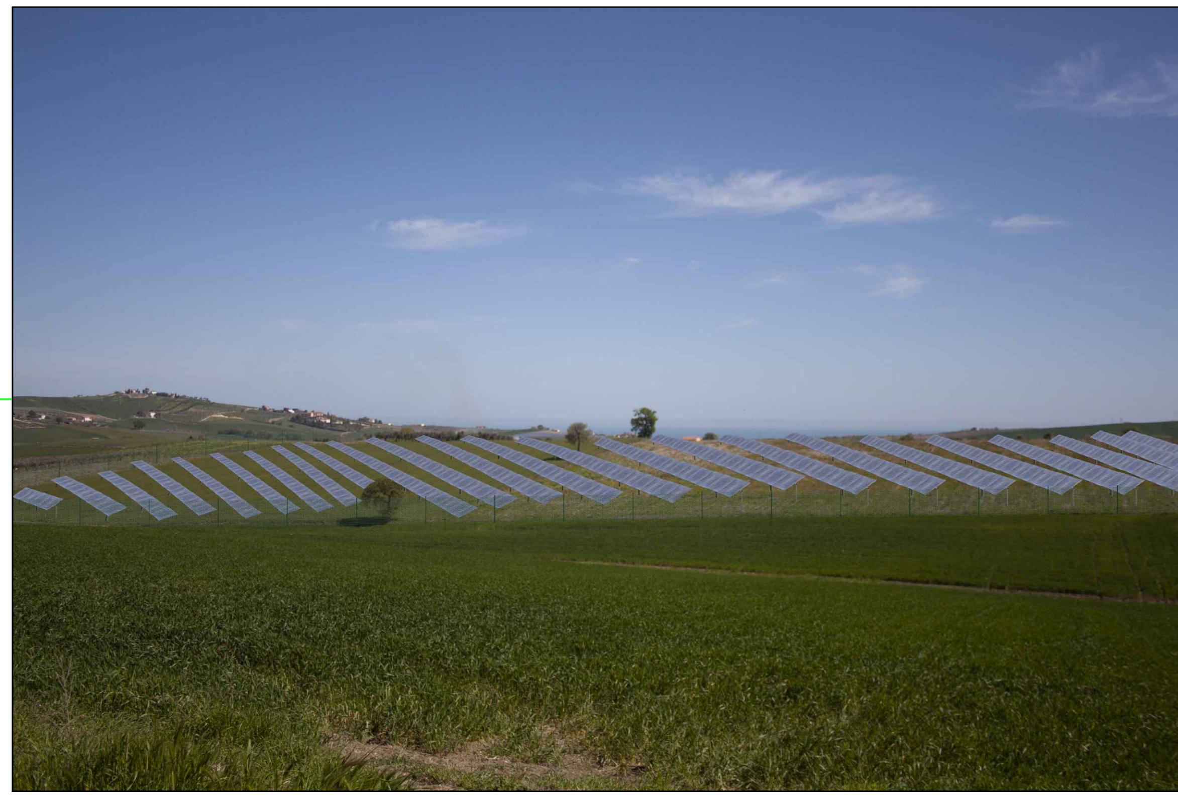
⑦ (42°01'29.31"N - 14°48'40.29"E) VISTA DELL'IMPIANTO SENZA MITIGAZIONE