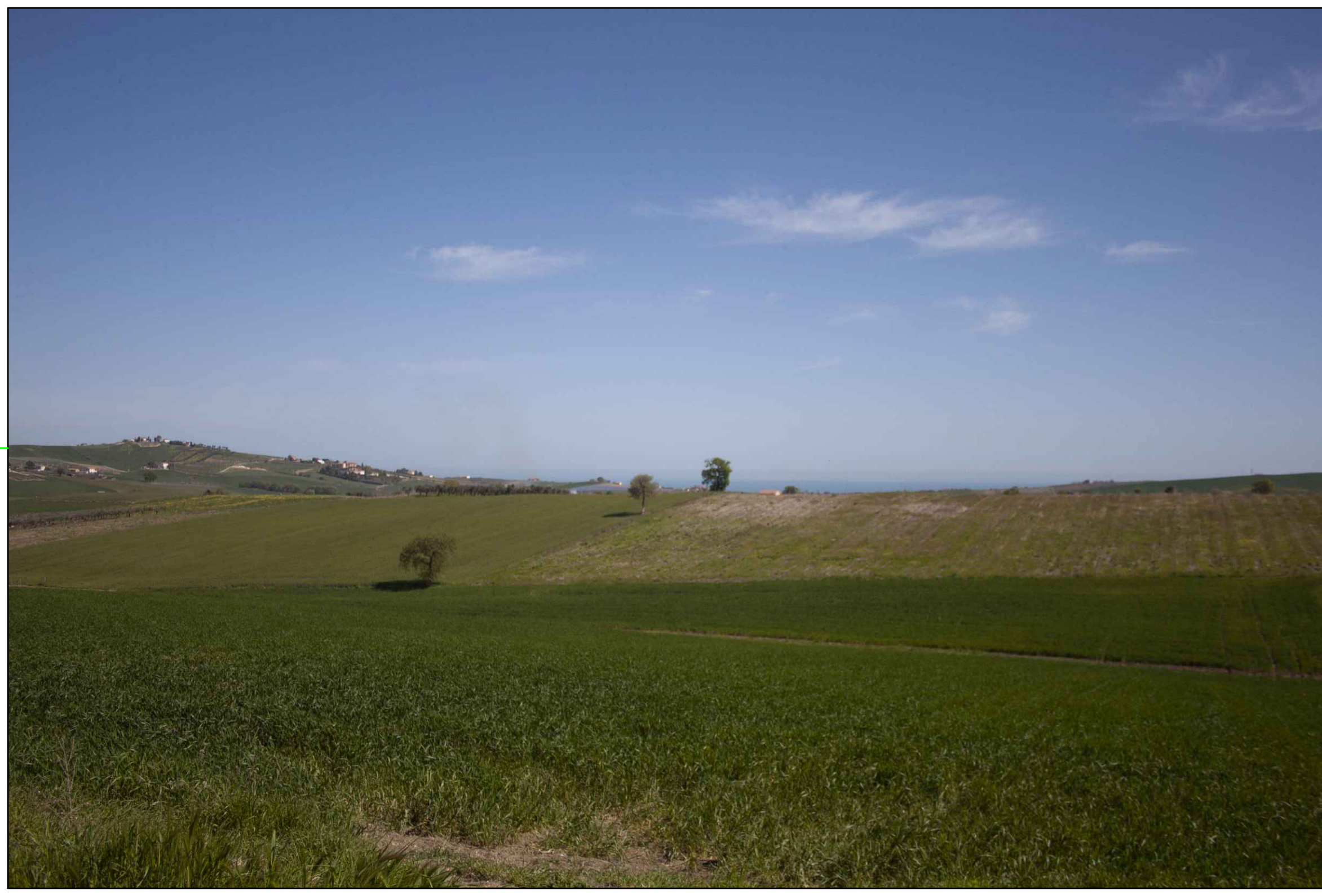
⑦ (42°01'29.31"N - 14°48'40.29"E) VISTA DELL'IMPIANTO ANTE-OPERAM