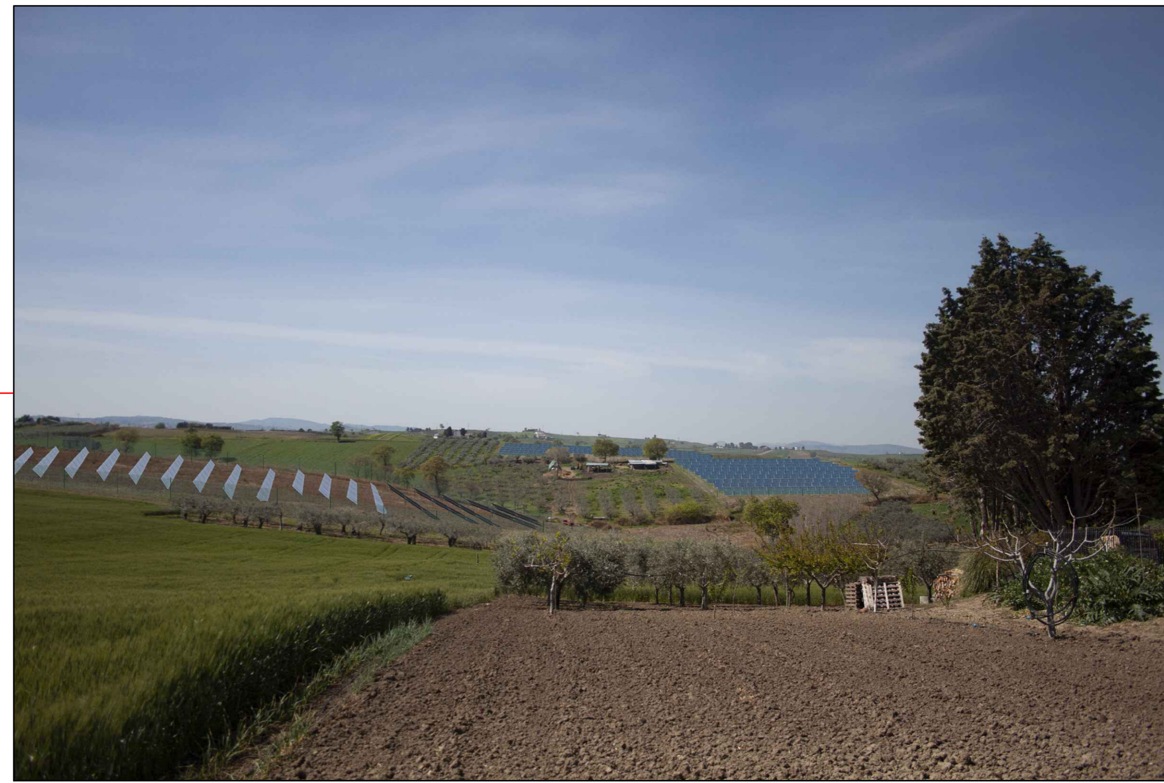
⑦ (C.da Querce Grosse) VISTA DELL'IMPIANTO SENZA MITIGAZIONE