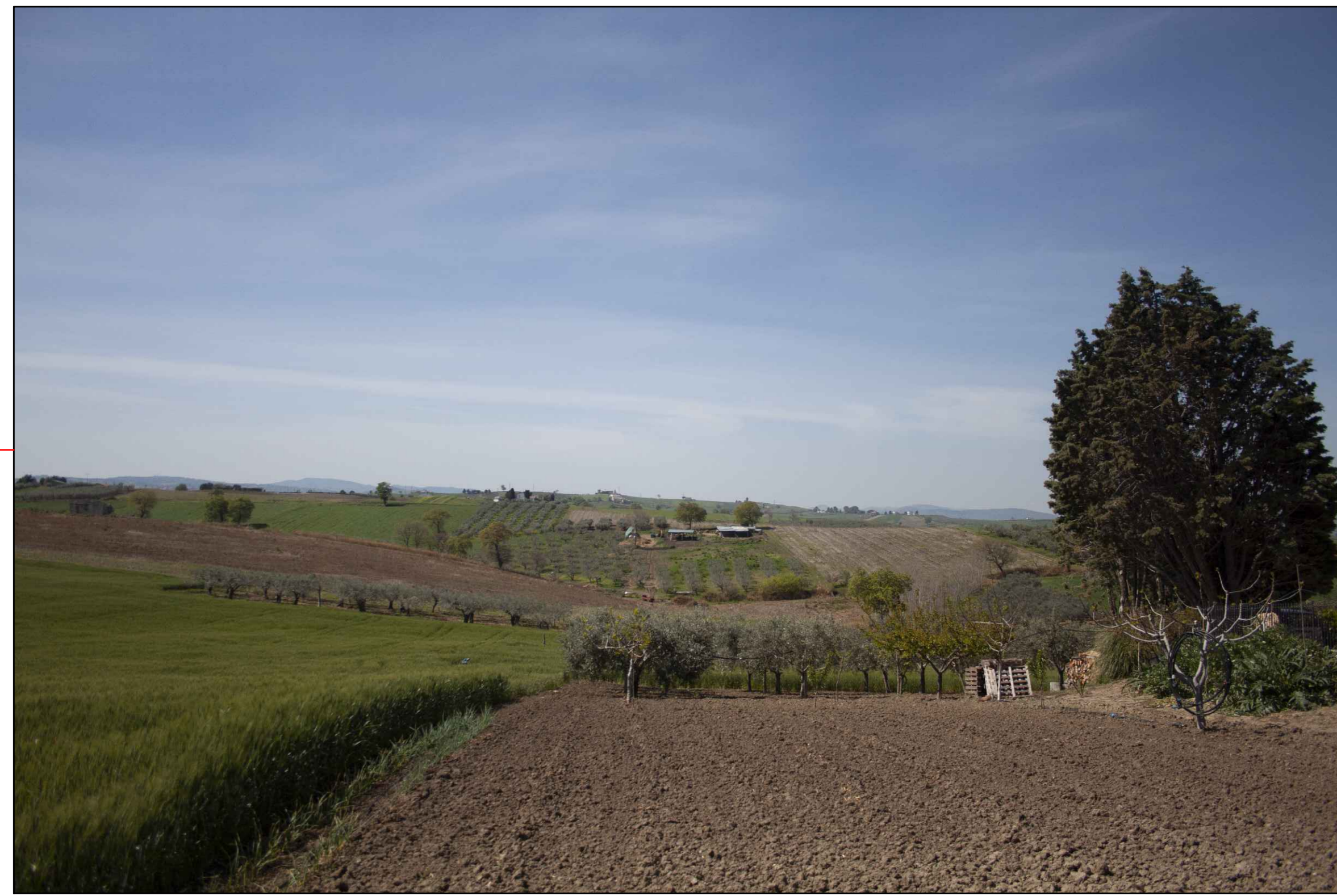
⑦ (C.da Querce Grosse) VISTA DELL'IMPIANTO ANTE-OPERAM