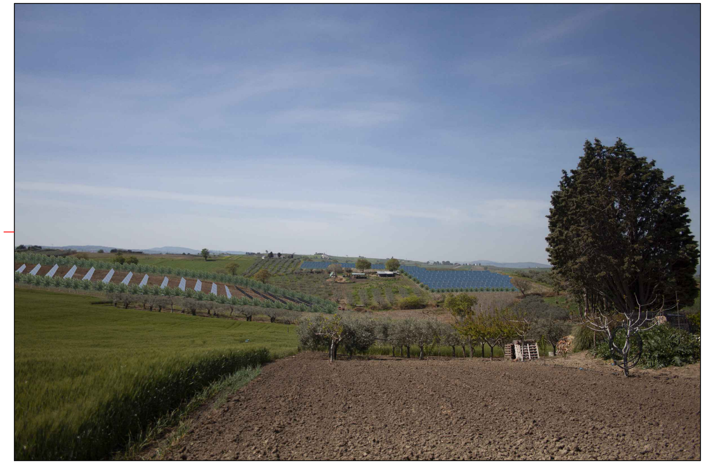
⑦ (C.da Querce Grosse) VISTA DELL'IMPIANTO CON MITIGAZIONE