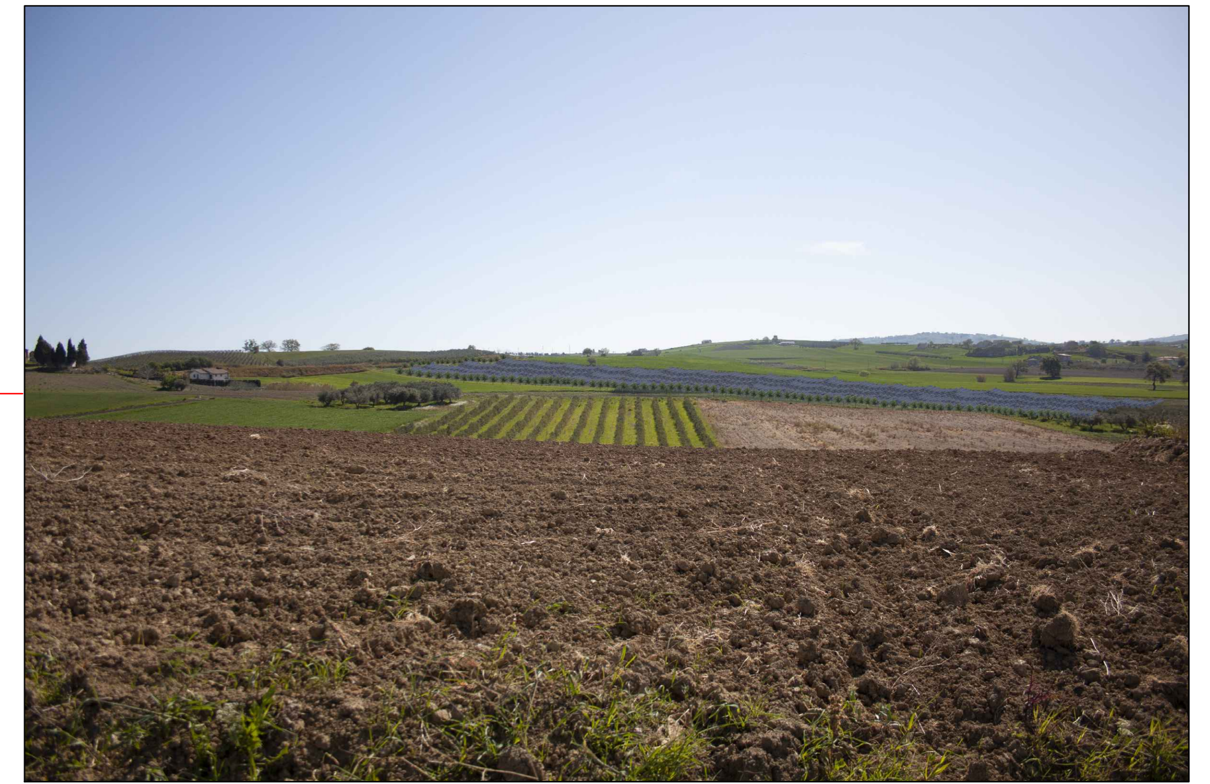
9 (42°00'19.43"N - 14°45'33.30"E) VISTA DELL'IMPIANTO CON MITIGAZIONE