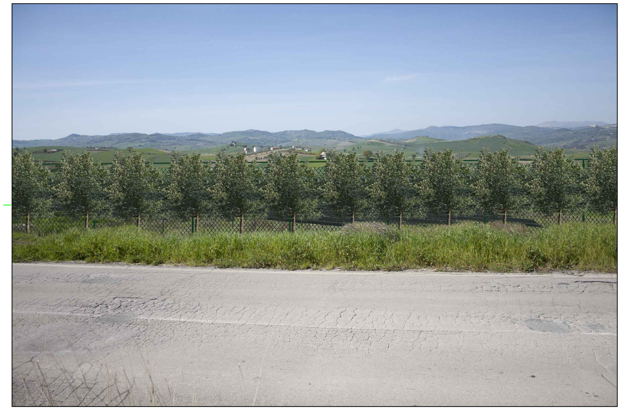
9 (S.da Comunale Chiatalonga) VISTA DELL'IMPIANTO CON MITIGAZIONE