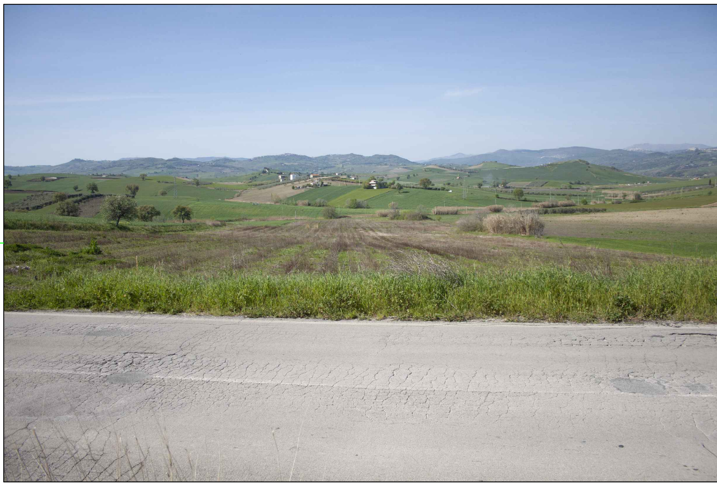
9 (S.da Comunale Chiatalonga) VISTA DELL'IMPIANTO ANTE-OPERAM