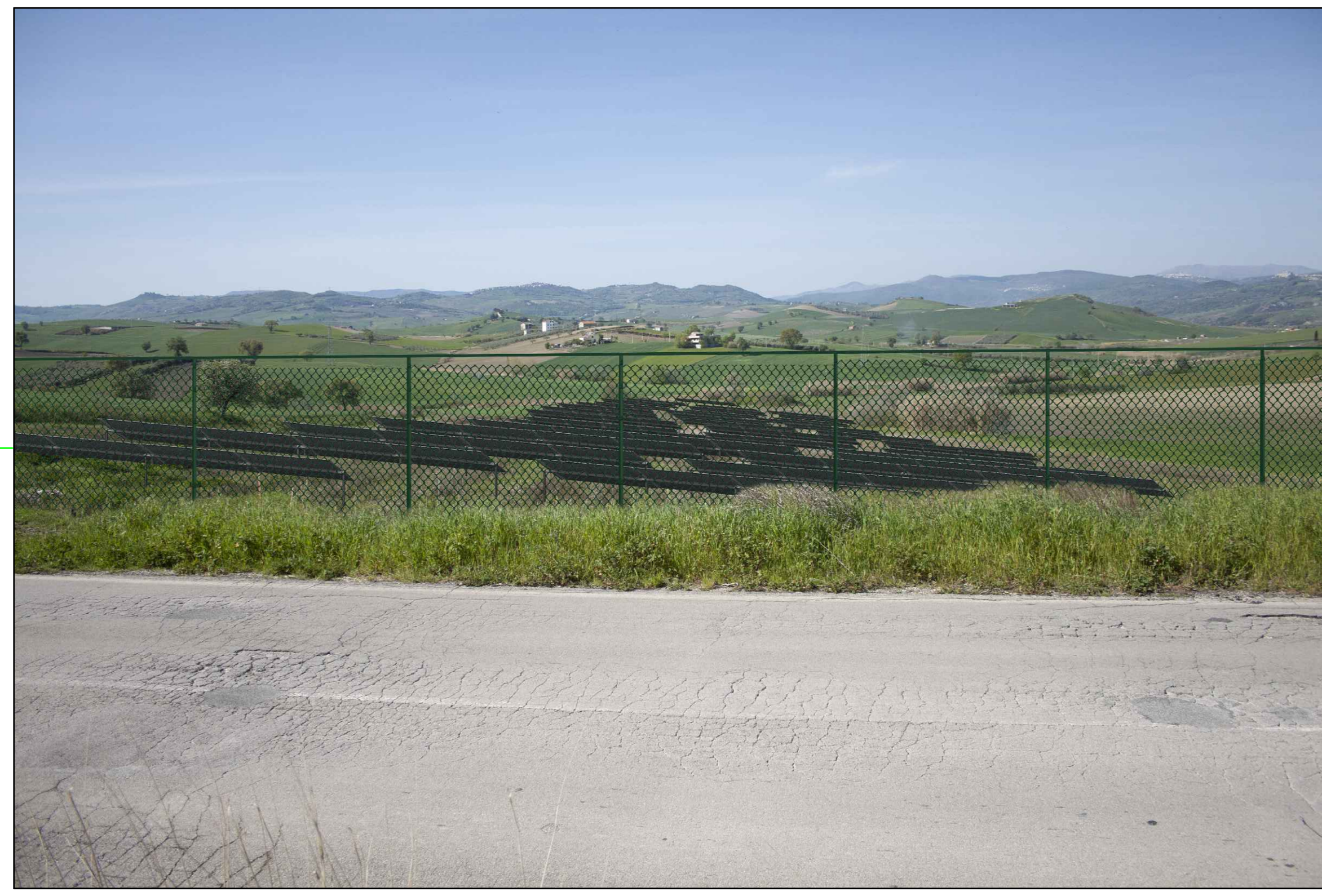
9 (S.da Comunale Chiatalonga) VISTA DELL'IMPIANTO SENZA MITIGAZIONE