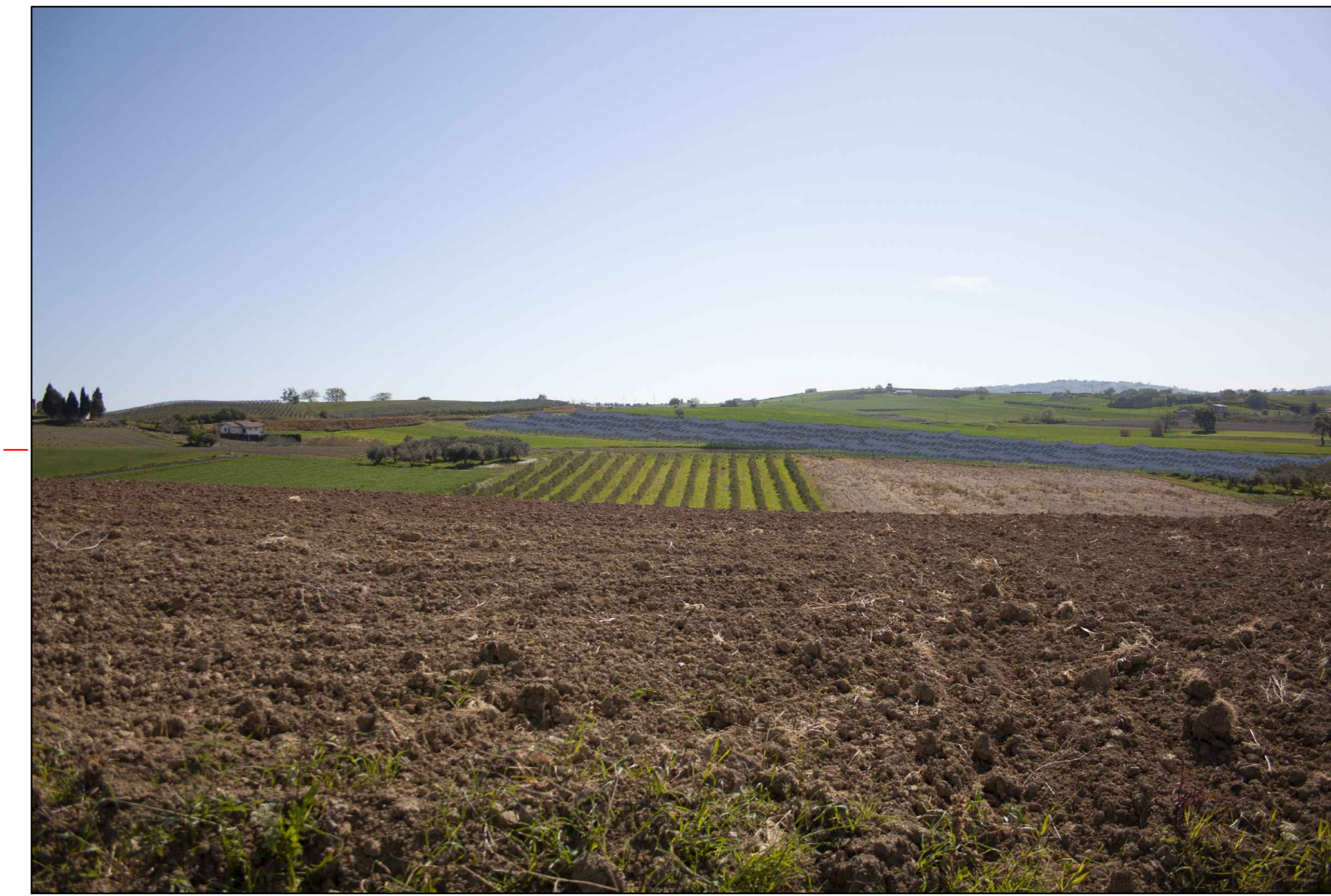
9 (42°00'19.43"N - 14°45'33.30"E) VISTA DELL'IMPIANTO SENZA MITIGAZIONE