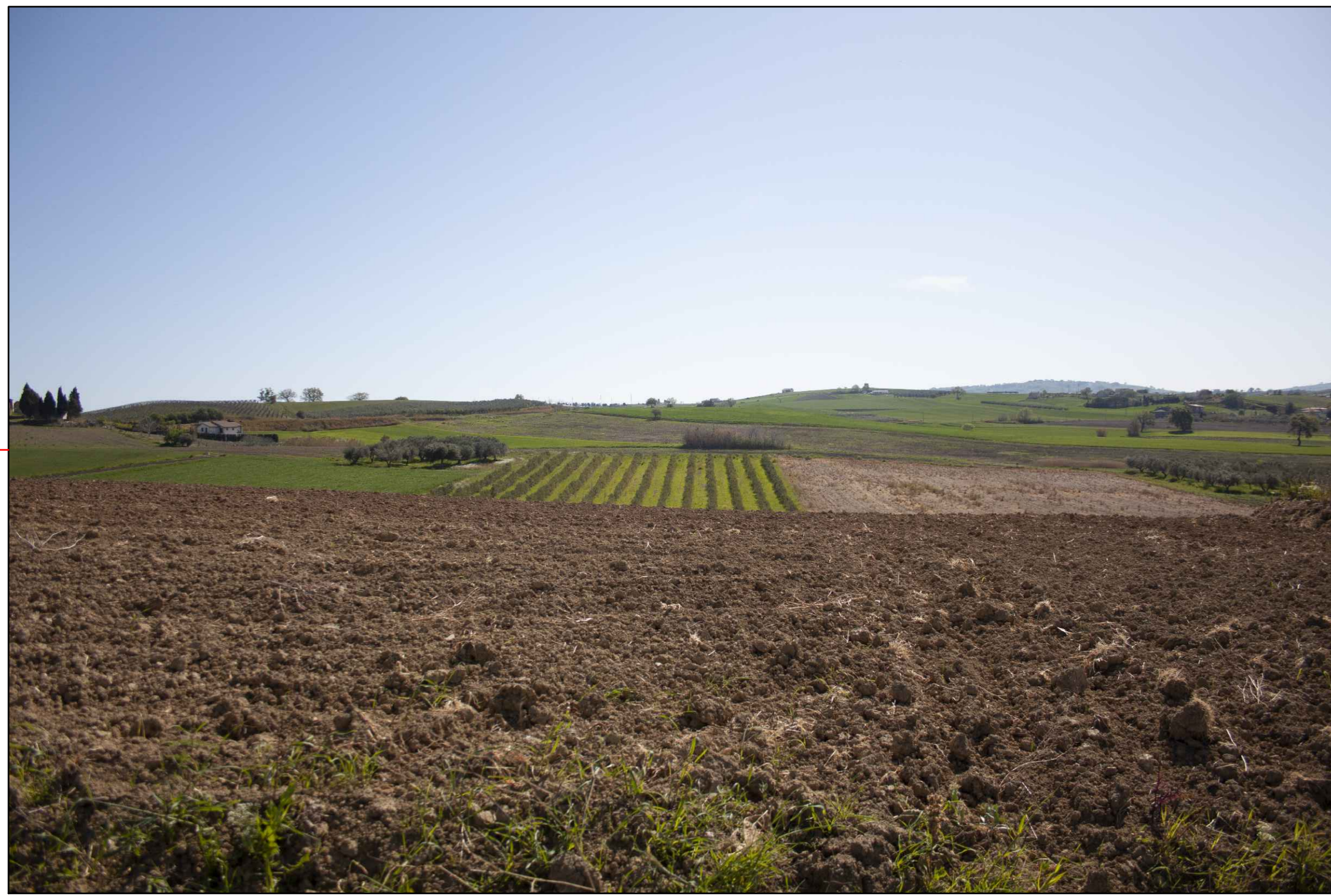
9 (42°00'19.43"N - 14°45'33.30"E) VISTA DELL'IMPIANTO ANTE-OPERAM