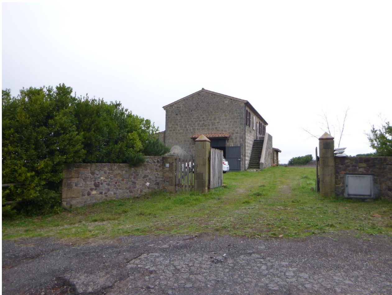
Figura 3: Ricettore REC44

Il fabbricato oggetto di verifica è costituito da due piani fuori terra con copertura a falde, con struttura in muratura. Le fondazioni sono ipotizzate come cordoli in pietra a contorno del perimetro portante dell'edificio. Utilizzati come fabbricati per attività agricole e prevalentemente per ricovero di attrezzature agricole e deposito.