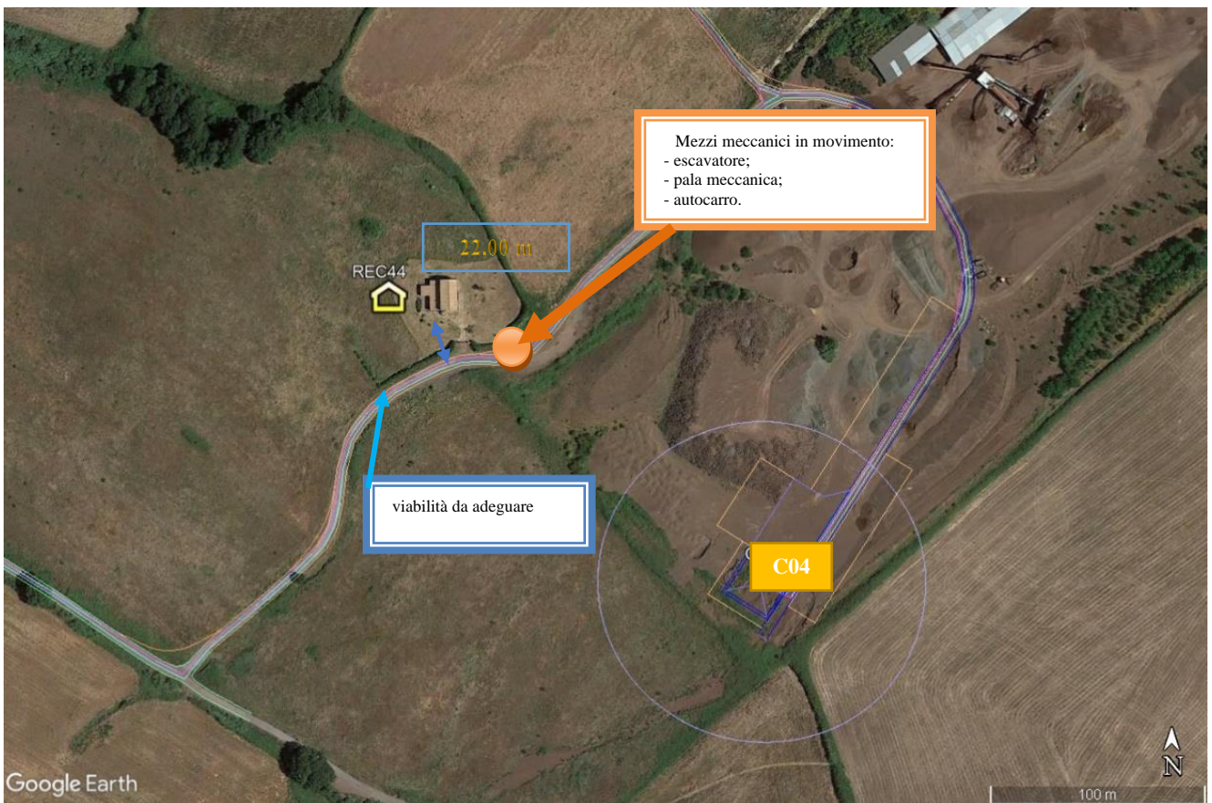
Figura 1: scenario n.1 adeguamento viabilità

Individuazione dei ricettori maggiormente esposti e della disposizione dei macchinari nelle due fasi lavorative: