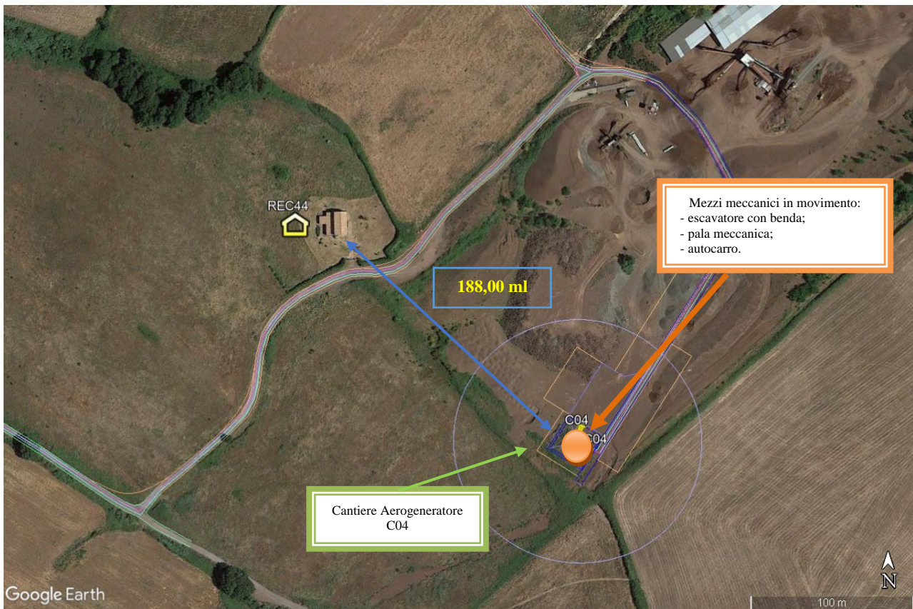
Figura 2: scenario 2 fondazioni WTG C04

Nelle immagini precedenti sono descritte le due condizioni al limite più sfavorevoli: