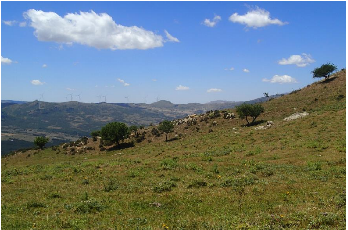
Figura 2-6: Foto 3 - Post-operam