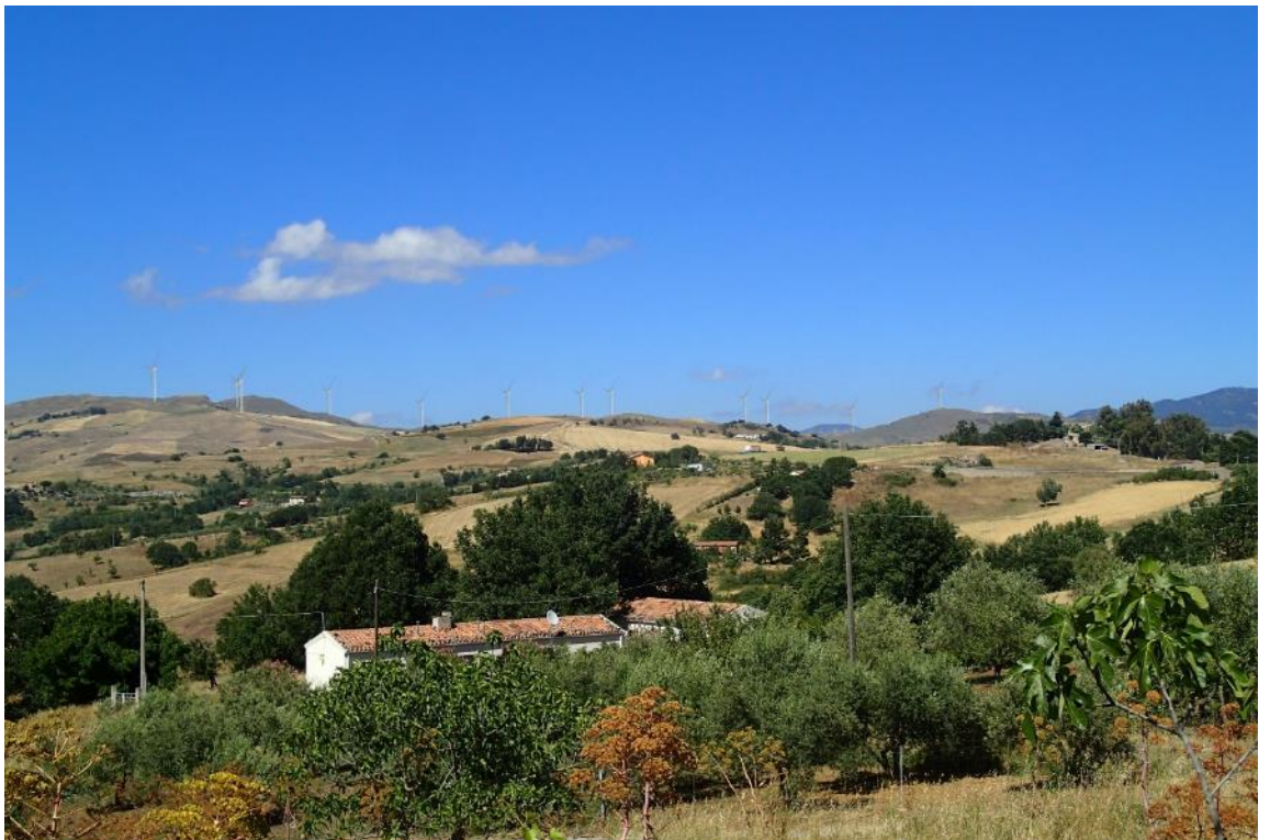
Figura 2-30: Foto 15 - Post-operam