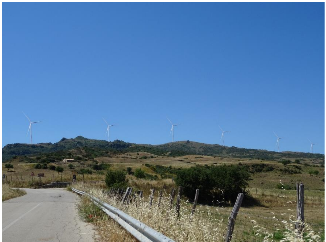
Figura 2-36: Foto 18 - Post-operam