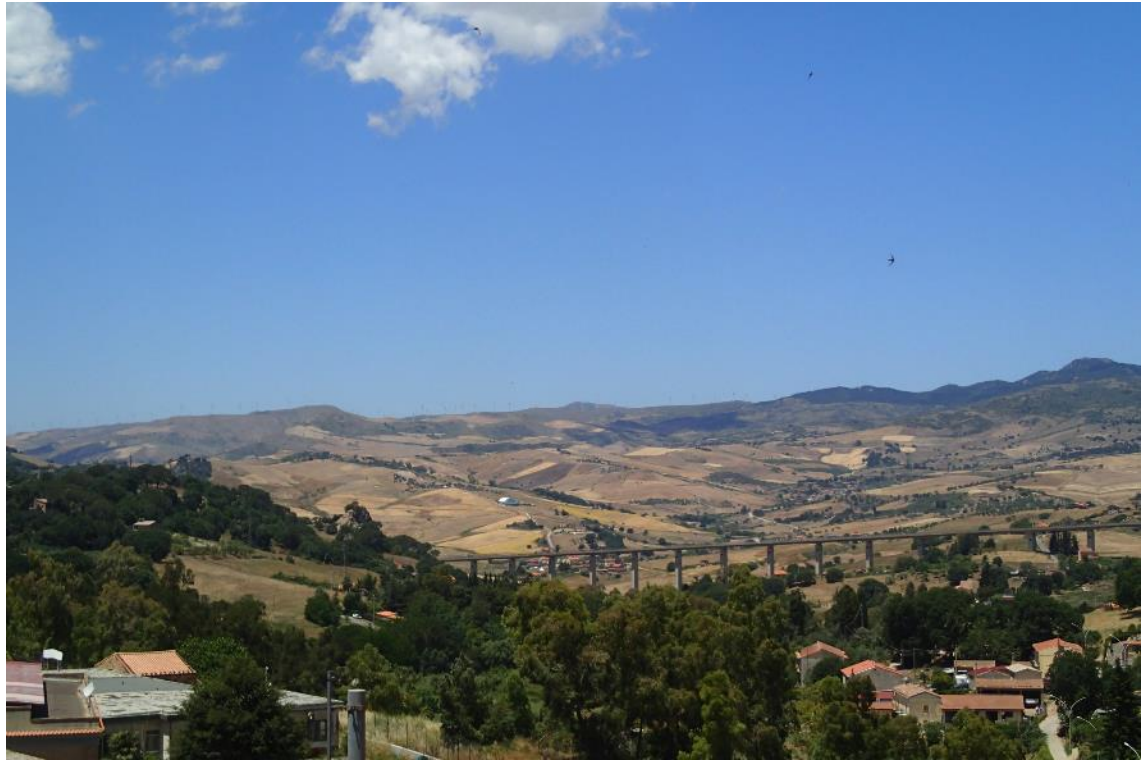
Figura 2-39: Foto 20 - Ante-operam