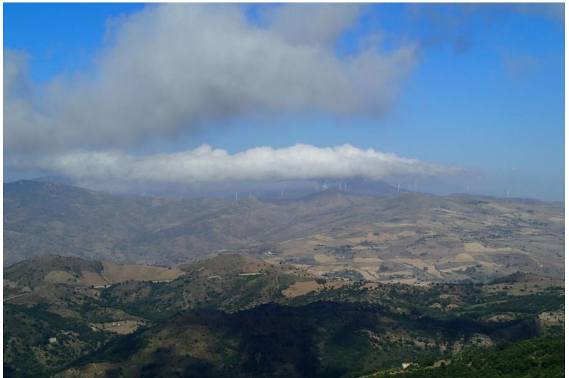
Figura 2-26: Foto 13 - Post-operam