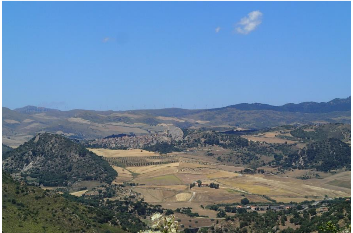
Figura 2-15: Foto 8 - Ante-operam