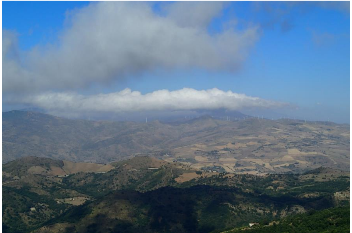
Figura 2-25: Foto 13 - Ante-operam