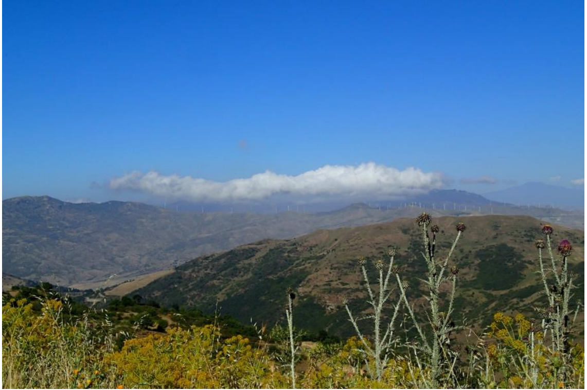
Figura 2-31: Foto 16 - Ante-operam