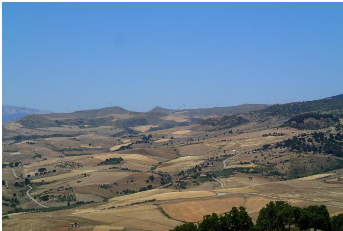
Figura 2-11: Foto 6 - Ante-operam