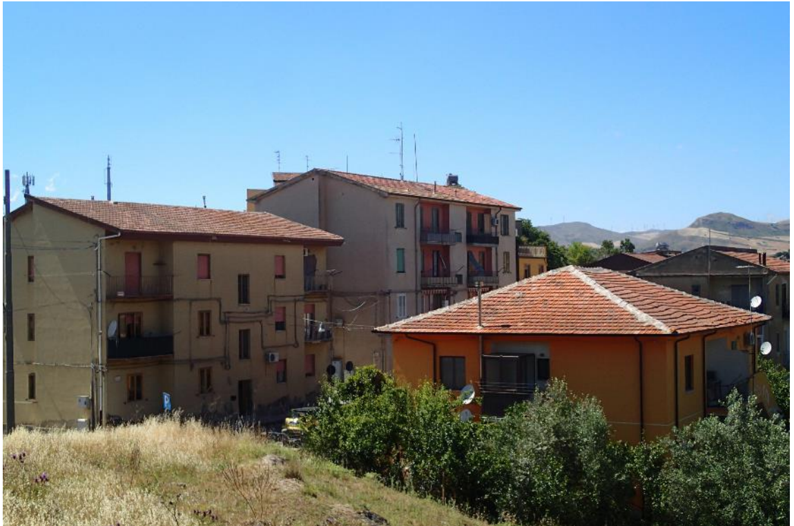
Figura 2-19: Foto 10 - Ante-operam