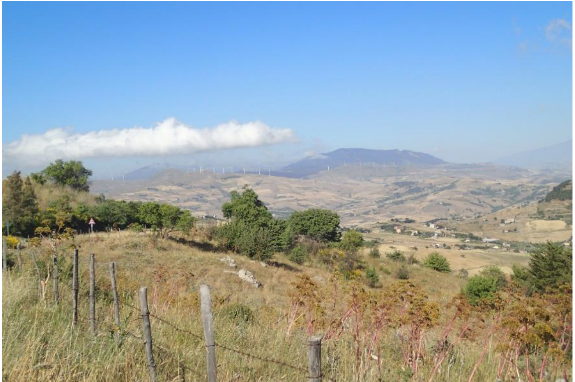
Figura 2-27: Foto 14 - Ante-operam