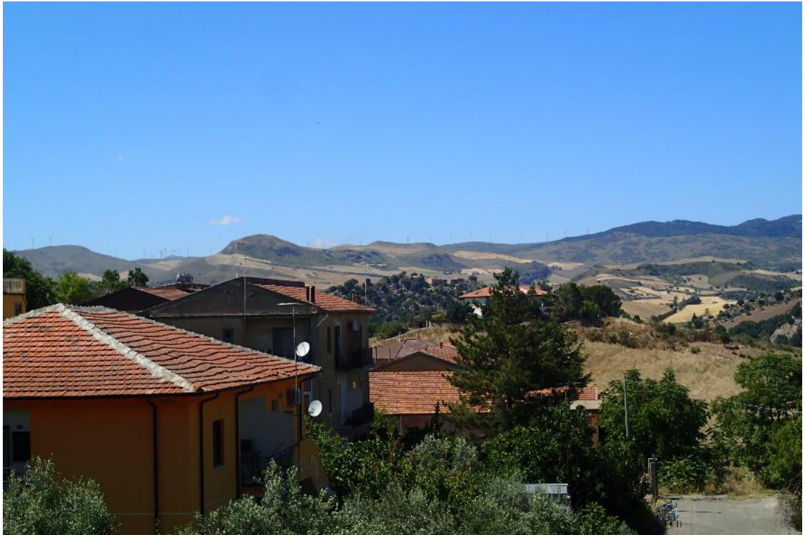
Figura 2-17: Foto 9 - Ante-operam