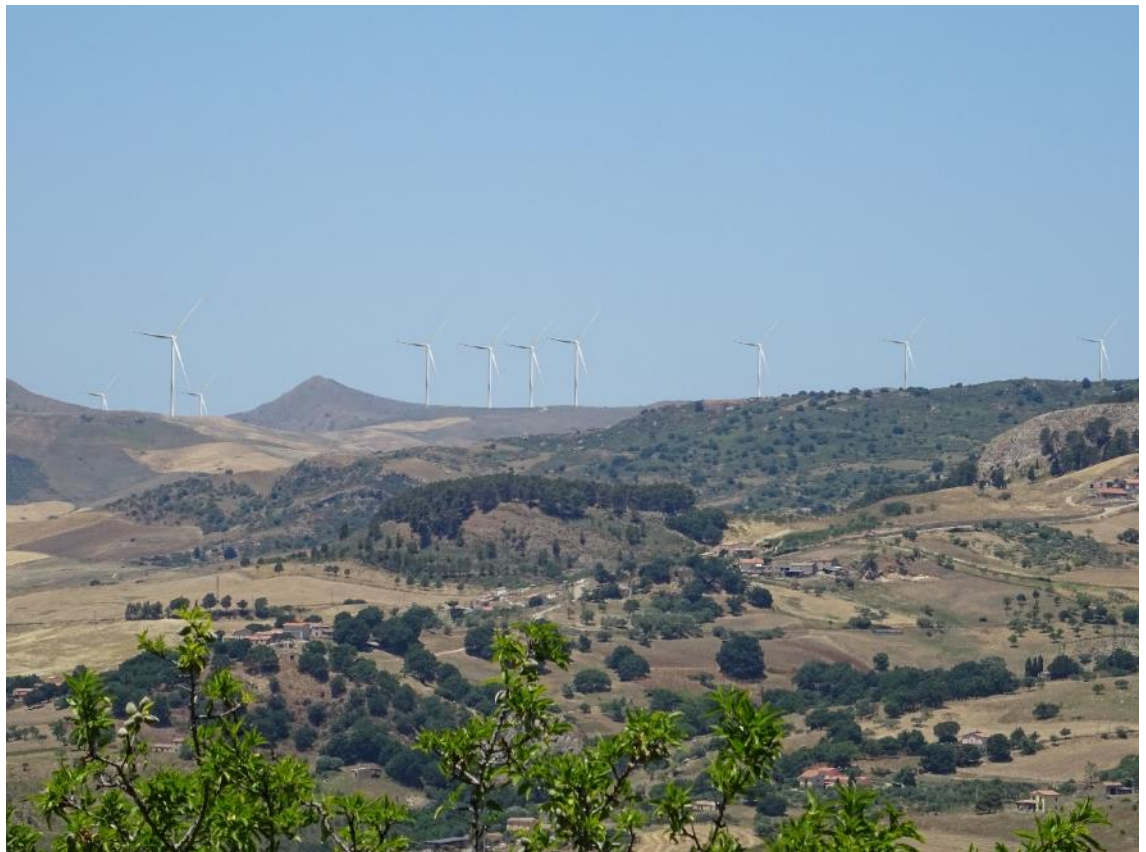
Figura 2-38: Foto 19 - Post-operam