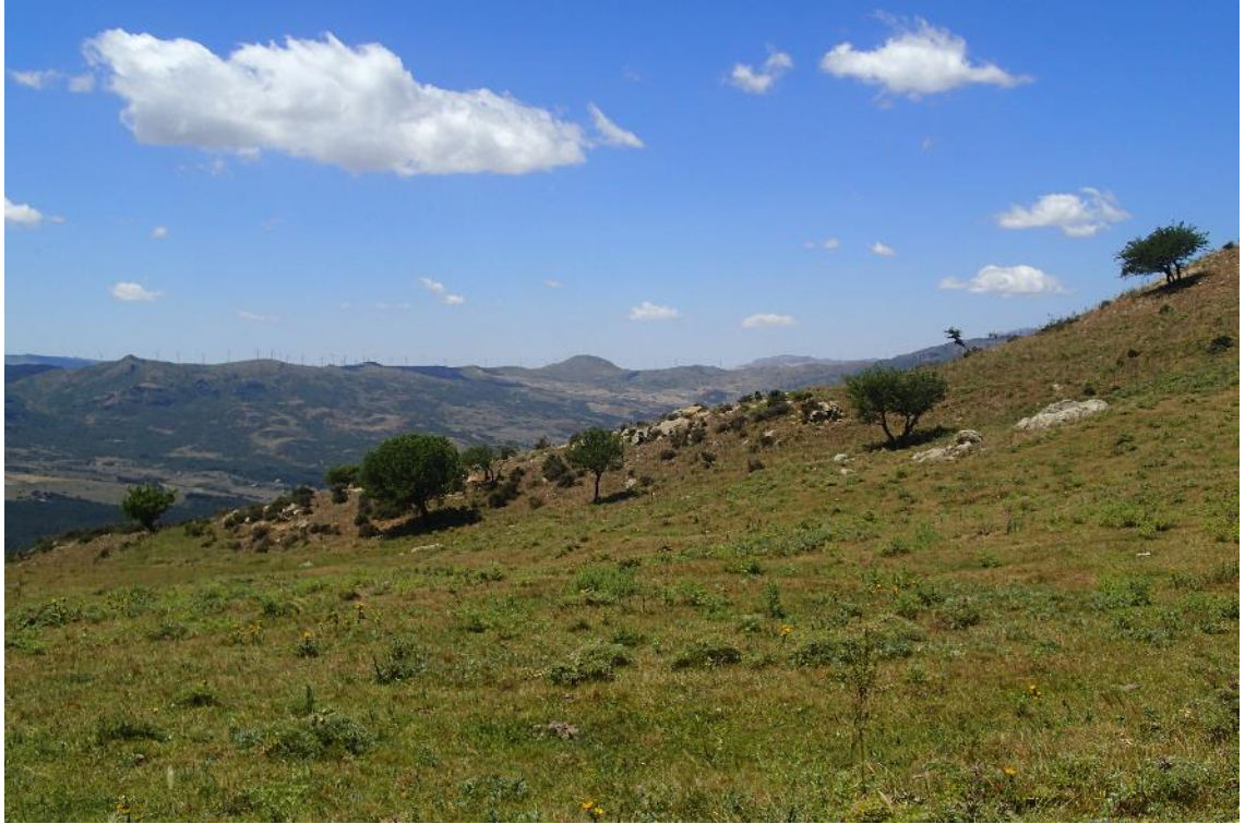
Figura 2-5: Foto 3 - Ante-operam