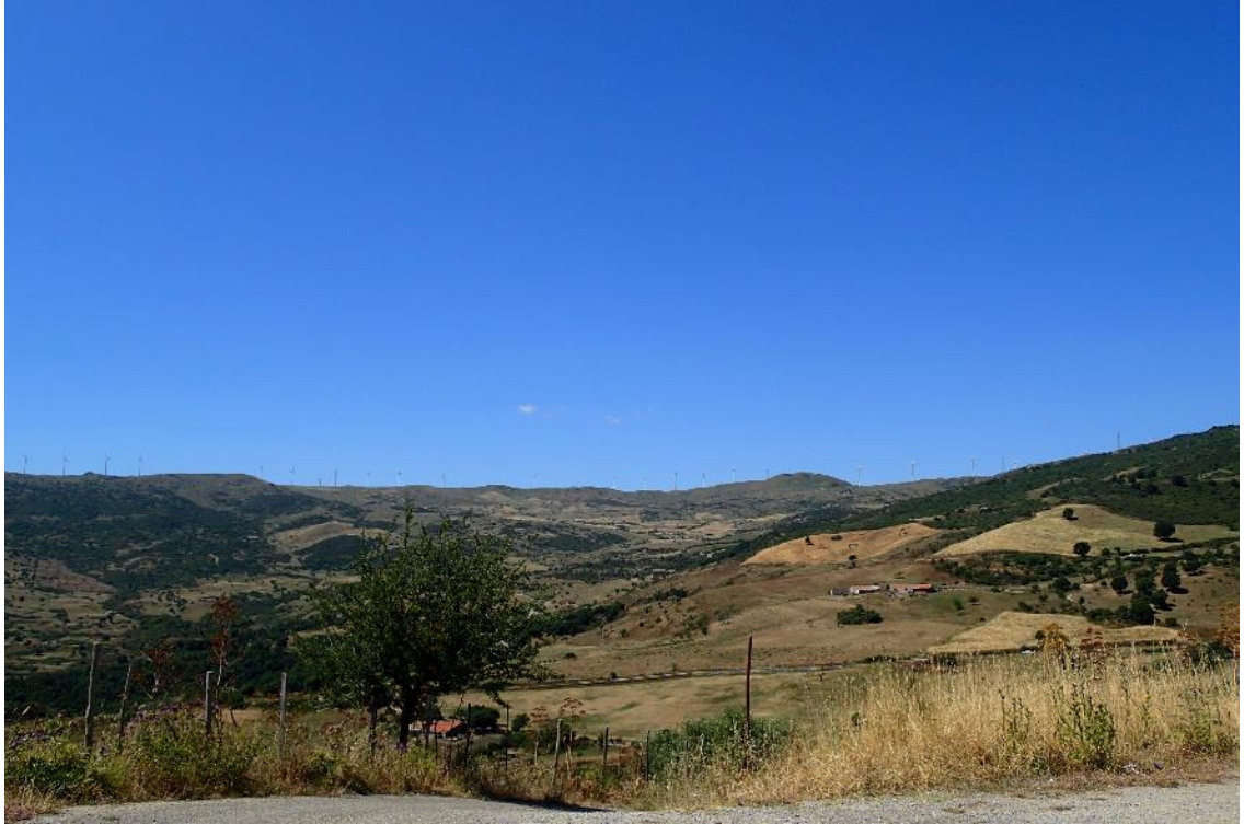
Figura 2-3: Foto 2 - Ante-operam