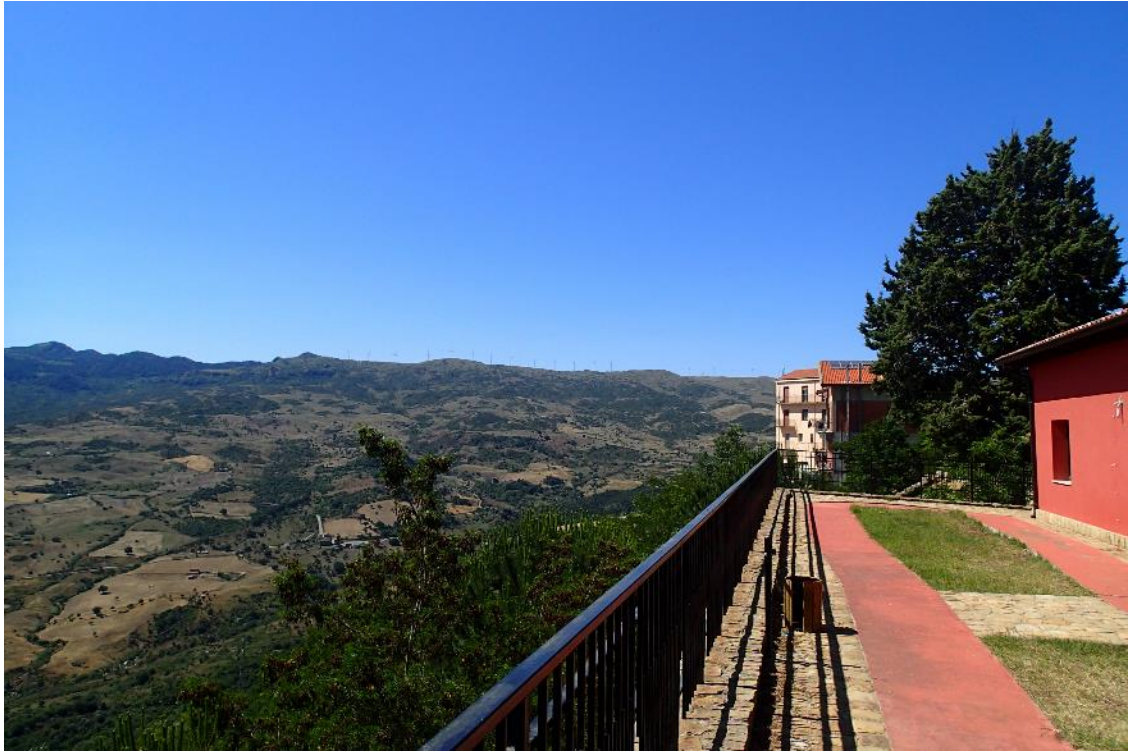
Figura 2-1: Foto 1 - Ante-operam