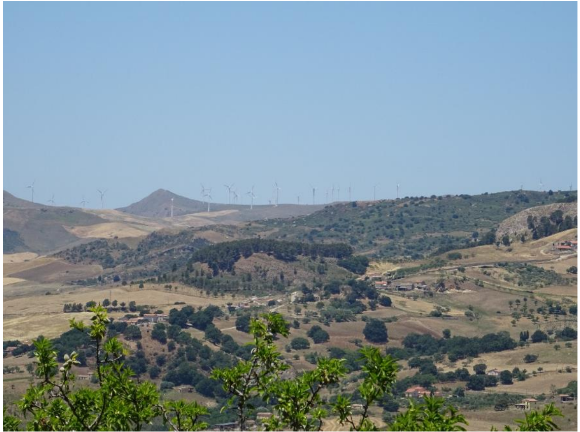
Figura 2-37: Foto 19 - Ante-operam