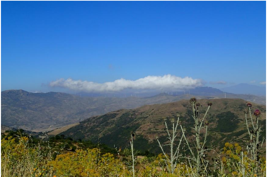
Figura 2-32: Foto 16 - Post-operam