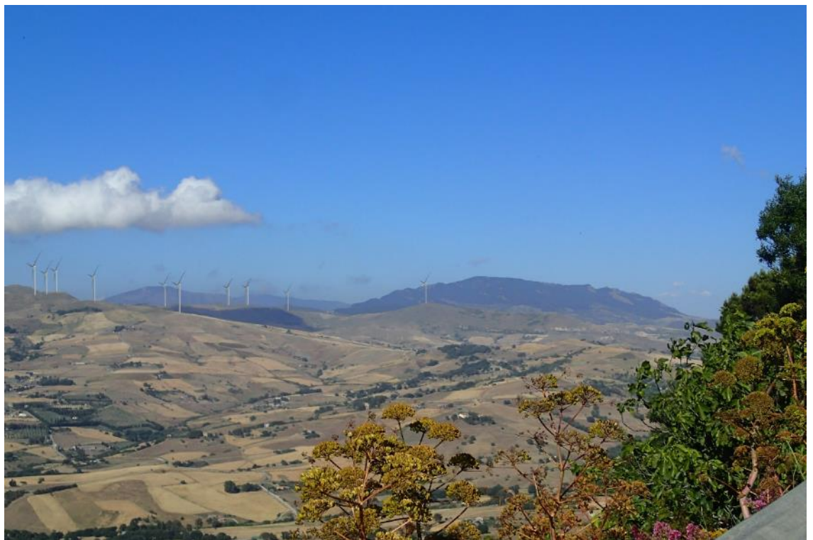
Figura 2-24: Foto 12 - Post-operam