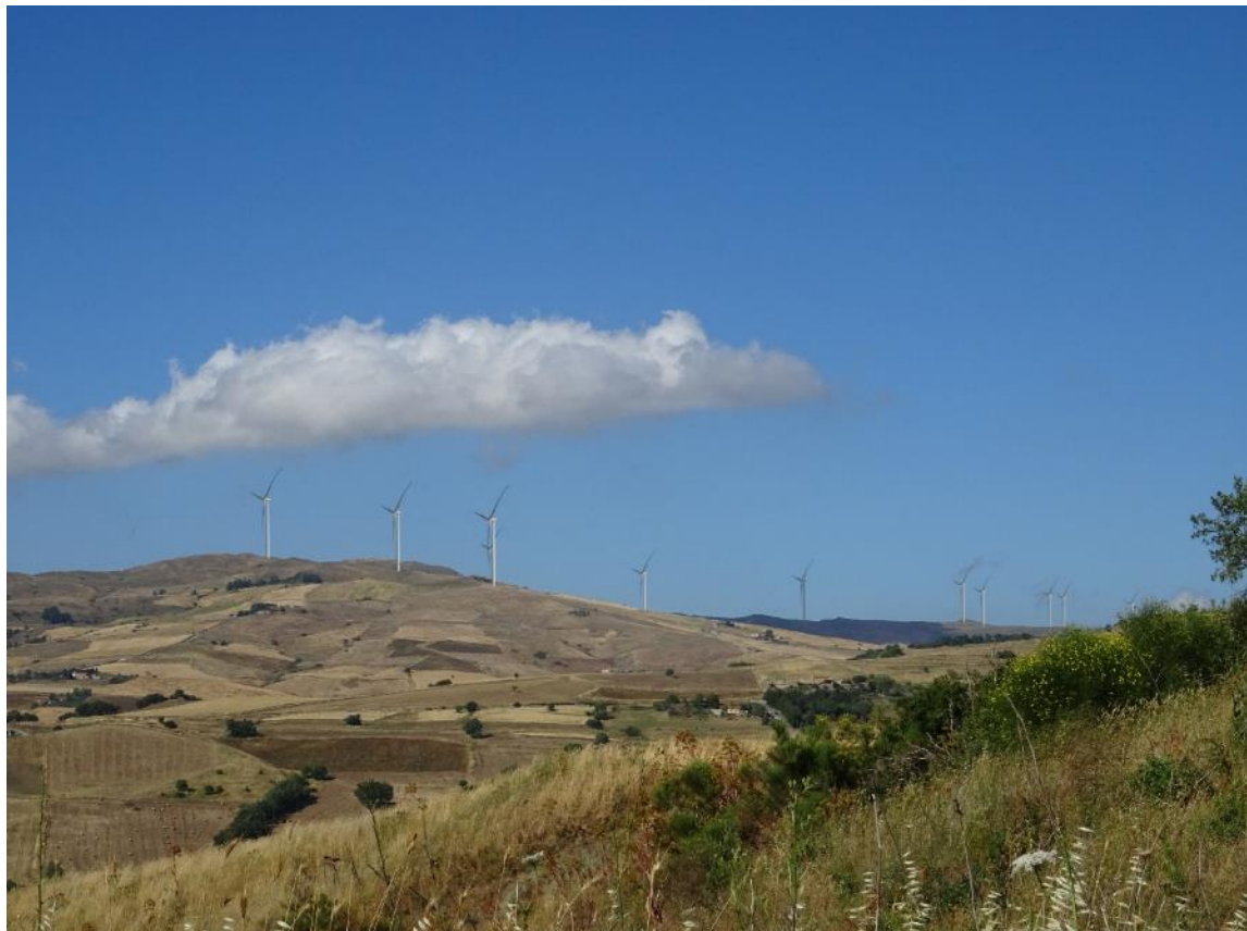
Figura 2-34: Foto 17 - Post-operam