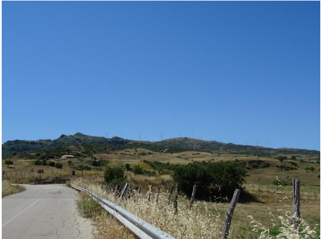
Figura 2-35: Foto 18 - Ante-operam