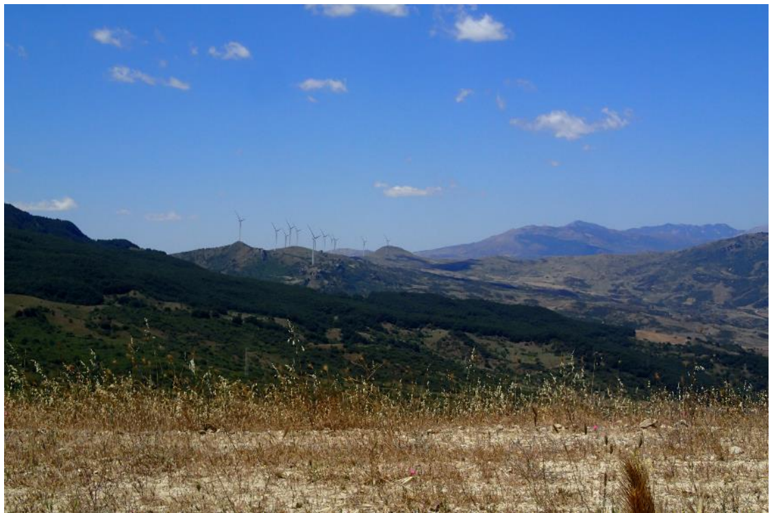
Figura 2-10: Foto 5 - Post-operam