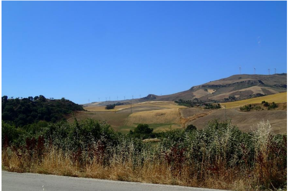
Figura 2-21: Foto 11 - Ante-operam