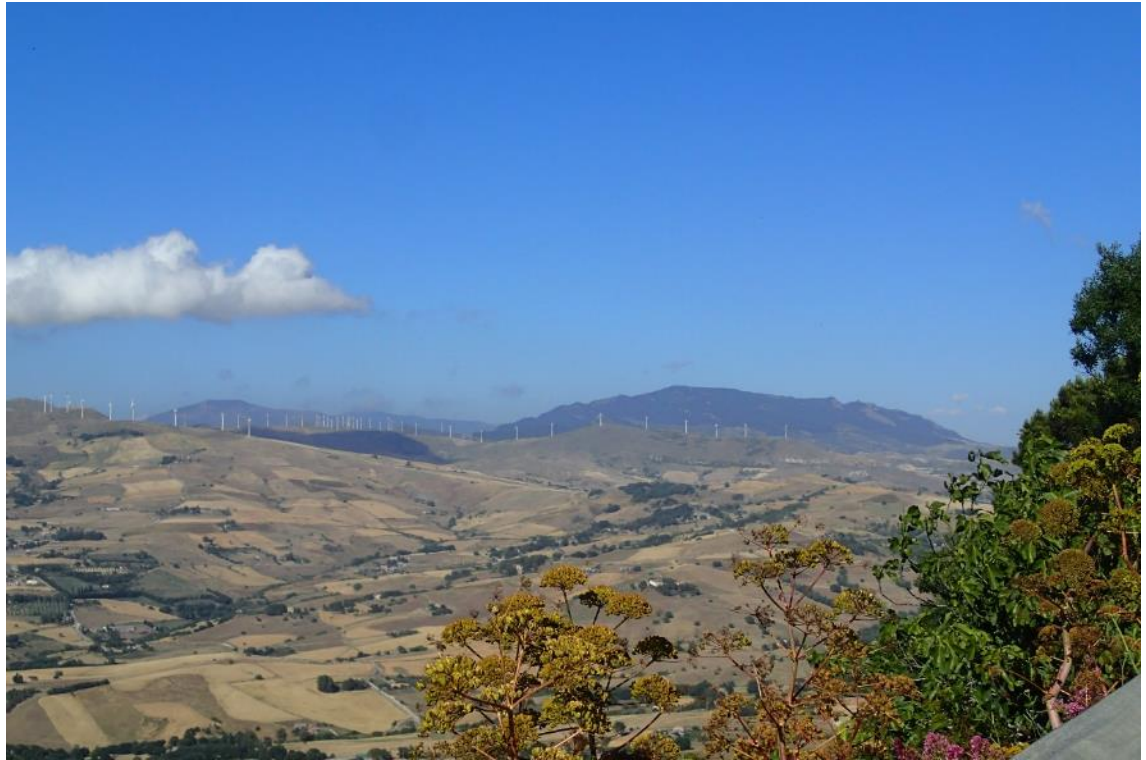
Figura 2-23: Foto 12 - Ante-operam