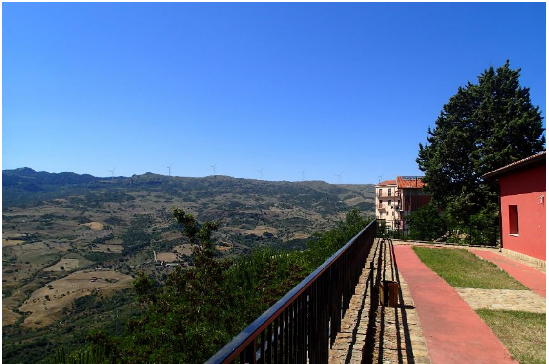
Figura 2-2: Foto 1 - Post-operam