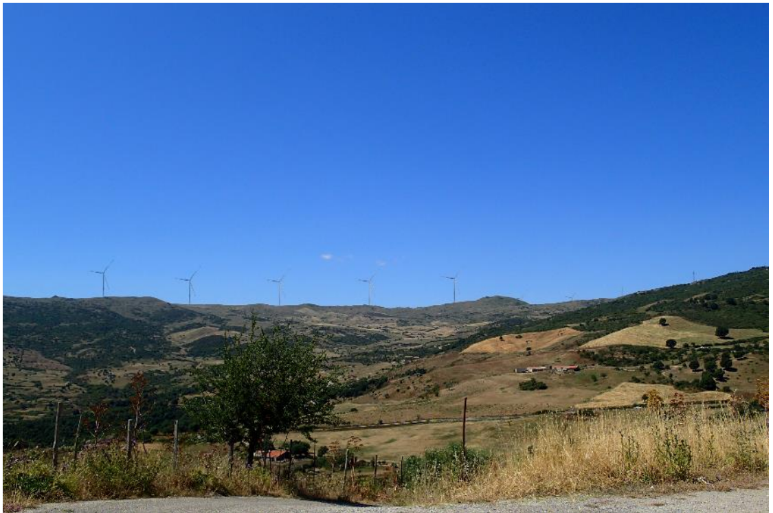
Figura 2-4: Foto 2 - Post-operam