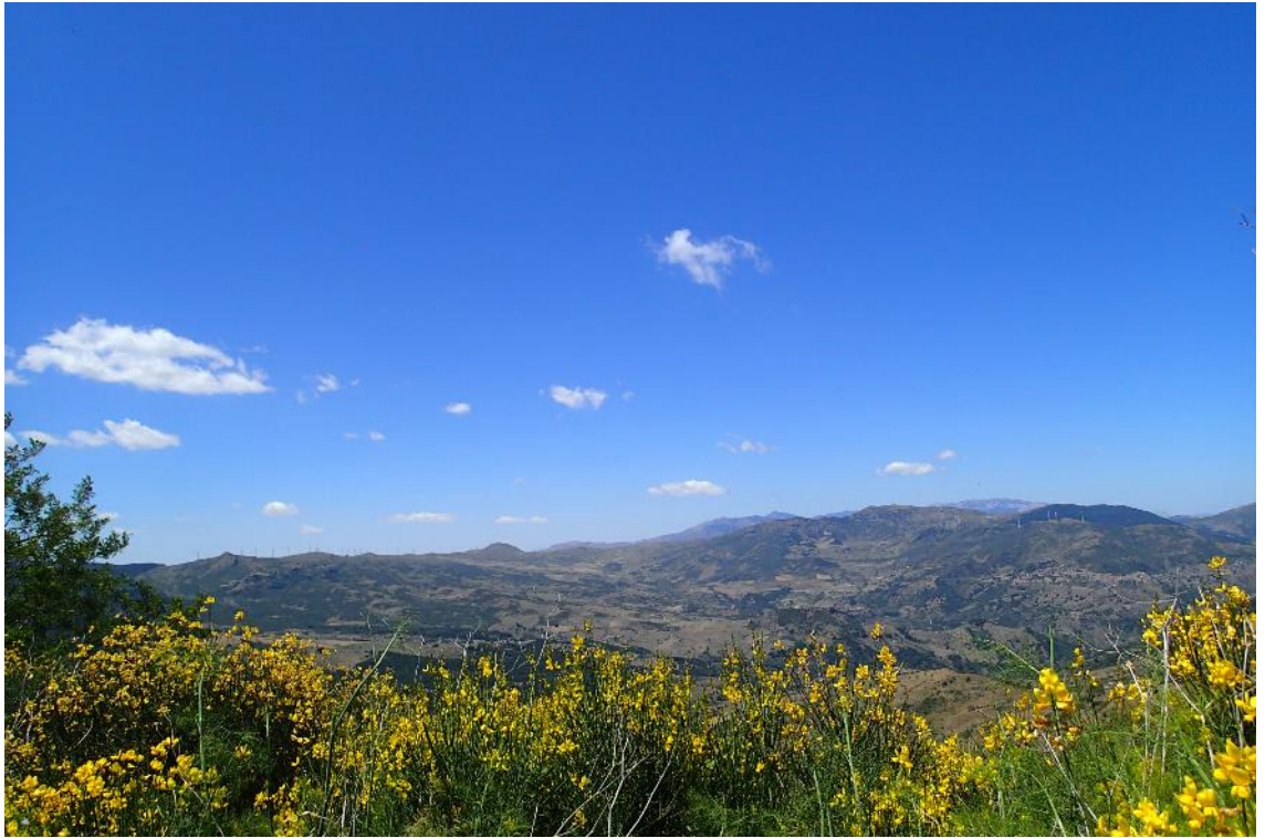
Figura 2-7: Foto 4 - Ante-operam