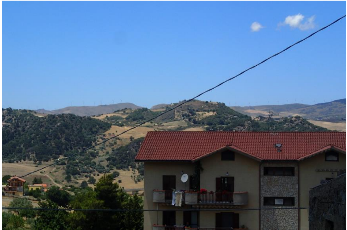
Figura 2-13: Foto 7 - Ante-operam