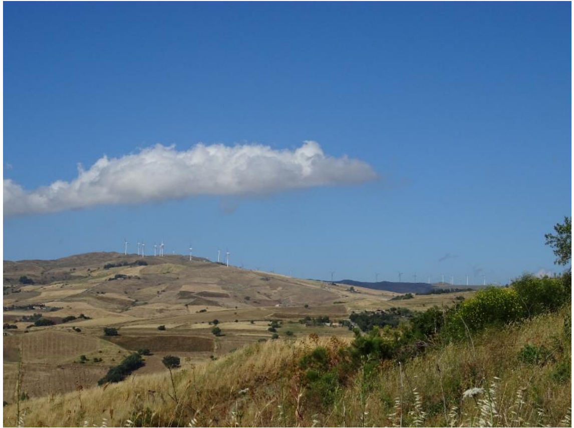
Figura 2-33: Foto 17 - Ante-operam