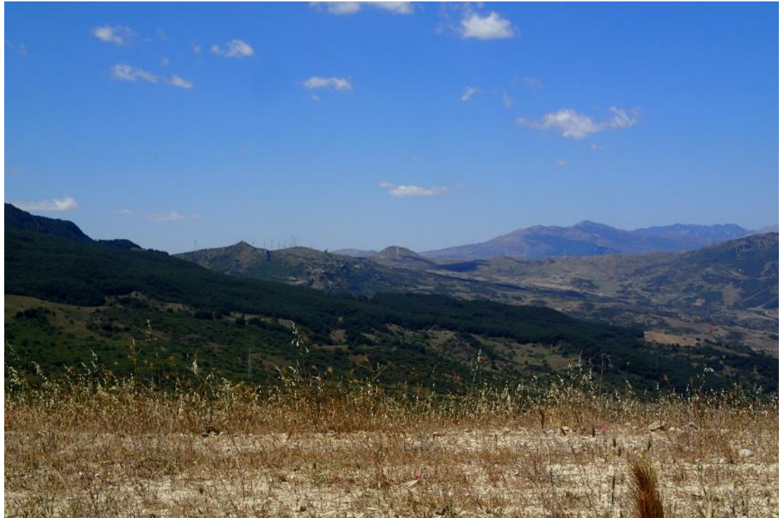
Figura 2-9: Foto 5 - Ante-operam