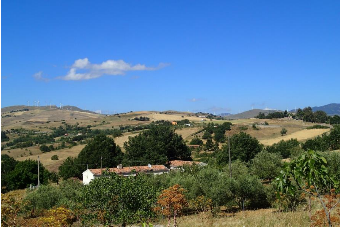
Figura 2-29: Foto 15 - Ante-operam