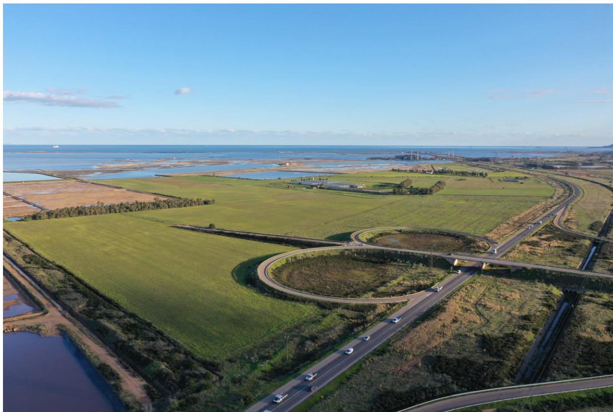
Vista aerea 3