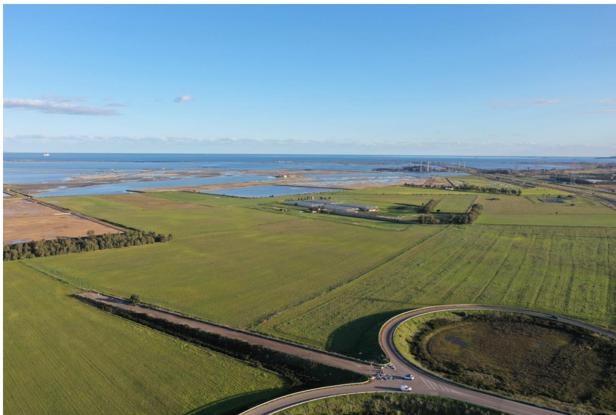
Vista aerea 4