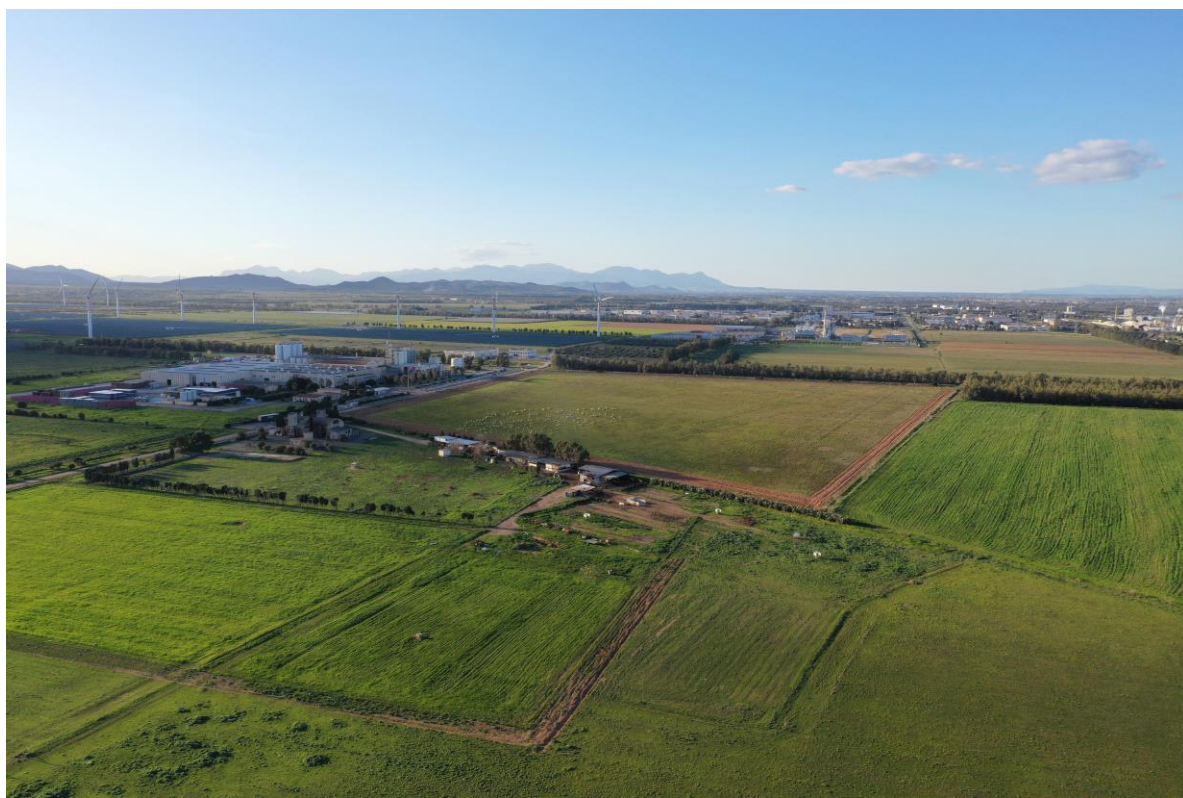
Vista aerea 2