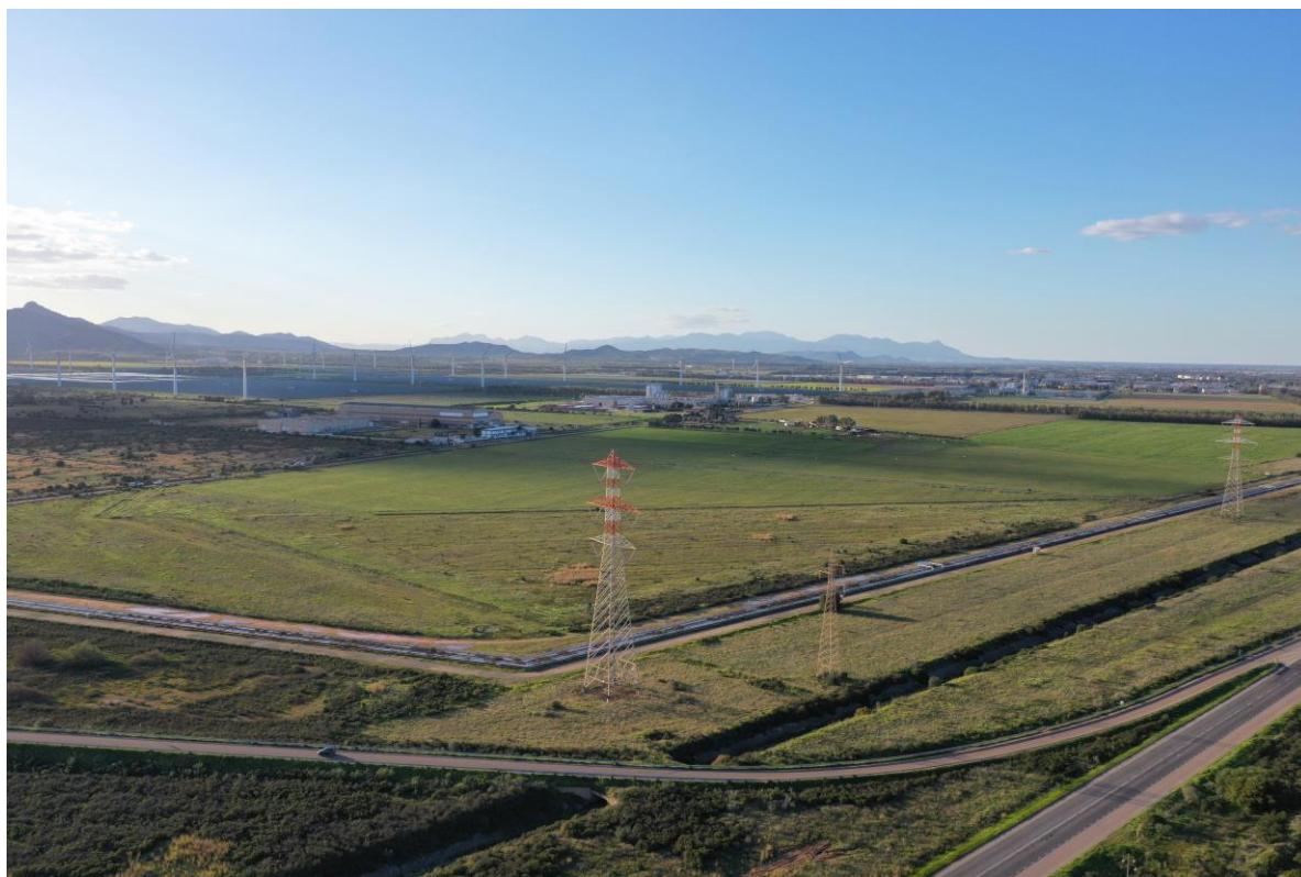
vista aerea 1