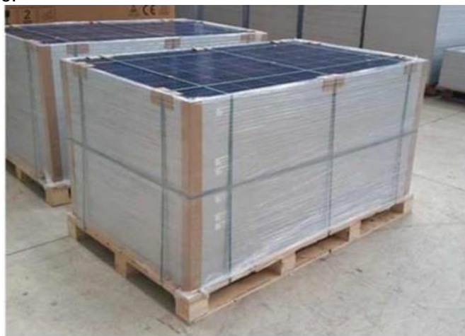
FIGURA 2 - IMBALLAGGIO DEI PANNELLI

I moduli dovranno essere disposti sul bancale con il vetro anteriore rivolto verso l'alto, inoltre dovranno essere adagiati con precisione, con spigoli adiacenti, in modo da poter scaricare il loro peso in modo uniforme sul bancale. Le dimensioni ottimali della base di appoggio di un bancale sono (lux la) 1100 – 1700 x 1000 mm ovvero in grado di far poggiare i moduli nella loro interezza al lato corto sulla base del bancale stesso. Il bancale deve essere di tipo robusto, strutturato per sopportare un peso fino a 900 kg 6. I moduli dovranno essere adeguatamente immobilizzati sui bancali tramite opportuna e salda reggiatura, come illustrato nella foto esempio.