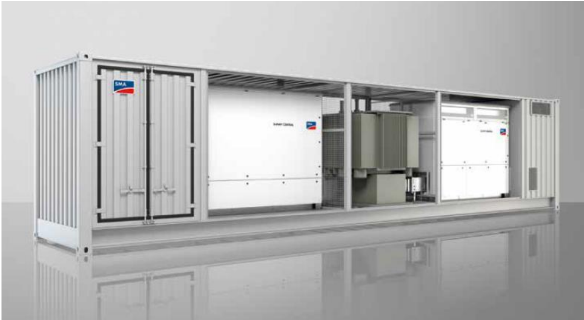
FIGURA 5 - IMMAGINI DI UNA CABINA DI TRASFORMAZIONE

I locali che alloggiavano inverter e trasformatori, nonché quello per la consegna e per lo smistamento, sono cabine elettriche prefabbricate monoblocco omologate che a fine ciclo possono essere prelevate e ricollocate in altro sito e che comunque sono recuperabili integralmente sia per quanto riguarda le cabine che tutte le apparecchiature interne, inclusi i collegamenti MT e BT.