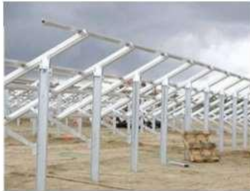
FIGURA 3 - STRUTTURE DI SOSTEGNO (TRACKER)

Le strutture previste, essendo installate senza utilizzare calcestruzzo, possono essere smontate e riciclate completamente; viene utilizzato solo acciaio zincato a caldo per i pali di fondazione ed alluminio per tutto il resto. L' alluminio ha anche un valore di rottura abbastanza alto, quindi, può essere venduto quando verrà smontato l'impianto.