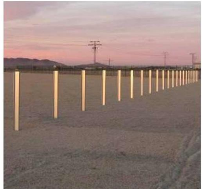
FIGURA 4 - IMMAGINI DI ESTRAZIONE DEI PALI