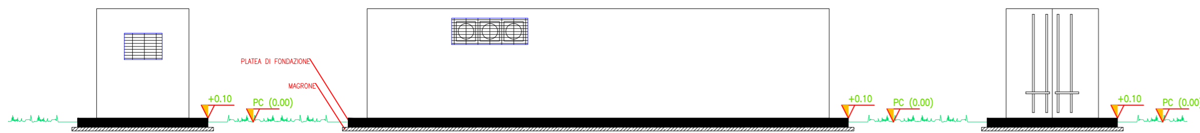
VISTA LATERALE C