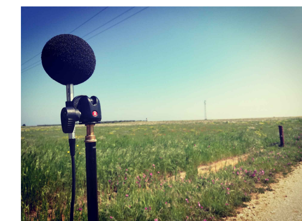
RILIEVO STRUMENTALE IN SITO VALUTAZIONE DI IMPATTO ACUSTICO

COMUNE DI BRINDISI Provincia di Brindisi