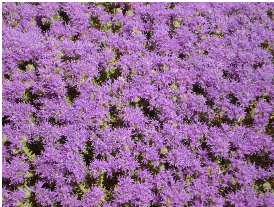
Figura 11: Timo rosa capitato (Thymuscapitatus L)