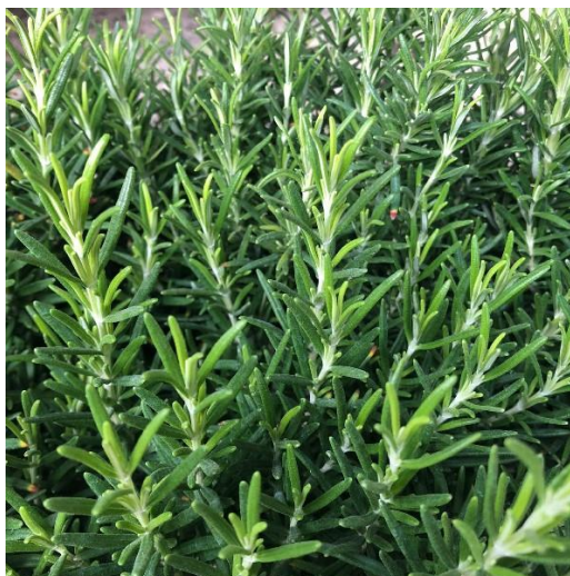
Figura 17: Rosmarino (Rosmarinus officinalis L.)