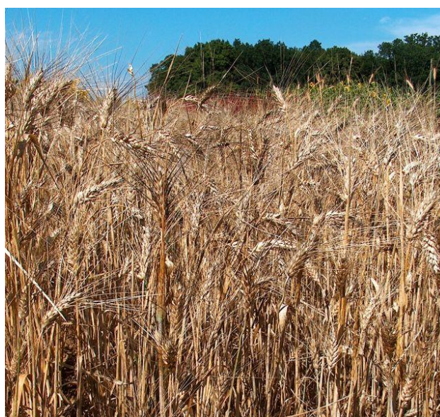
Figura 14: Grano Duro (Triticum durum Desf.)