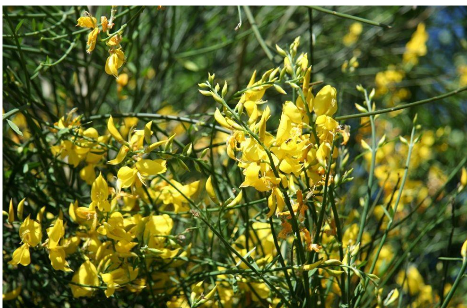
Figura 20: Ginestra (Spartiumjunceum L)