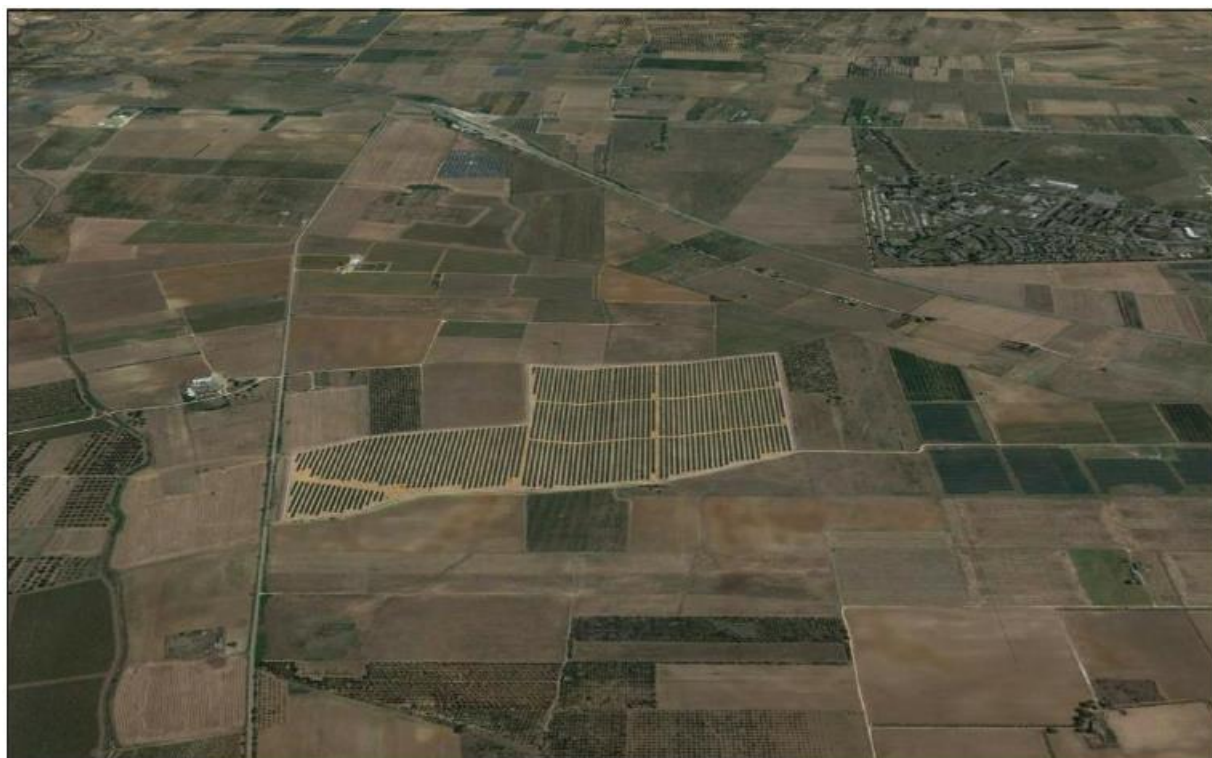
Figura 3: fotosimulazione a volo d'uccello – lato sud