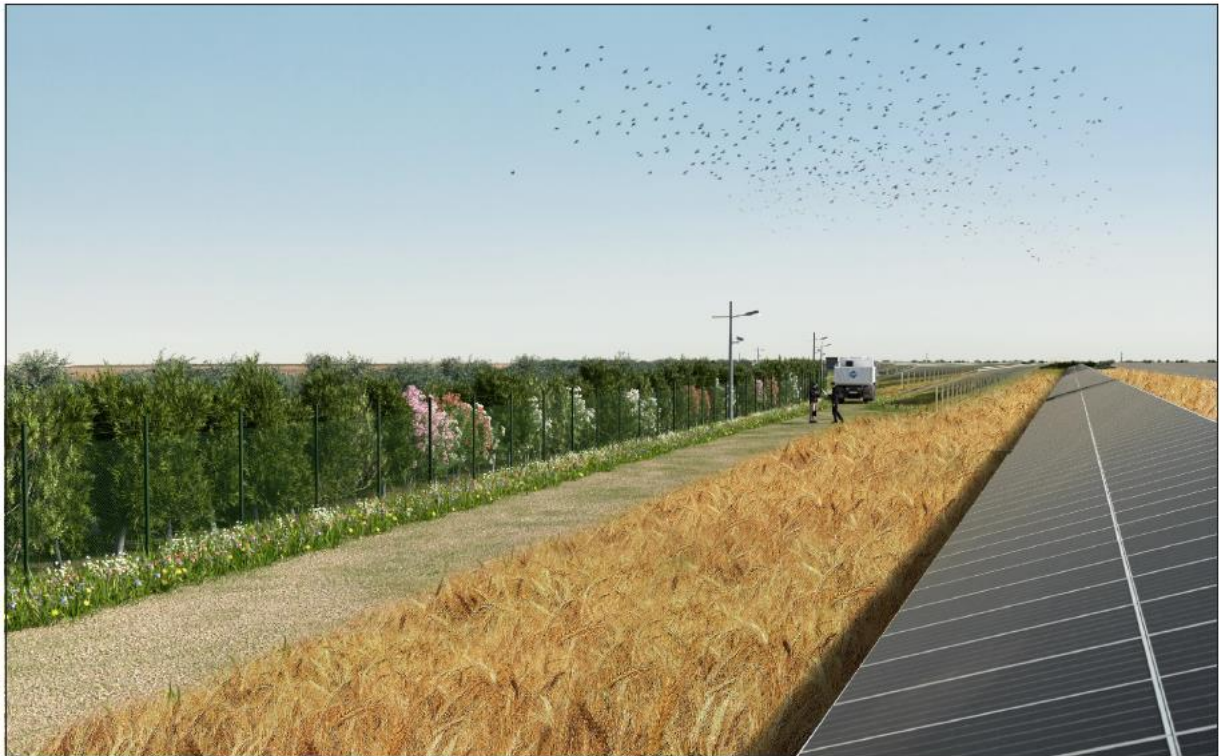
Figura 8: fotosimulazione (area impianto) – vista 2 - lato sud