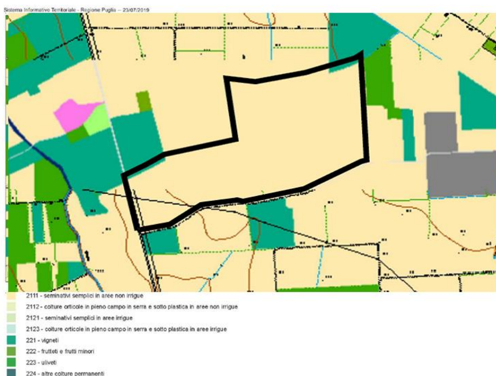
Figura 10: localizzazione delle particelle catastali di intervento e classi di Uso del Suolo

Altre verifiche cartografiche sono state condotte guardando la Carta di capacità di uso del suolo (schede degli ambiti paesaggistici – elaborato n° 5 dello schema di PPTR). A tal proposito per una valutazione delle aree a seminativo, incolto, pascolo, ecc. sono state analizzati i fattori intrinseci relativi che interagiscono con la capacità di uso del suolo limitandone l'utilizzazione a fini agricoli. In riferimento alla medesima Carta di capacità di uso del suolo predisposta dalla Regione Puglia ed alla relativa classificazione riportata in tabella che segue, è stato verificato che i terreni oggetto di progetto possono essere riferibili alla Classe II.