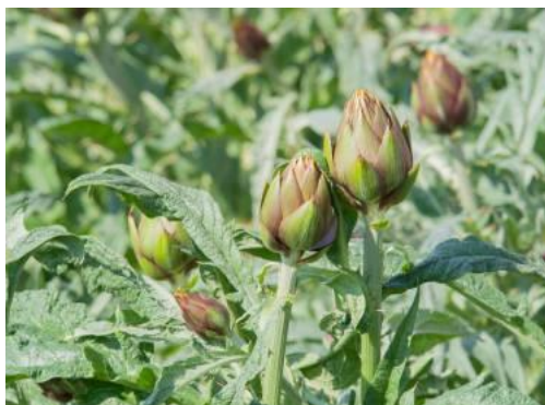
Figura 15: Carciofo Brindisino IGP (Cynaracardunculus var. Scolymus L.)