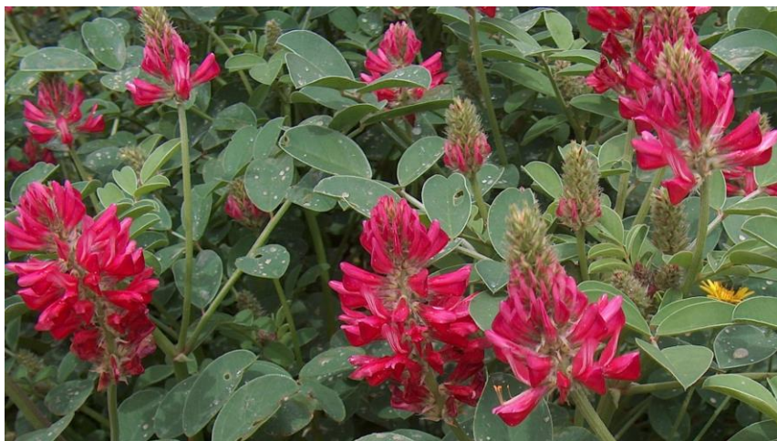
Figura 16: Sulla (Hedysarum coronarium L.)