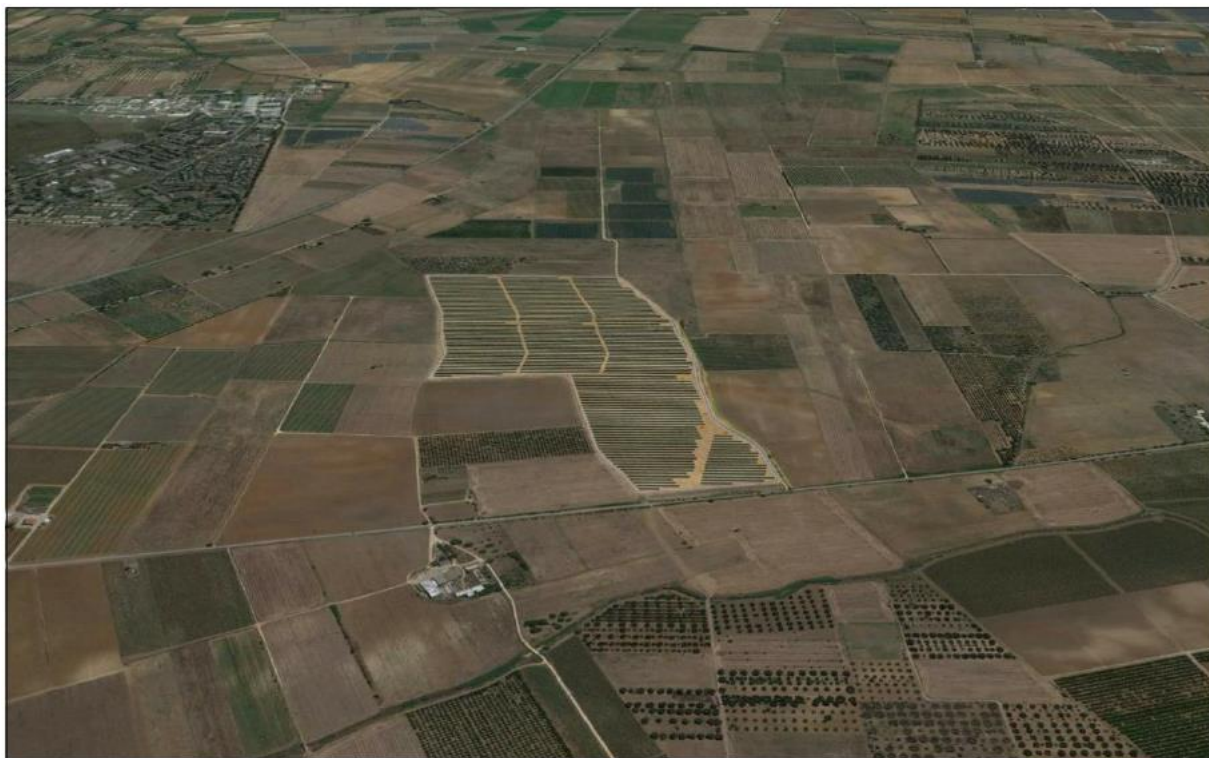
Figura 4: fotosimulazione a volo d'uccello – lato ovest