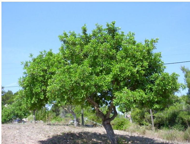
Figura 21: Carrubo (Ceratonia siliqua L.)