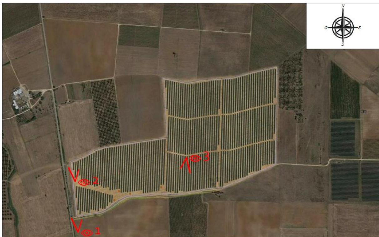
Figura 6: fotosimulazione dall'alto – vista ortogonale