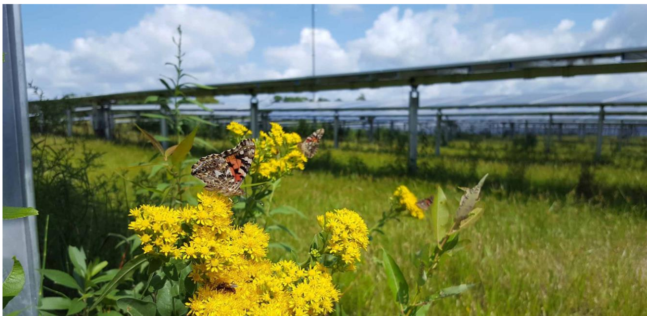
Figura 22: Impollinazione e tracker

Molti studi si stanno infatti concentrando sui servizi ecosistemici che le aree naturali e semi-naturali possono generare. In particolare, viene identificata come biodiversità funzionale, quella quota di biodiversità che è in grado di generare dei servizi utili per l'uomo. Accentuare la componente funzionale della biodiversità vuol dire dunque aumentare i servizi forniti dall'ambiente all'uomo. Nel caso in progetto, studiando attentamente le specie da utilizzare è possibile generare importantissimi servizi per l'agricoltura, quali: aumento dell'impollinazione delle colture agrarie (con conseguente aumento della produzione), aumento nella presenza di insetti e microrganismi benefici (in grado di contrastare la diffusione di malattie e parassiti delle piante); arricchimento della fertilità del suolo attraverso il sovescio o l'utilizzo come pacciamatura naturale della biomassa prodotta alla fine del ciclo vegetativo.