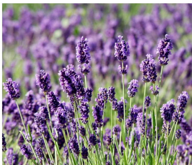
Figura 12: Lavanda (Lavandula latifoliae L.)