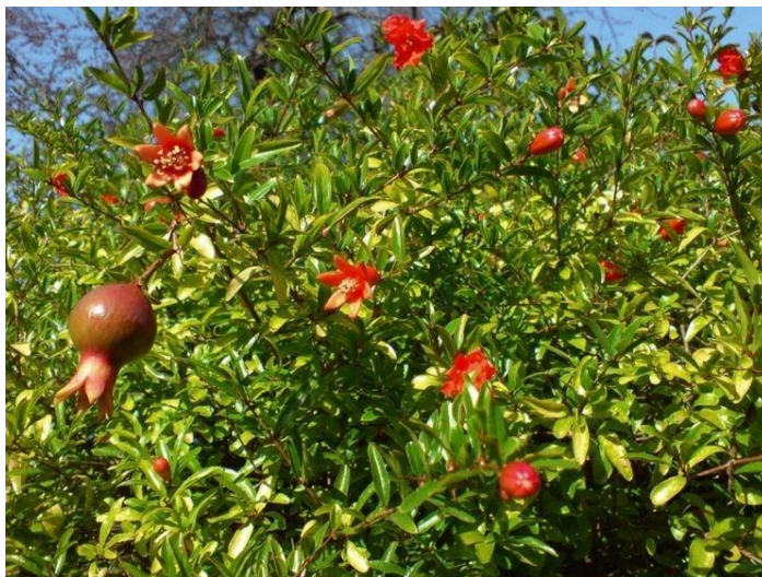
Figura 19: Melograno (Punica granatum L.)

Comunque si consiglia di piantumare varietà antiche in quanto risultano più resistenti alle intemperie, principalmente alle gelate primaverili.