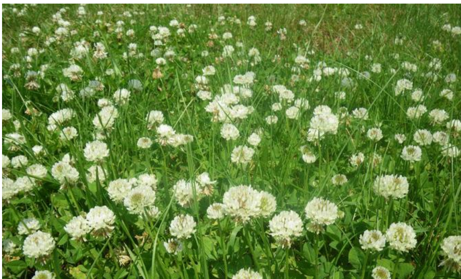
Figura 13: Trifoglio Alessandrino (Trifolium alexandrinum L.)