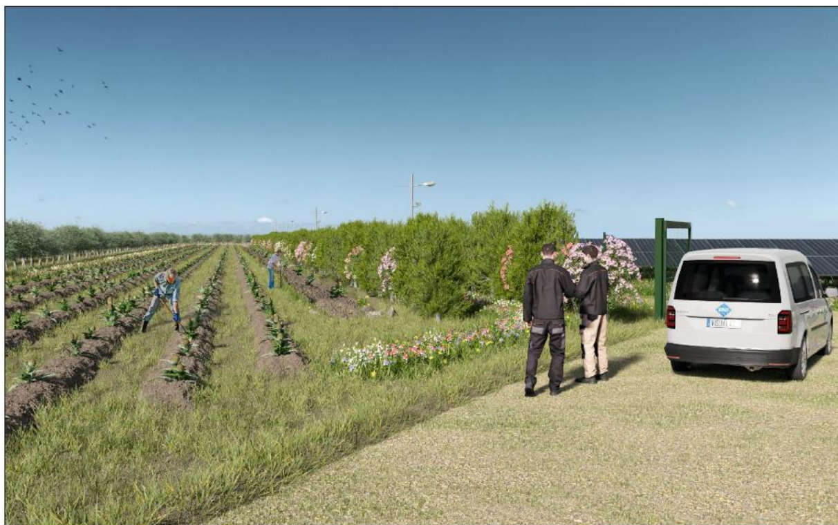
Figura 7: fotosimulazione (area impianto) – vista 1 - lato sud