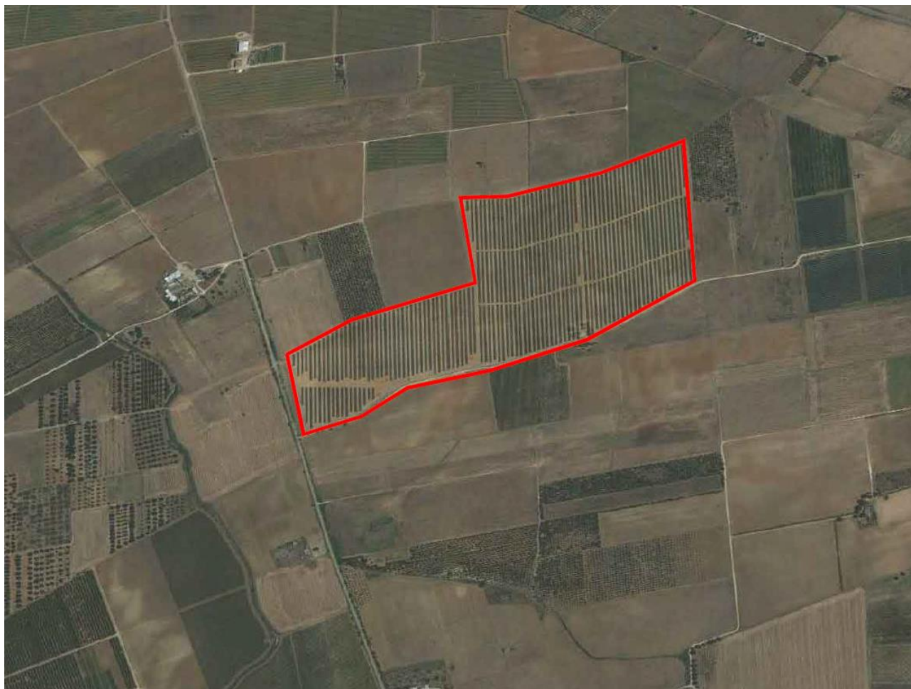
Figura 1: in rosso l'area d'intervento del progetto con la trama agricola del territorio

Gli elementi areali del paesaggio energetico sono rappresentati dalla presenza di suoli su cui sono presenti moduli fotovoltaici montati su strutture monoassiali ad inseguimento solare (est-ovest) tracker, che si uniscono alla texture agricola fortemente parcellizzata, integrandosi con essa al punto di diventarne parte integrante nella produzione.