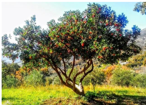
Figura 18: Corbezzolo (Arbutus unedo L.)