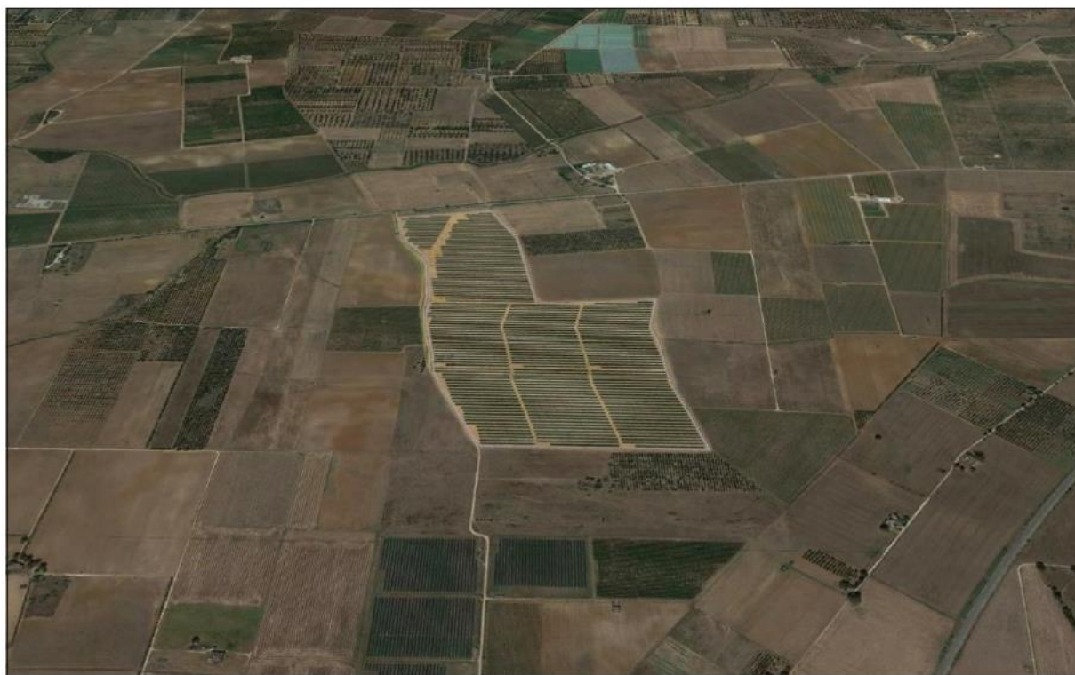
Figura 5: fotosimulazione a volo d'uccello – lato est