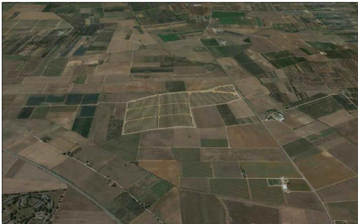
Figura 2: fotosimulazione a volo d'uccello – lato nord