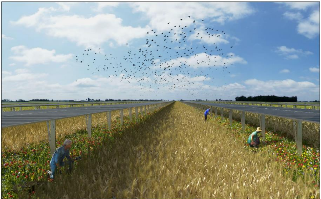
Figura 9: fotosimulazione (area impianto) – vista 3 - lato nord