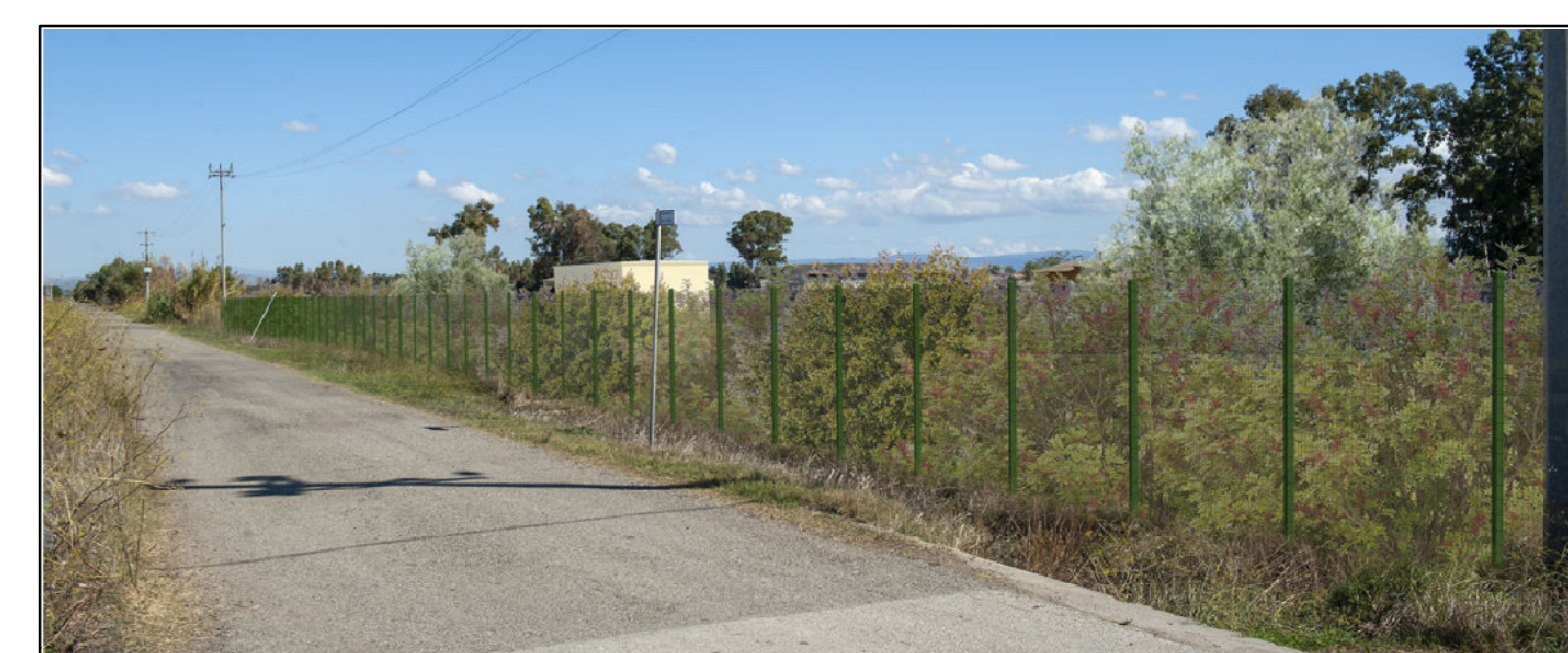
IMPIANTO AGROVOLTAICO VILLASOR COMUNE DI VILLASOR