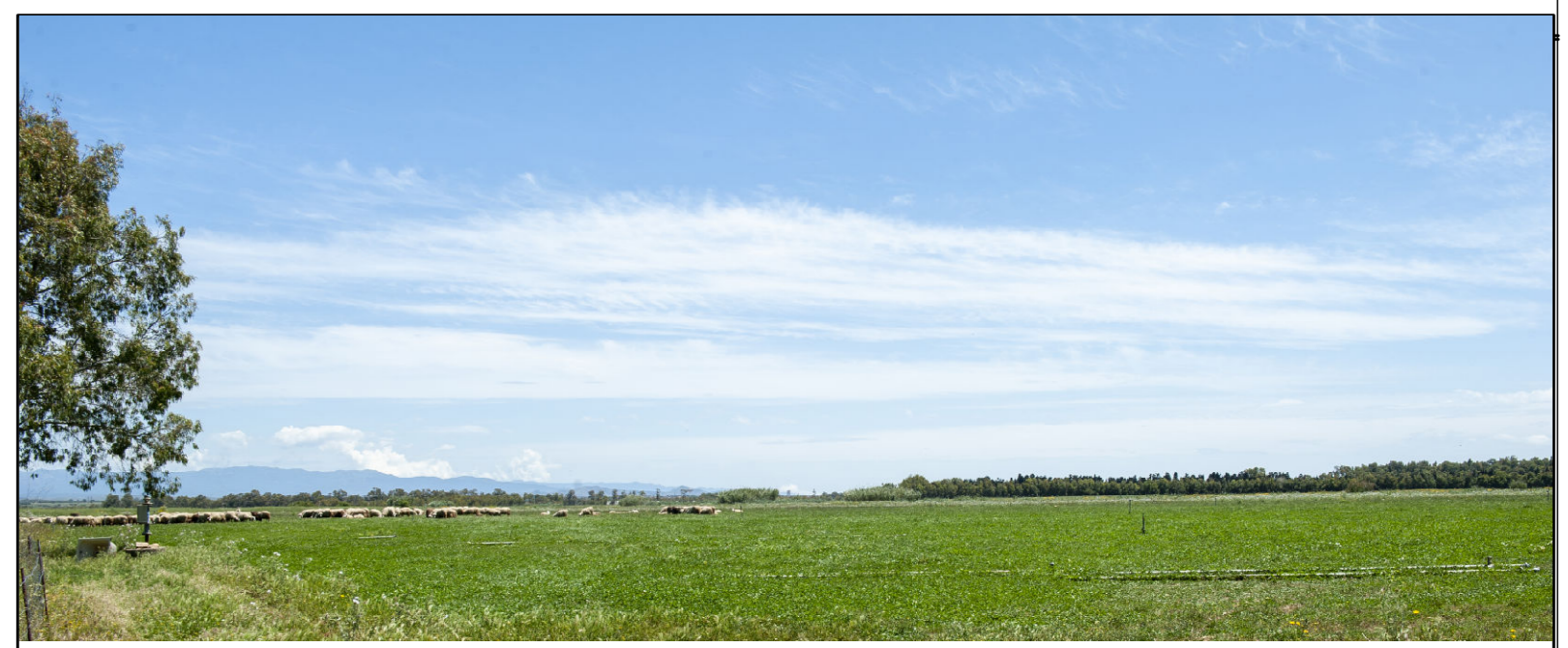
IMPIANTO AGROVOLTAICO SERRAMANNA 1 COMUNE DI SERRAMANNA