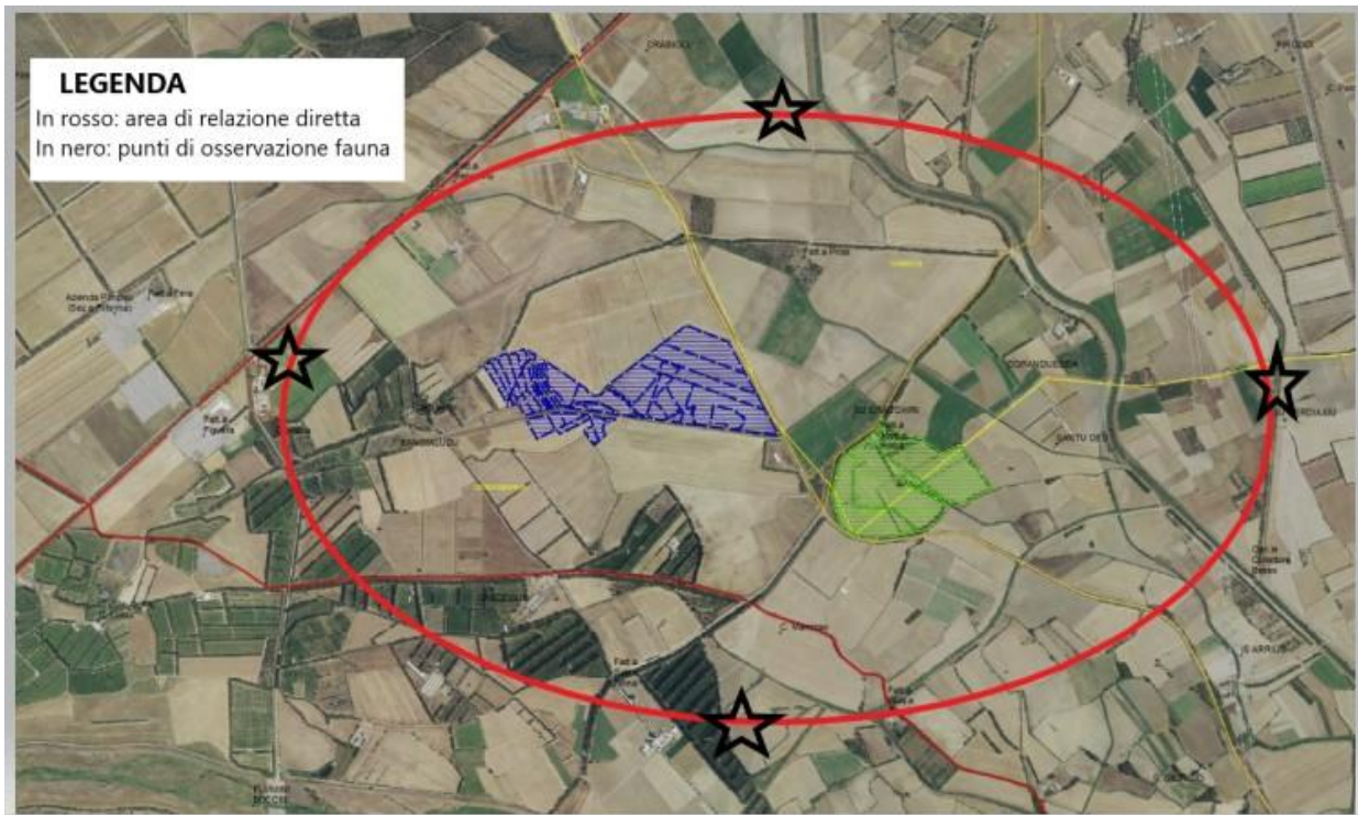
Figura n. 2: Area impianto e area di relazione diretta in nero i punti di osservazione e ascolto per la fauna selvatica