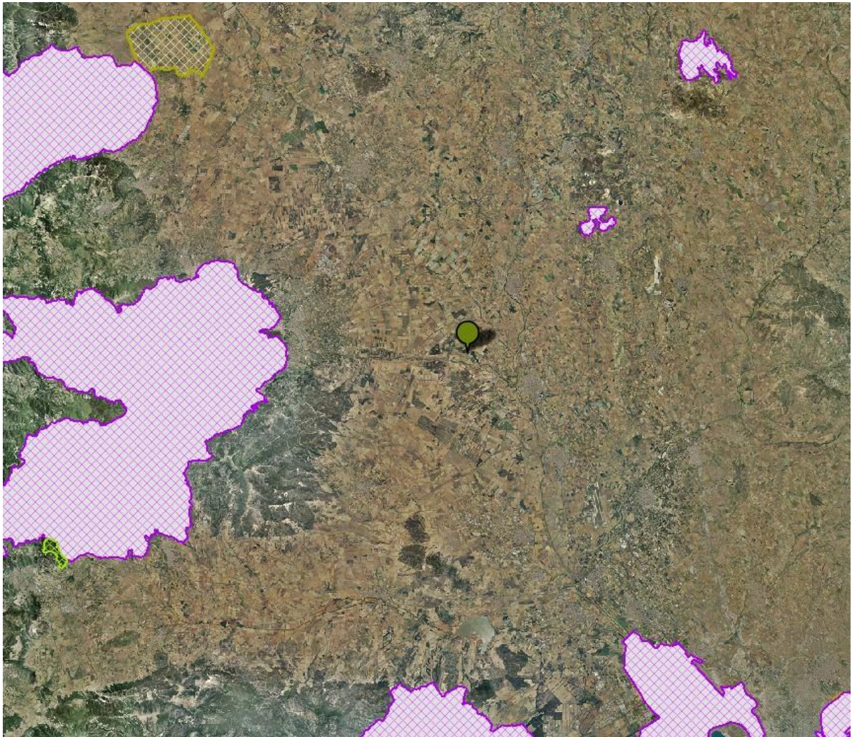
Figura n. 1: Area impianto e superfici afferenti alla Rete Natura 2000 ZPS- ZSC