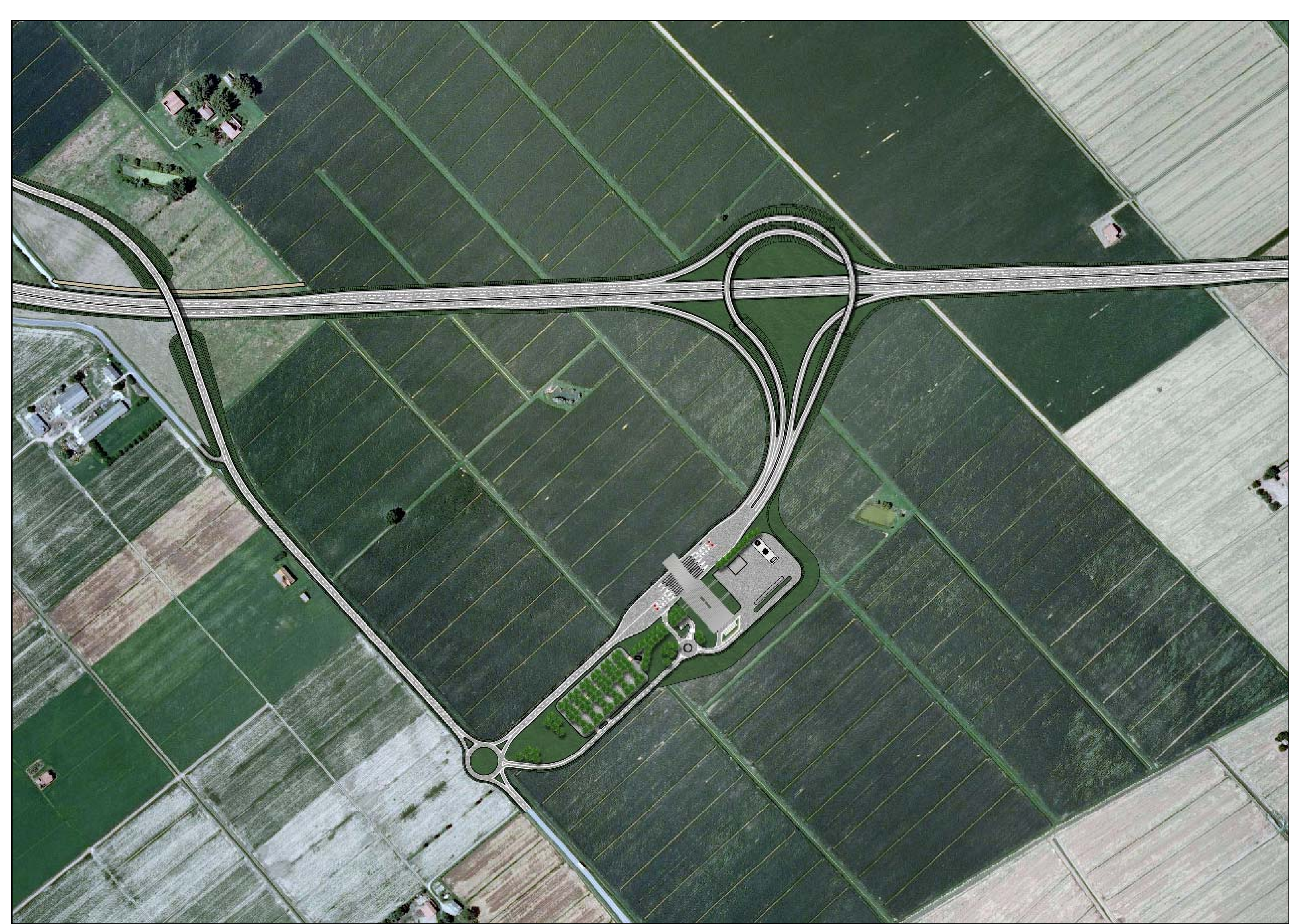
INQUADRAMENTO TERRITORIALE SCALA 1:2000