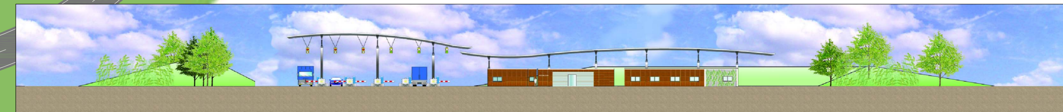
PROFILO FRONTALE SCALA 1:500