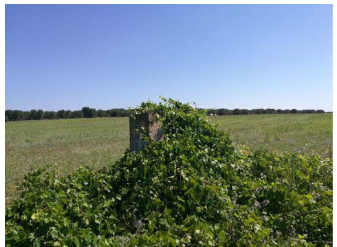
(Pozzo n. 2)