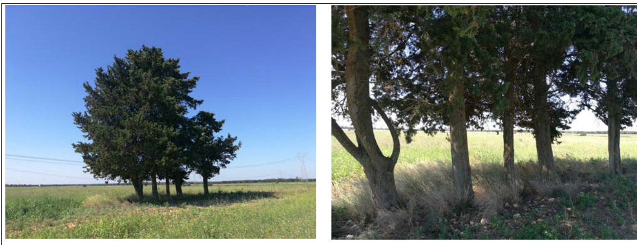
(Alberi di Pino – Campo A)

Sono stati individuati n. 5 alberi di Pino di diversa altezza sul confine delle pc.Ile 124 e 68, all’ingresso del campo A, posti a circa 50,00 m dal confine con la strada vicinale e circa 100,00 m dalla SP 46;