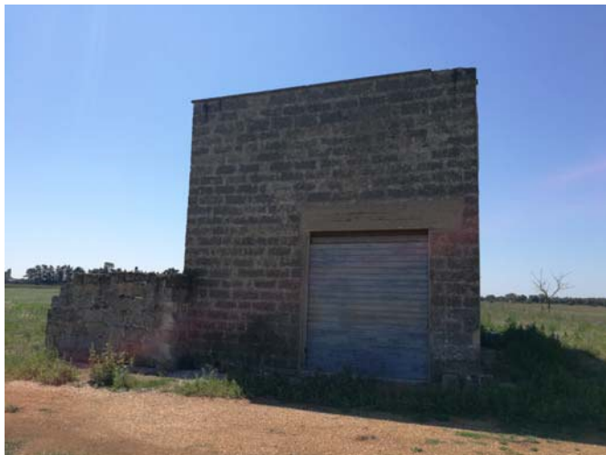
(Campo C– vista frontale fabbricato)

Raggiungibile proseguendo il percorso lungo lo stradone citato nel punto precedente. Caratterizzato dalla presenza di n. 2 alberi di frutto ad-ovest, distanti circa 30 m l'uno dall'altro, e da un gruppo di n. 8 alberi ad est, a confine con la strada interpodereale che collega il fabbricato rurale con l'ingresso della Masseria Tarantino .