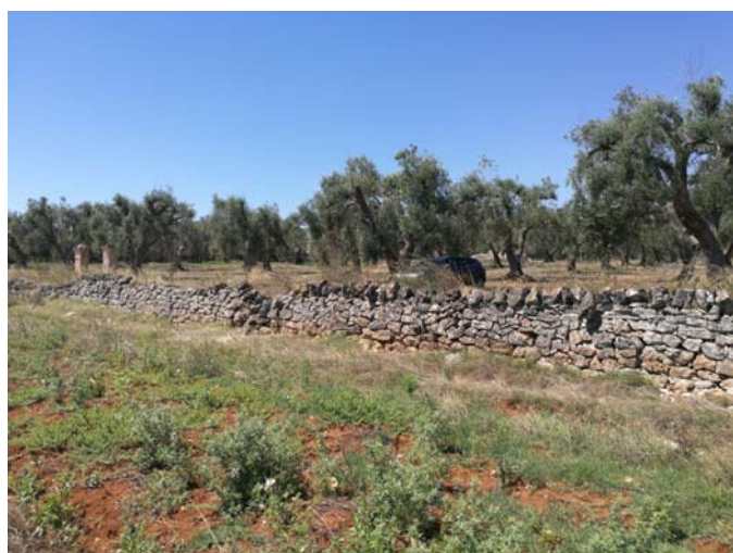
(Campo C– muro a secco lato ovest)

Percorrendo il campo C verso sud è stato rilevato il muretto a secco presente sul confine ad ovest, per circa 400 m, a confine con strada interpoderale, ponendo particolare attenzione sulla zona all'estremità dell'area, la quale è contrassegnata dalla presenza di una cisterna sottoposta rispetto al piano di campagna. Il manufatto presenta una lieve sporgenza sulla parte centrale composta da una copertura a volta a botte, con apposita apertura di circa m 0,50 x 0,50.