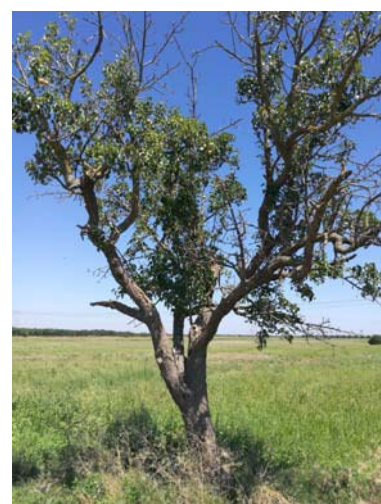
(Campo C– alberi a confine del fabbricato)