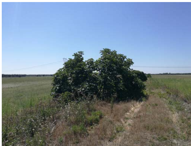
(Albero di fico)