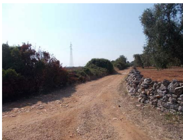
(Strada – Campo E)