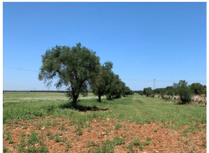
(Campo B – buffer S.P. 46)