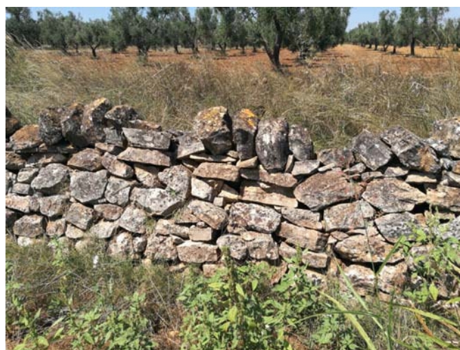
(Campo C– muro a secco lato ovest)