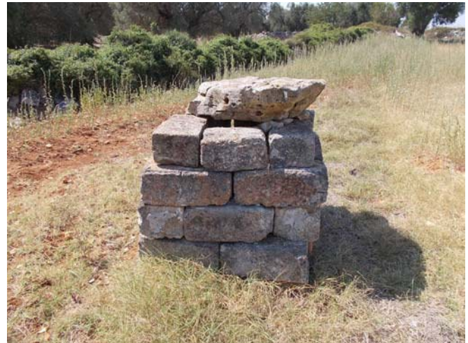
(pozzo n. 4 – Campo D)