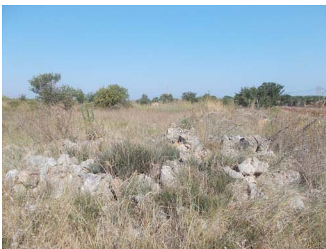
(Macchia mediterranea - campo E)

L'ultima parte interessata del sopralluogo effettuato in data 28/08/2019, è stata l'area Nord che costituisce il Campo E , separato dall'area Ovest da strada comunale non asfaltata. Procedendo lungo il perimetro della zona, in senso anti-orario, sono stati rilevati gli elementi più importanti del comprensorio, partendo da una piccola zona investita a macchia mediterranea, con vegetazione spontanea e cespugli di diverso genere, proseguendo verso nord, dove sono stati rilevati n. alberi di ulivo aventi età diversa, a confine con muretto a secco che divide l'area lungo l'asse Est-Ovest.