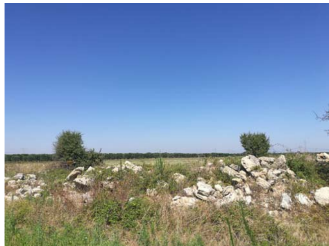
(Muretto a secco – Campo A)

Lungo la perimetrazione del Campo A, ad est, quasi a confine con il campo B, è presente un'area caratterizzata da macchia mediterranea, di circa mq 4.500,00 e circa m 400,00 di perimetro, di forma irregolare, con la presenza di diversi arbusti e sottoposta a vincolo paesaggistico. Di seguito si riportano n. 2 foto.