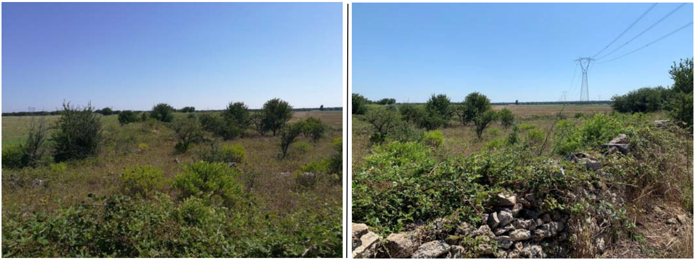
(Area sottoposta a vincolo – Campo A)

Nella zona centrale del Campo A, a confine con il Campo B, è stato rilevato il traliccio della Linea AT e la presenza di un pozzo di vecchia data, a confine tra le p.lle 124 e 68 del foglio 13, realizzato in pietra con n. 2 colonne ai lati e ricoperto di erbe infestanti, utilizzato in passato per scopi agricoli.