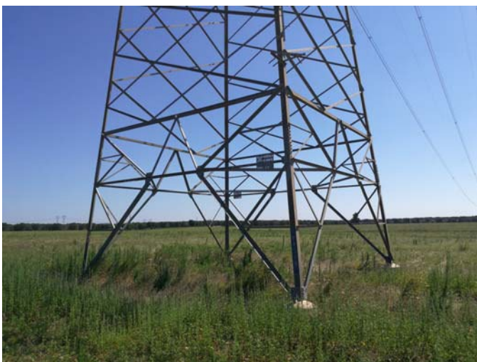
(Traliccio Linea AT)

Nella zona centrale del Campo A, a confine con il Campo B, è stato rilevato il traliccio della Linea AT e la presenza di un pozzo di vecchia data, a confine tra le p.lle 124 e 68 del foglio 13, realizzato in pietra con n. 2 colonne ai lati e ricoperto di erbe infestanti, utilizzato in passato per scopi agricoli.