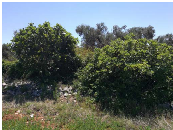
(Lato sud campo C – muretto)

inoltre un ammasso di blocchi di pietra, derivanti dal crollo di un piccolo trullo, distante dal confine circa m 50 m.