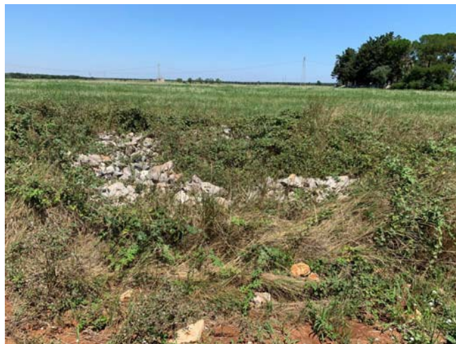
(Trullo crollato - campo C)

L'intera area a sud-est del campo C è interamente occupata dalla Masseria Tarantino , delimitata da muretti a secco di diversa altezza, con 2 accessi dalla S.P. 46 con viale lungo circa 50 m, quello principale composto da un vecchio cancello in ferro e alberi di Pino e quello secondario più a nord, con cancello in ferro e alberi di Eucalipto.