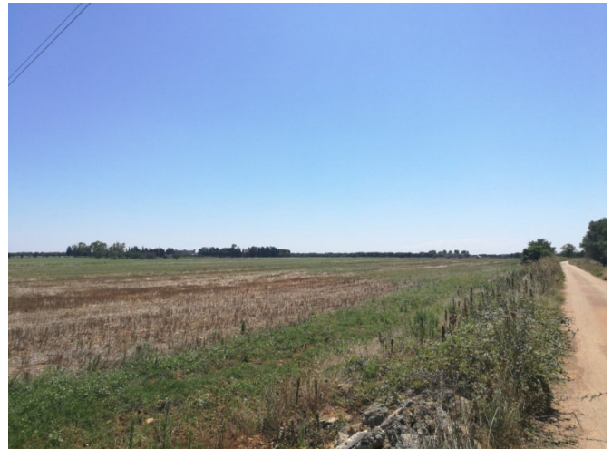
(Campo B – lato ovest)