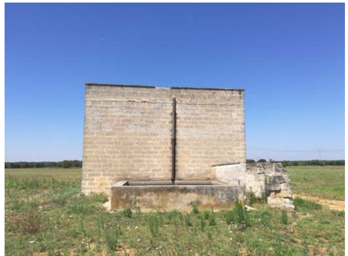
(Campo C– vista laterale fabbricato)