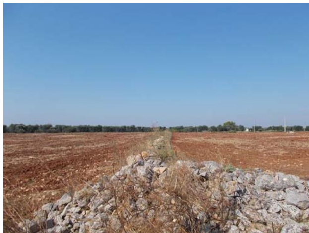
(muretto a secco - campo E)

A nord est del Campo C è presente una masseria, denominata “ Masseria Asciulo ”, delimitata da recinzione in muratura.