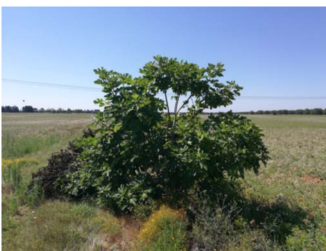
(Albero di fico)