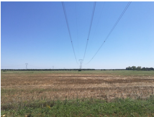
(Campo B – Linea AT)