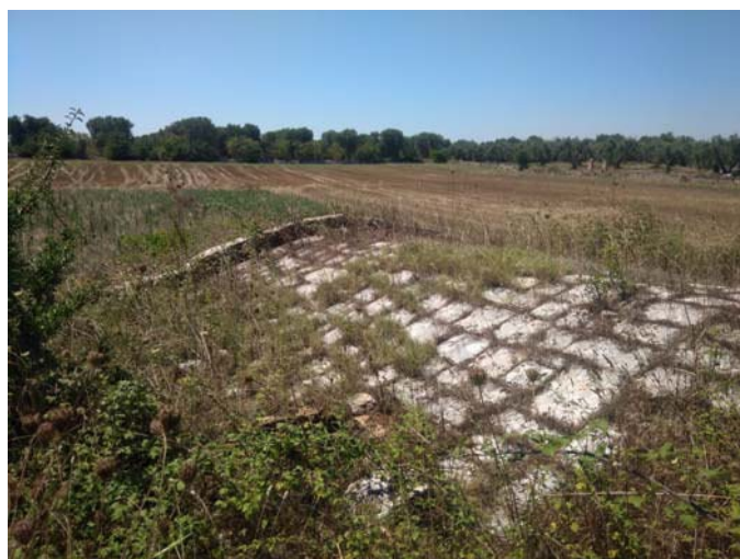
(Campo C – cisterna)