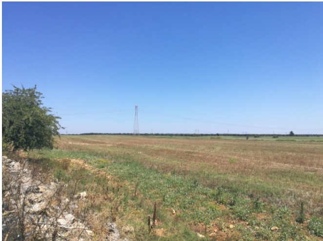
(Campo B – lato ovest)

Lungo il perimetro del campo B, ad ovest, si rileva la presenza costante di un muretto a secco ricoperto di erbe infestanti e talvolta da arbusti di altezza medio-bassa di diversa specie. Mentre lungo il confine ad est e pertanto a confine con la S.P. 46, esattamente nella fascia di rispetto, è presente un filare di n. 9 alberi di ulivo distante circa 10 m dal muretto a secco.