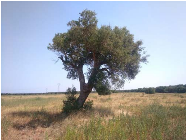
(Albero di ulivo – Campo D)