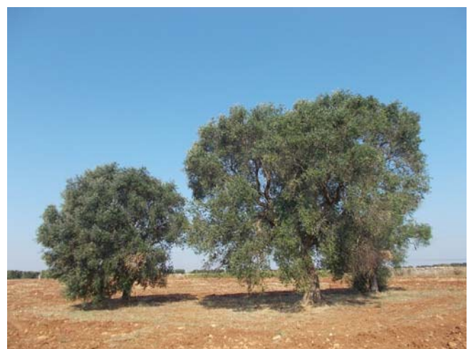
(alberi di ulivo - campo E)