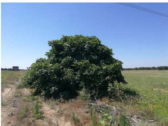
(Albero di fico)