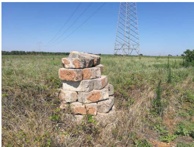
(Pozzo n. 3)

Percorrendo il predetto viale interno sterrato sono stati rilevati n. 4 alberi di Fico , per arrivare poi al pozzo n. 3, posto sempre sulla p.lla 68 del fg. 13 di Latiano, composto da una vecchia griglia in ferro posizionata al di sopra della bocca e realizzato anch'esso in conci di tufo.