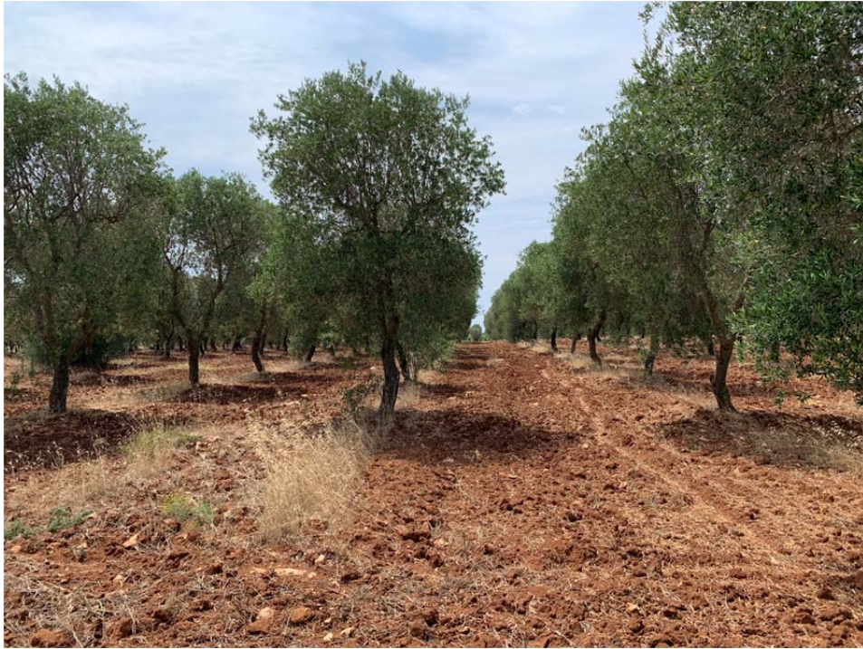
Cellina di Nardò