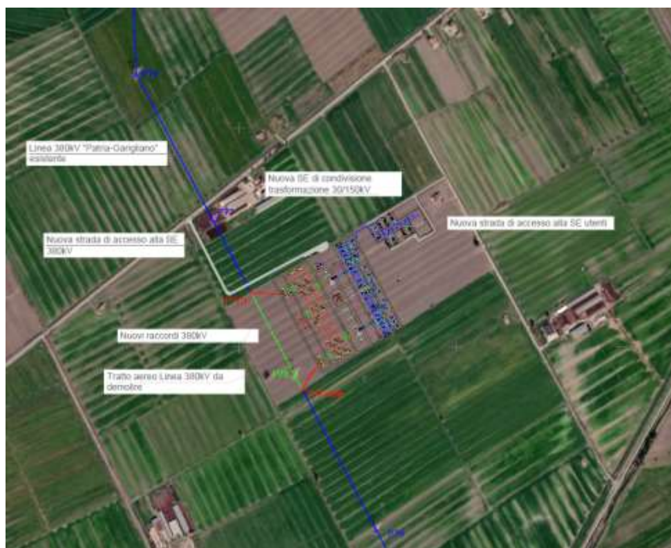
Figura 10Ortofoto della nuova SE RTN 380/150 kV (a sinistra) e SE di condivisione/trasformazione 30/150 kV

Inoltre, è prevista la realizzazione di una nuova stazione utenza 30/150kV e cavidotto interrato a 150 kV per il collegamento della suddetta stazione alla sezione 150 kV della nuova stazione di trasformazione 380/150 kV.