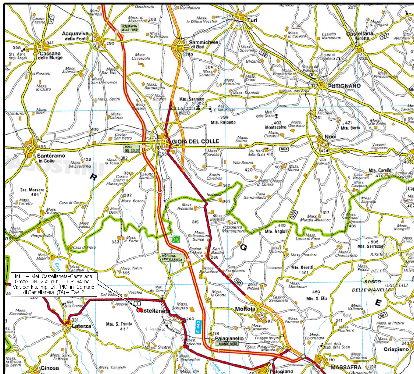
COROGRAFIA Scala 1:250.000

Il presente disegno è di proprietà aziendale - La Società tutelera i propri diritti a termine di legge.