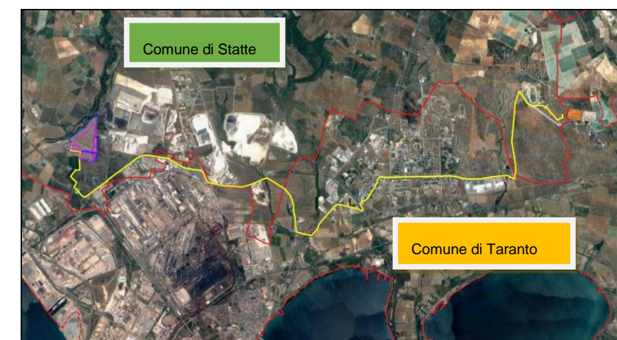
Figura 2-1: Inquadramento territoriale su Ortofoto del complesso del percorso del cavidotto di connessione MT (in giallo)

Le opere in progetto interessano i territori dei Comune di Statte e Taranto (TA) : l'impianto fotovoltaico e l'impianto di produzione di idrogeno interessano il territorio comunale di Statte, mentre le opere di connessione interesseranno in comune di Taranto. Il cavidotto di connessione MT avrà una lunghezza complessiva di circa 17,6 km, interesserà sia il territorio comunale di Statte che di Taranto, della Città Metropolitana di Taranto. Sarà realizzato in cavo interrato con tensione nominale di 30 kV, e collegherà l'impianto fotovoltaico con la stazione di utenza in prossimità della stazione di rete Terna 380/220/150kV denominata "Taranto N2".