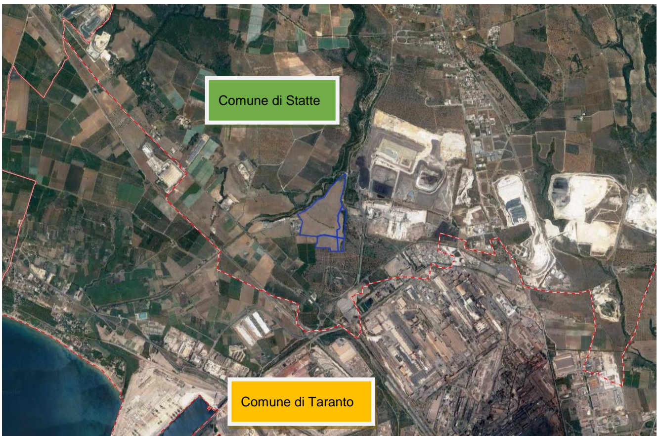
Figura 4-1: Inquadramento territoriale su Ortofoto delle particelle interessate dall' impianto fotovoltaico e dall'impianto di produzione di idrogeno (perimetro blu)

Infatti mentre l'impianto fotovoltaico e l'impianto di produzione di idrogeno interessano il territorio comunale di Statte, il Preventivo di connessione Cod. Pratica 202101339 rilasciato da TERNA SpA a favore del Proponente prevede che l'impianto sia collegato in antenna 150 kV su un futuro ampliamento della Stazione Elettrica (SE) a 380/150 kV della RTN denominata "Taranto N2", previa razionalizzazione delle linee RTN in ingresso alla SE.