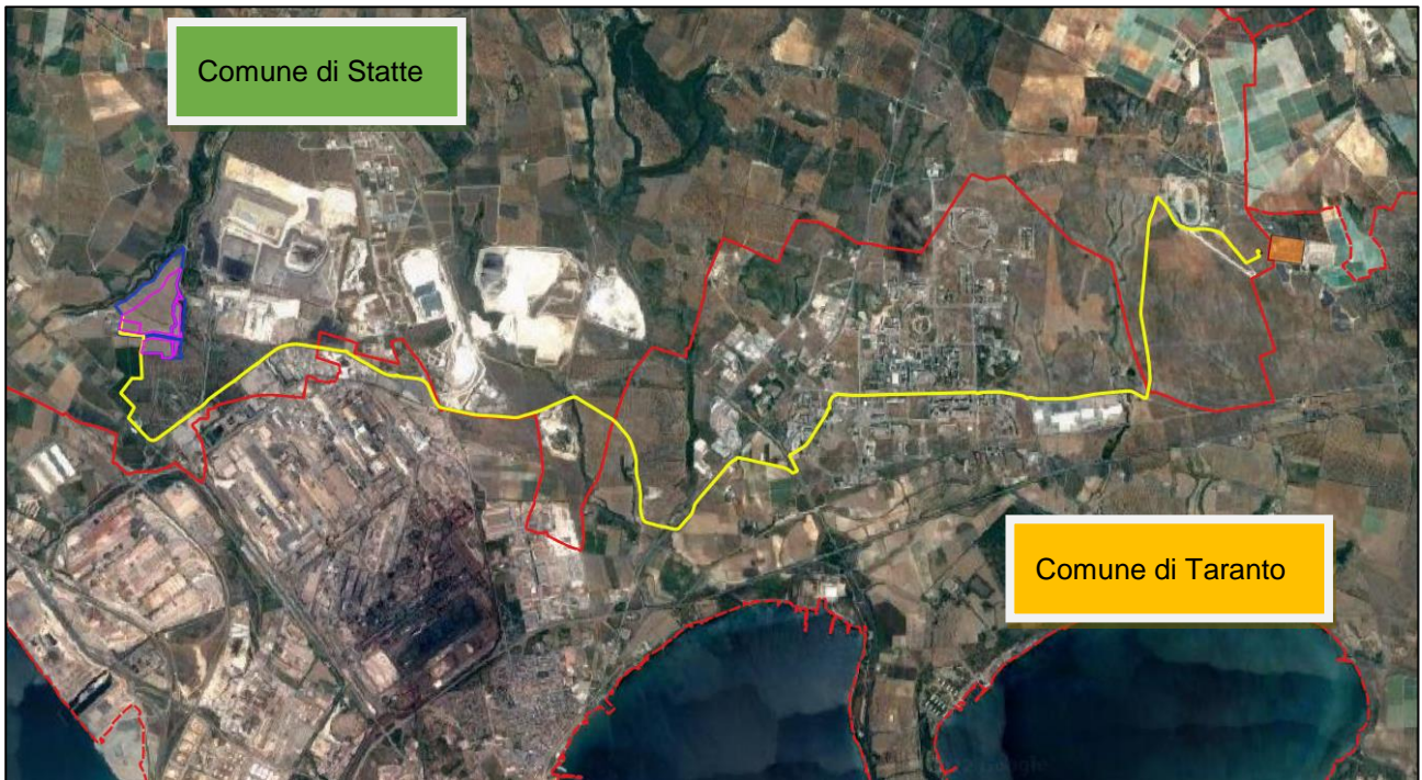
Figura 4-3: Inquadramento territoriale su Ortofoto del complesso del percorso del cavidotto di connessione MT (in giallo)

con tensione nominale di 30 kV, che collegherà l'impianto fotovoltaico con la stazione di utenza in prossimità della stazione di rete Terna 380/220/150kV denominata "Taranto N2".