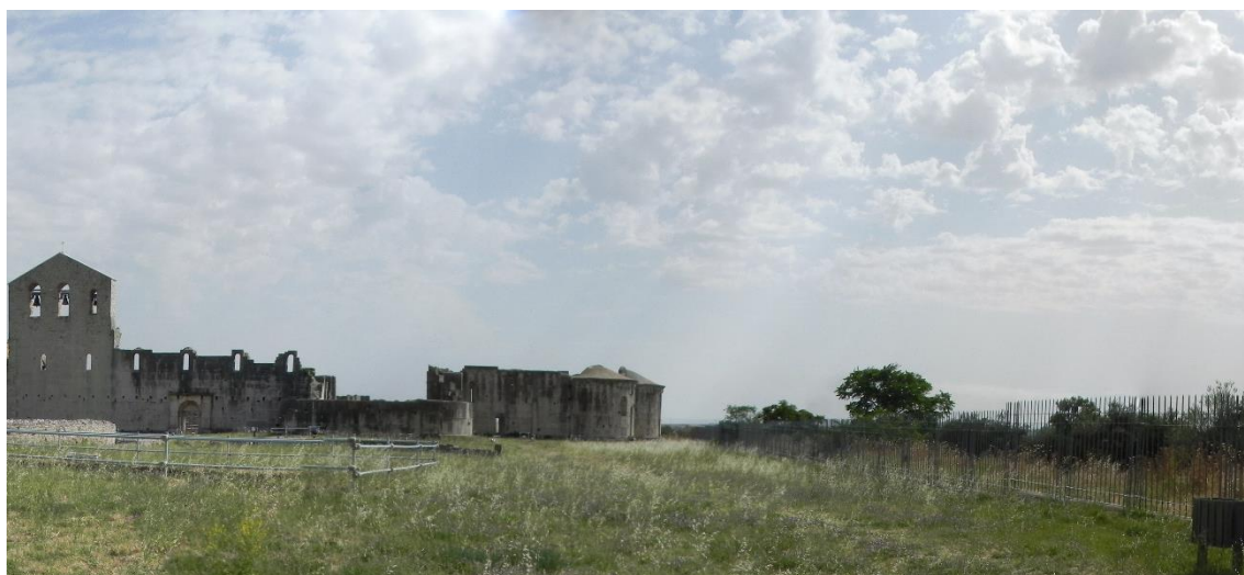
Figura 3: Vista dall'area archeologica della Trinità (luglio 2019)