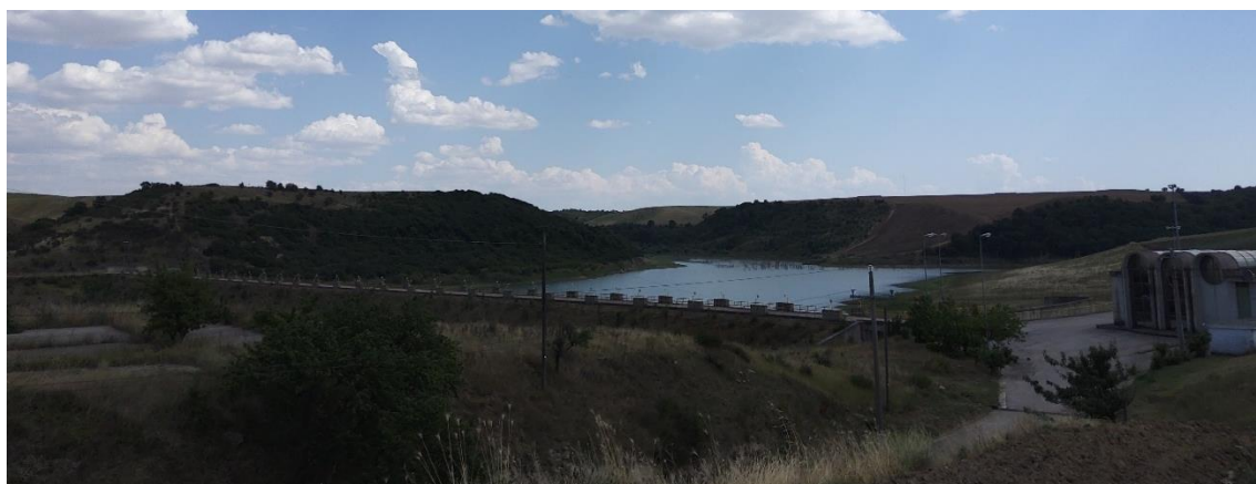
Figura 8: Area limitrofa all'invaso Toppo di Francia

Fermo restando quanto sopra evidenziato, al fine di evidenziare la compatibilità del progetto con le esigenze di tutela del contesto paesaggistico, si prevede di realizzare ulteriori fotoinserimenti, nell'ambito delle richieste di integrazioni che l'Autorità competente intenderà recepire all'interno del procedimento finalizzato alla Valutazione di Impatto Ambientale.