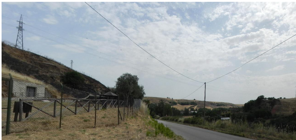
Figura 2 – Vista dall'ingresso delle Catacombe Ebraiche (luglio 2021)