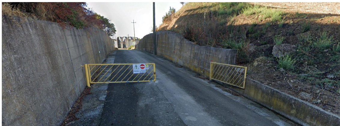
Figura 7: Accesso all'Invaso Toppo di Francia