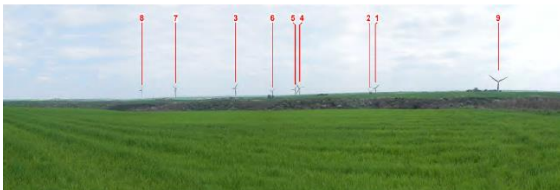
Figura 5: Area prossima alla Masseria bosco delle Rose (Fotoinserimento H)