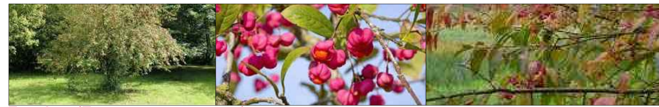
Evonimo ( Euonymus europaeus )