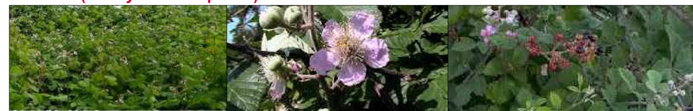
Rovo ( Rubus ulmifolius )