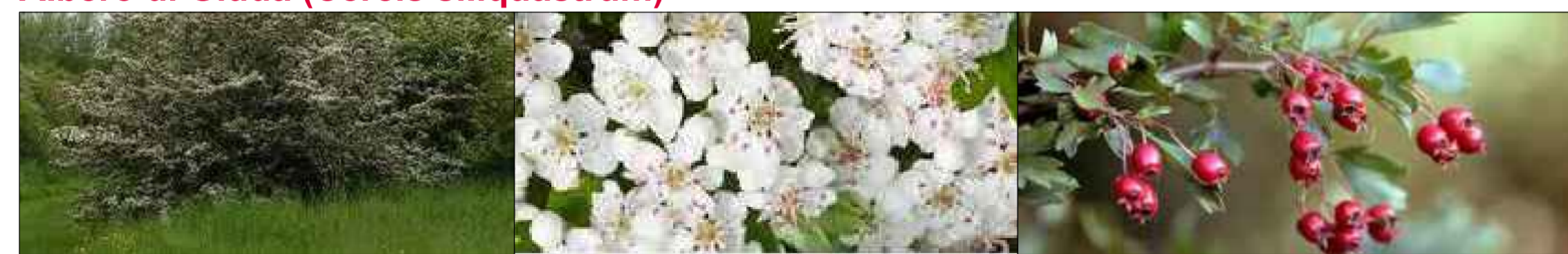
Biancospino ( Crataegus monogyna )