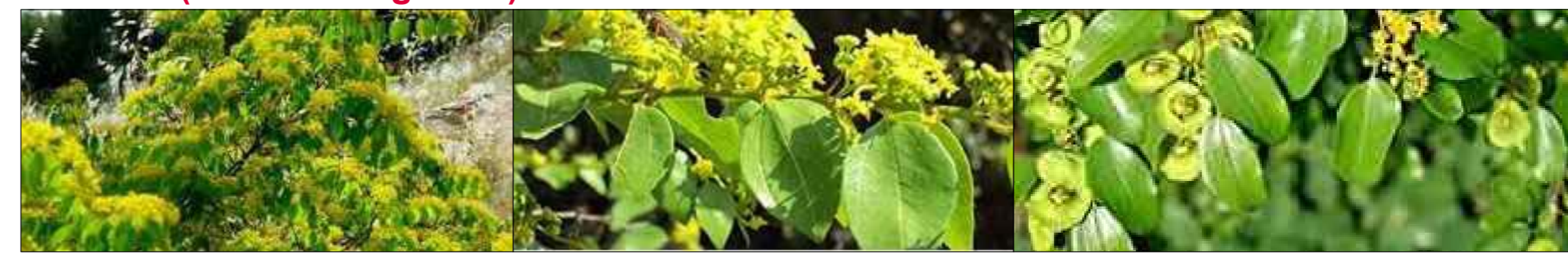
Marruca ( Poliurus spina-christi )