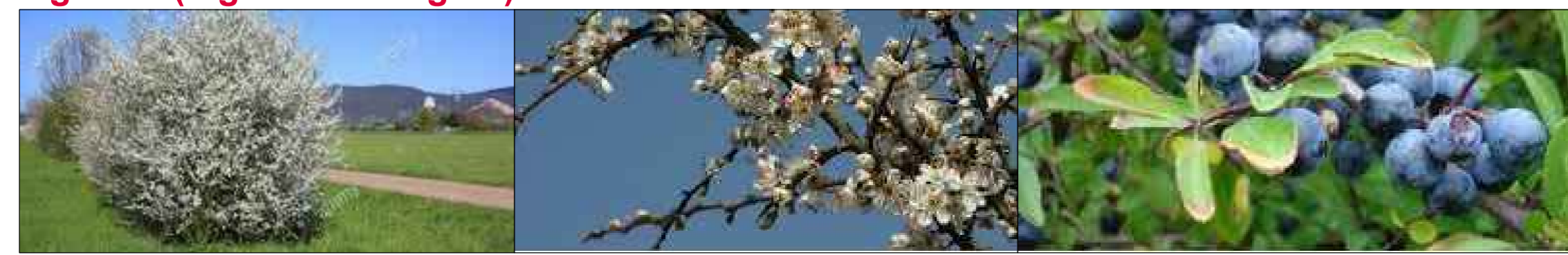
Prugnolo ( Prunus spinosa )