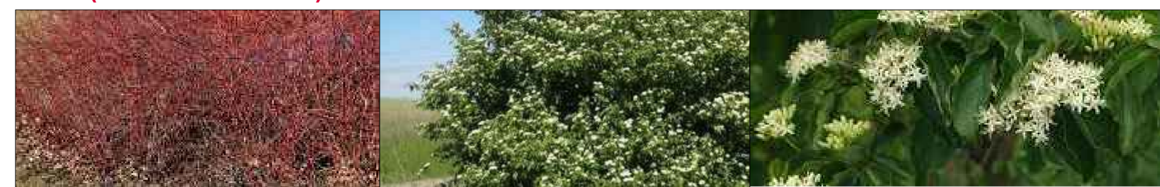
Corniolo ( Cornus sanguinea )