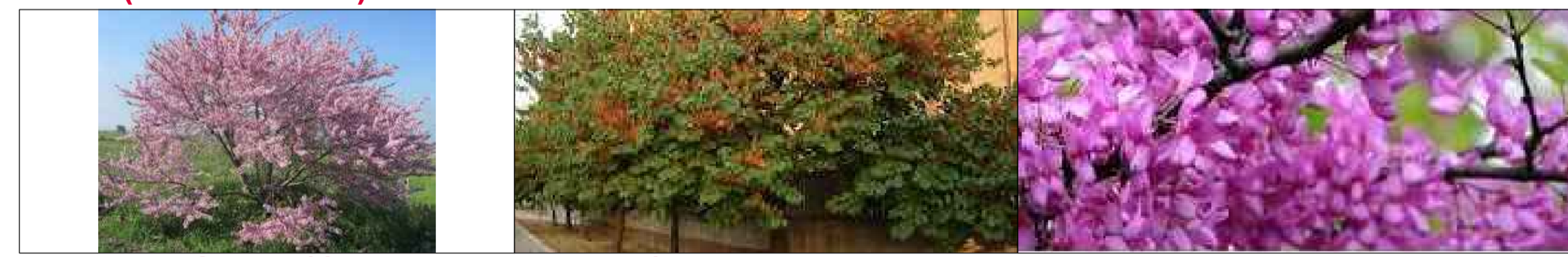
Albero di Giuda ( Cercis siliquastrum )