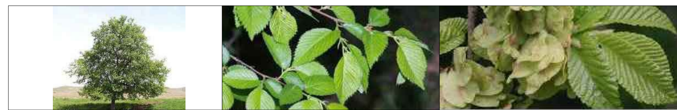
Olmo ( Ulmus minor )