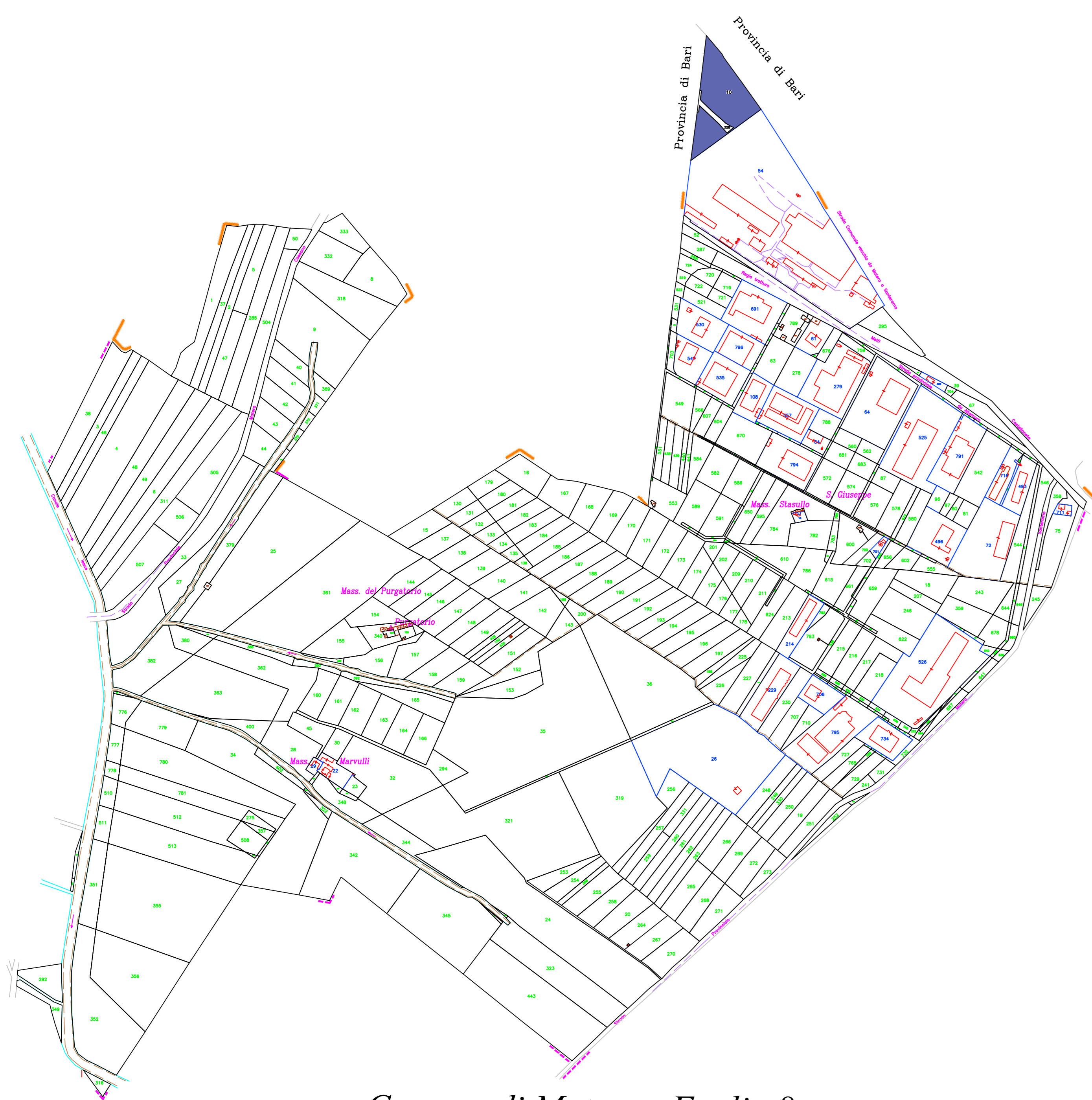
Comune di Matera - Foglio 8