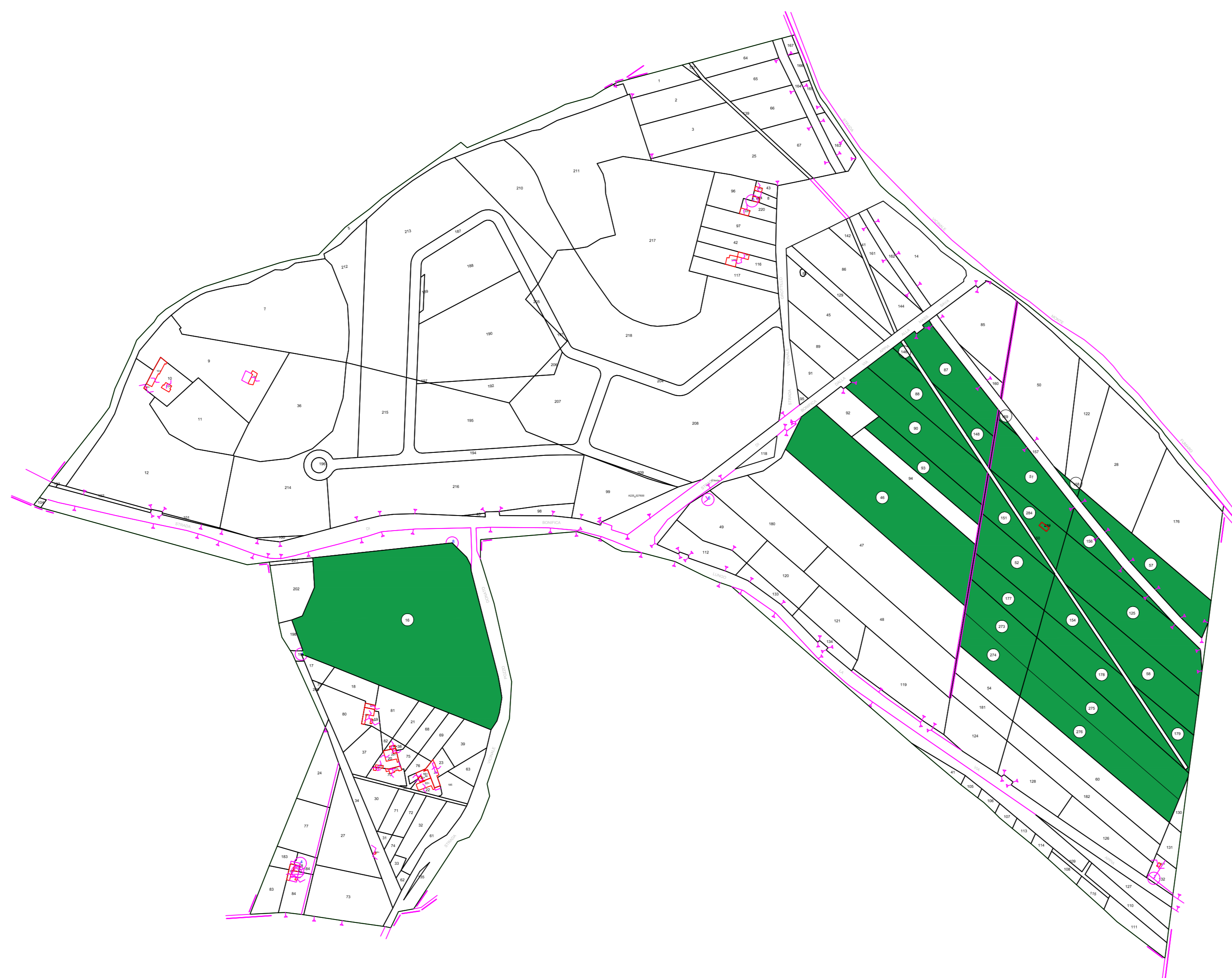
Comune di Altamura - Foglio 276