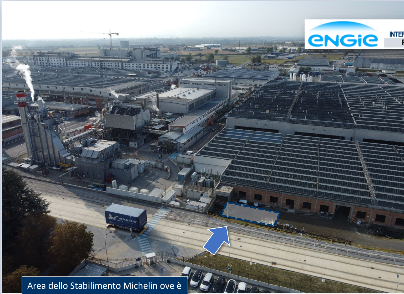
Area dello Stabilimento Michelin ove è prevista l'installazione dei serbatoi interrati di stoccaggio del gasolio