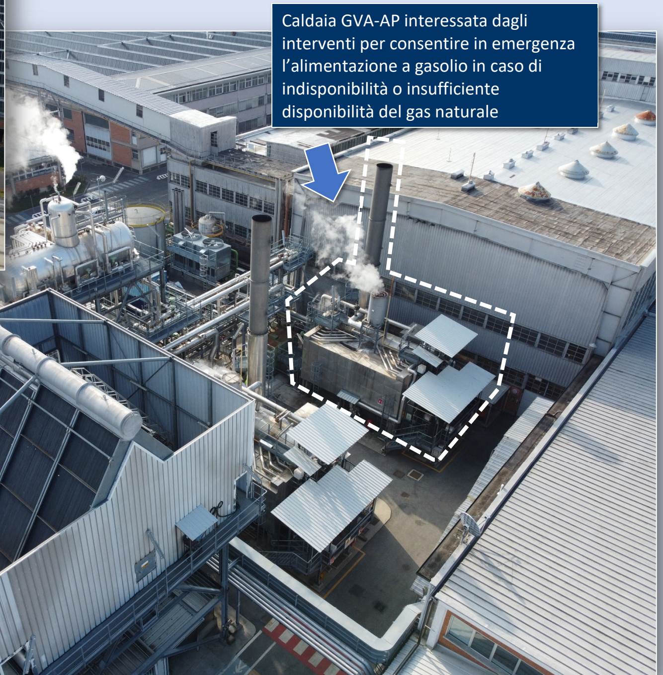
Caldia GVA-AP interessata dagli interventi per consentire in emergenza l'alimentazione a gasolio in caso di indisponibilità o insufficiente disponibilità del gas naturale