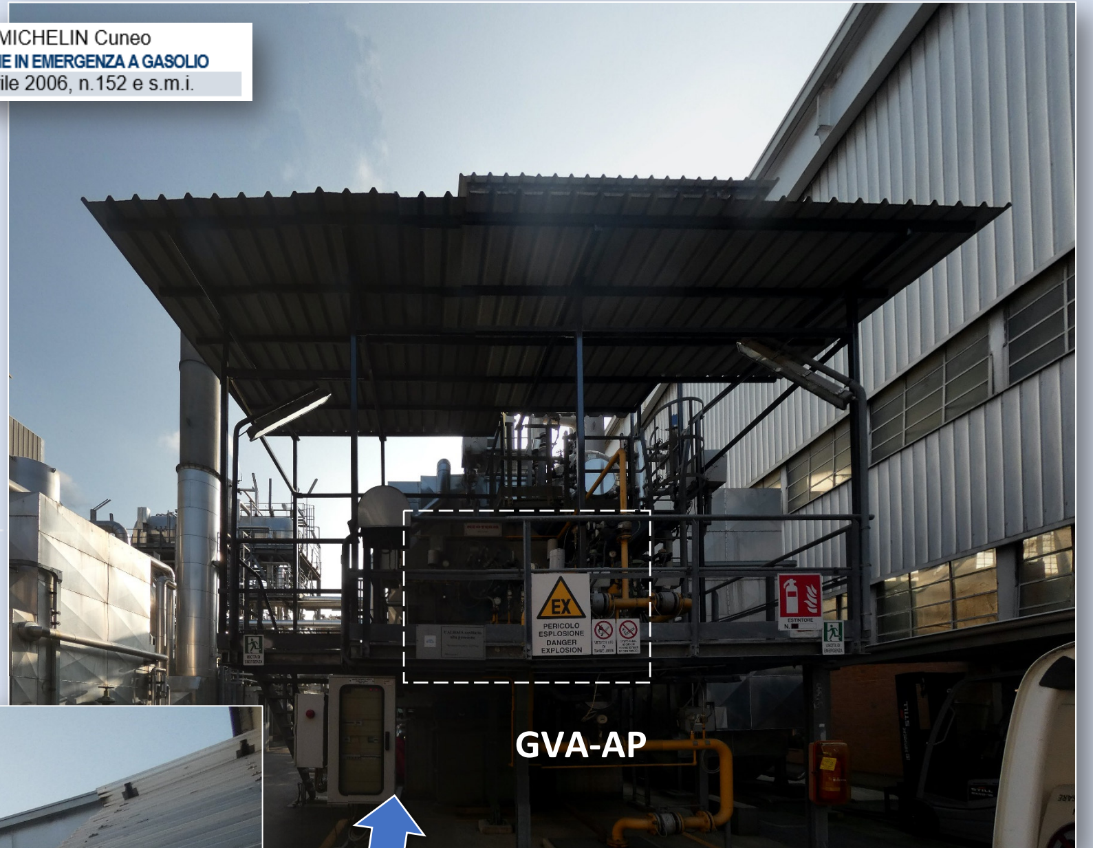
Caldaia GVA – posizione del sistema di ricircolo fumi