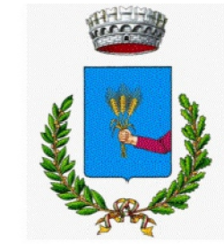
Comune di Craco