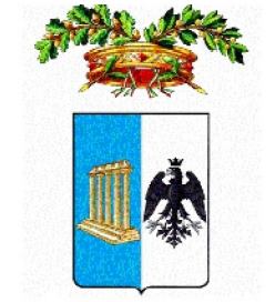
Provincia di Matera

PROGETTO PER LA REALIZZAZIONE DI UN PARCO FOTOVOLTAICO PER LA PRODUZIONE DI ENERGIA ELETTRICA, DELLE OPERE CONNESSE E DELLE INFRASTRUTTURE INDISPENSABILI Località S.Eligio - Comune di Craco (MT)