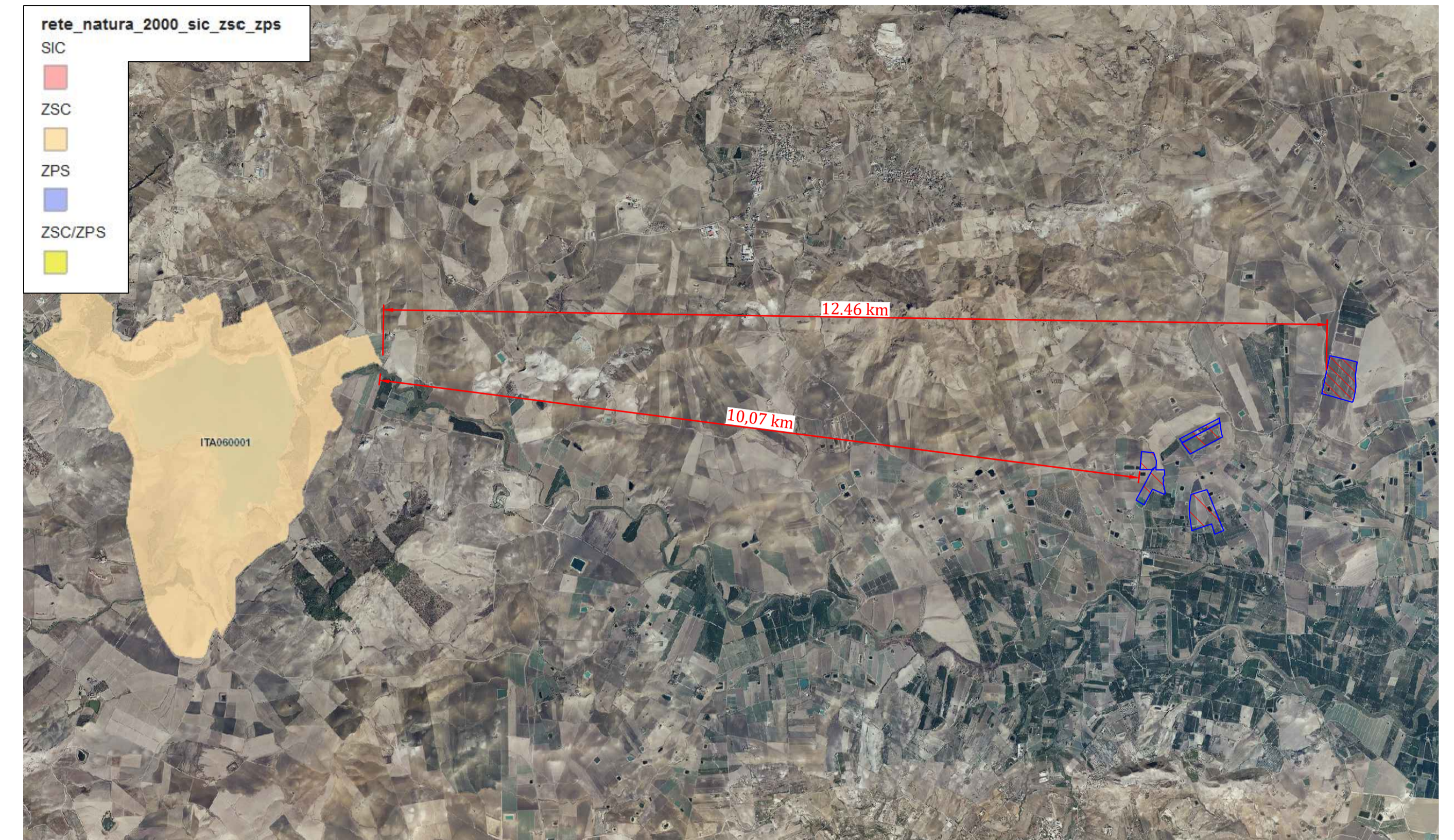
AREE SIC E ZPS SCALA 1:50.000