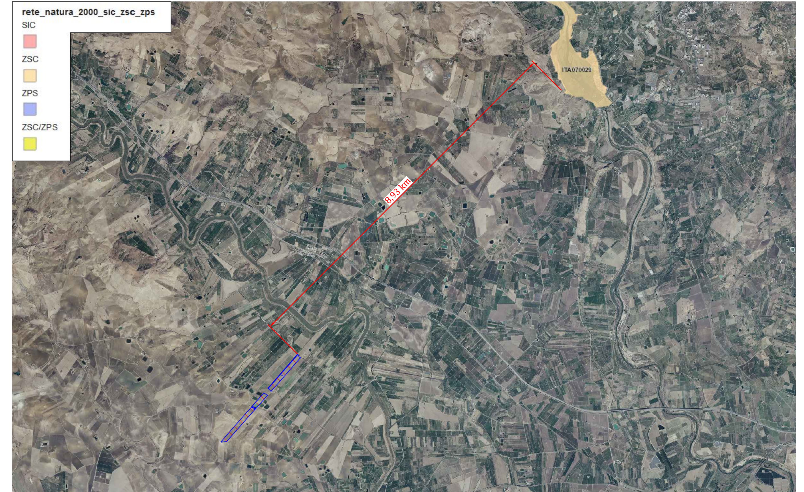
AREE SIC E ZPS SCALA 1:50.000