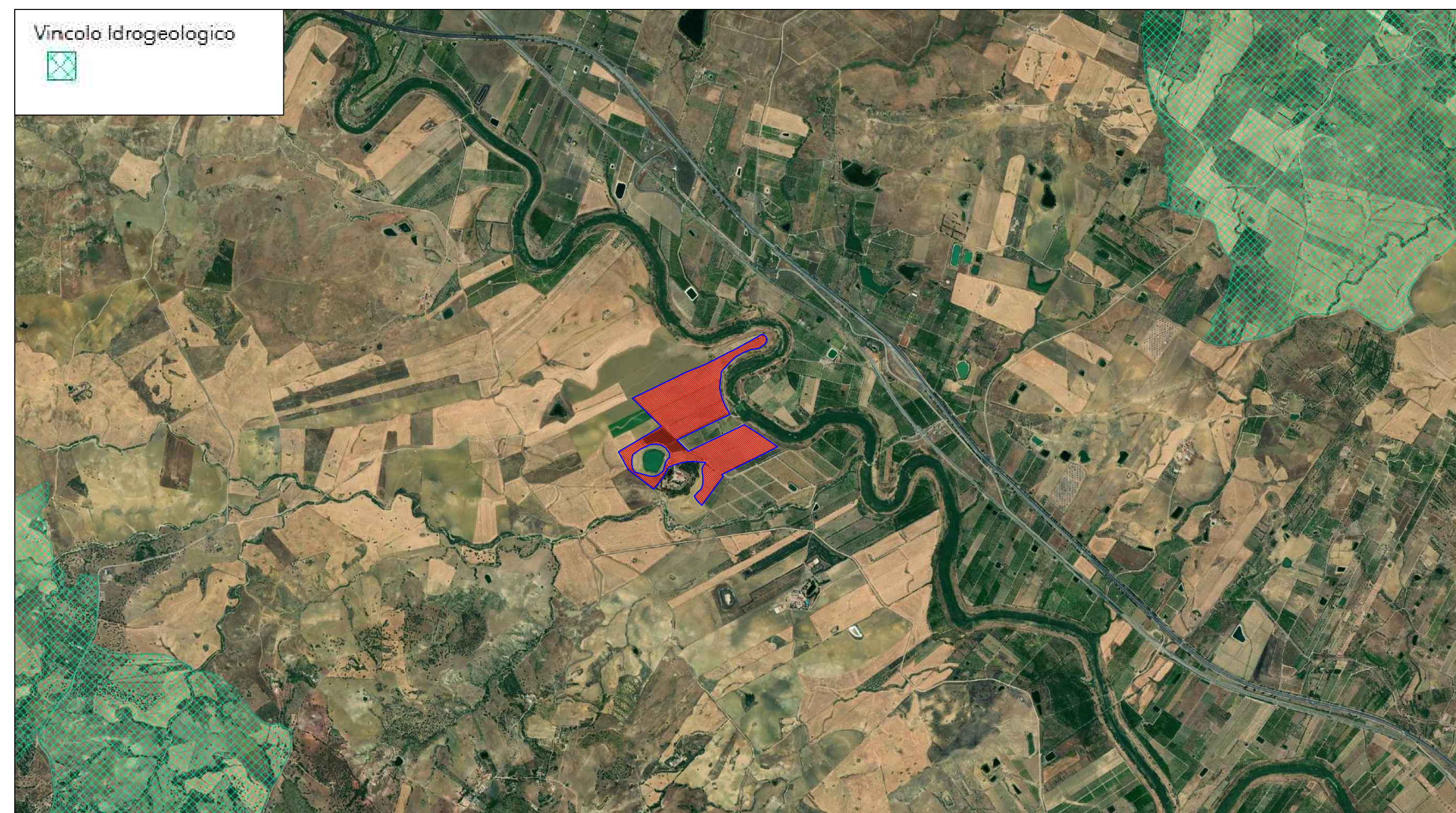
STRALCIO MAPPA VINCOLO IDROGEOLOGICO SCALA 1:25.000