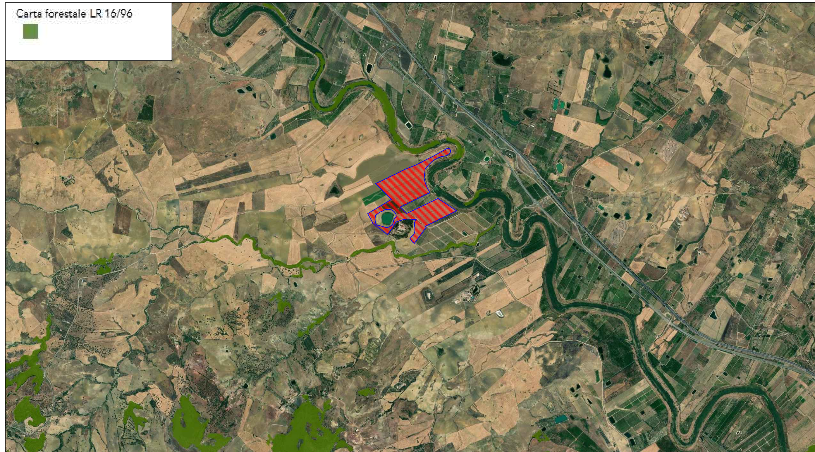
STRALCIO CARTA FORESTALE L.R. 16/96 SCALA 1:25.000