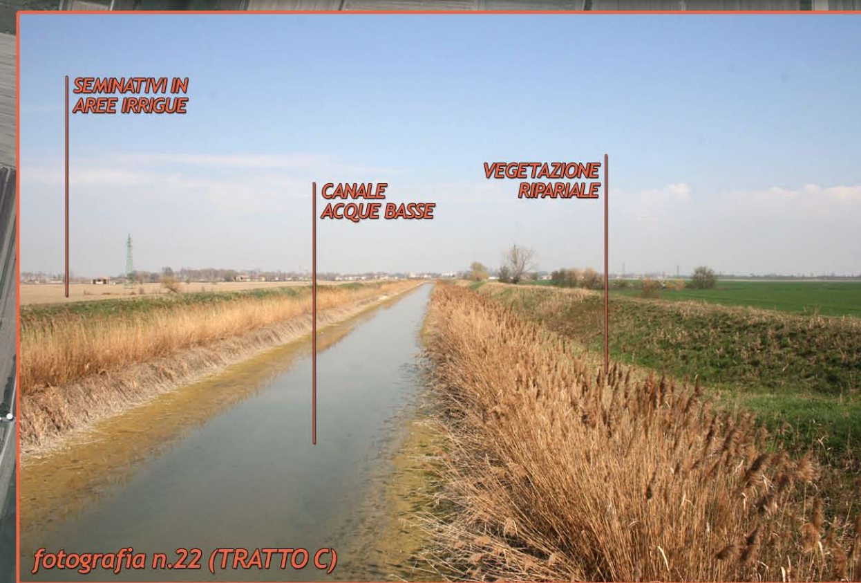
fotografia n.22 (TRATTO C)