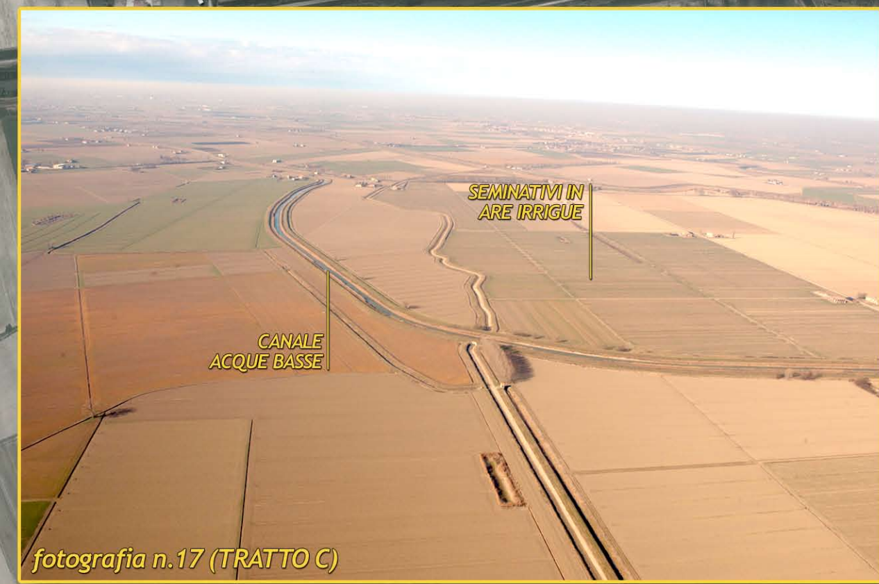
fotografia n.17 (TRATTO C)