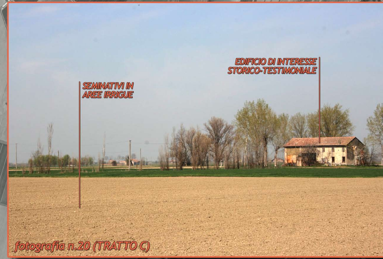
fotografia n.20 (TRATTO C)