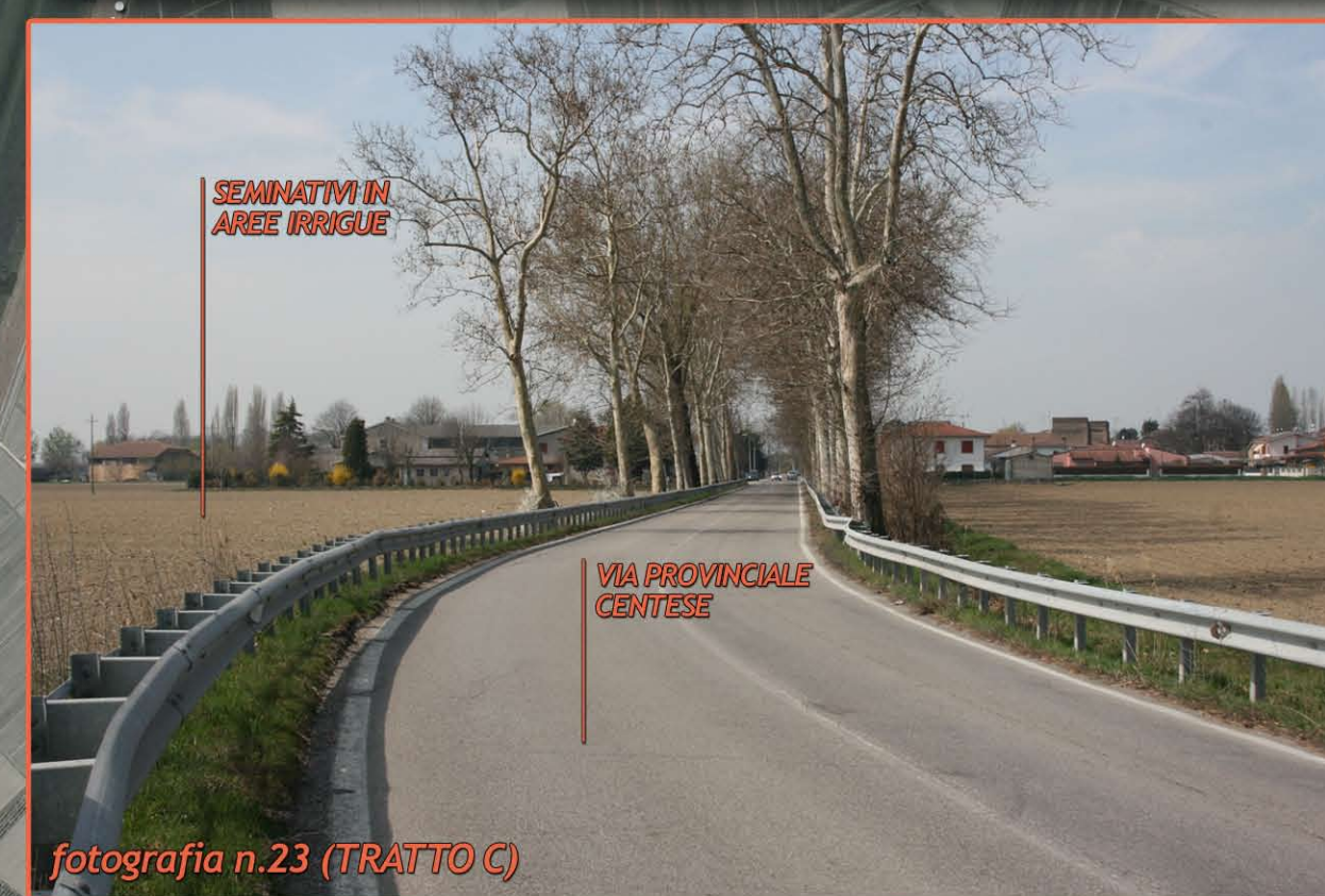
fotografia n.23 (TRATTO C)