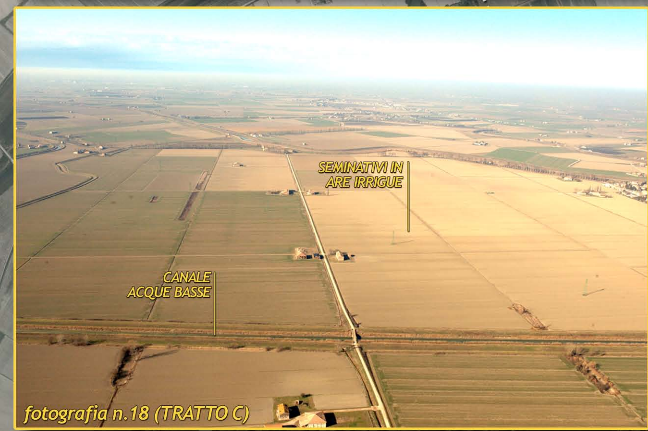
fotografia n.18 (TRATTO C)