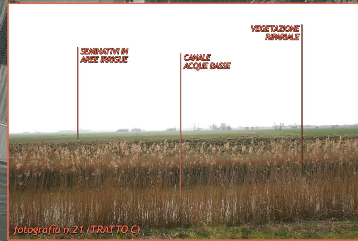
fotografia n.21 (TRATTO C)