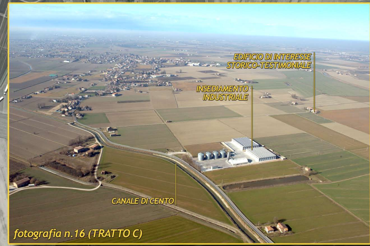
fotografia n.16 (TRATTO C)