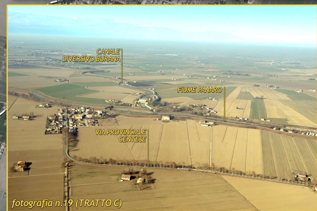
fotografia n.19 (TRATTO C)