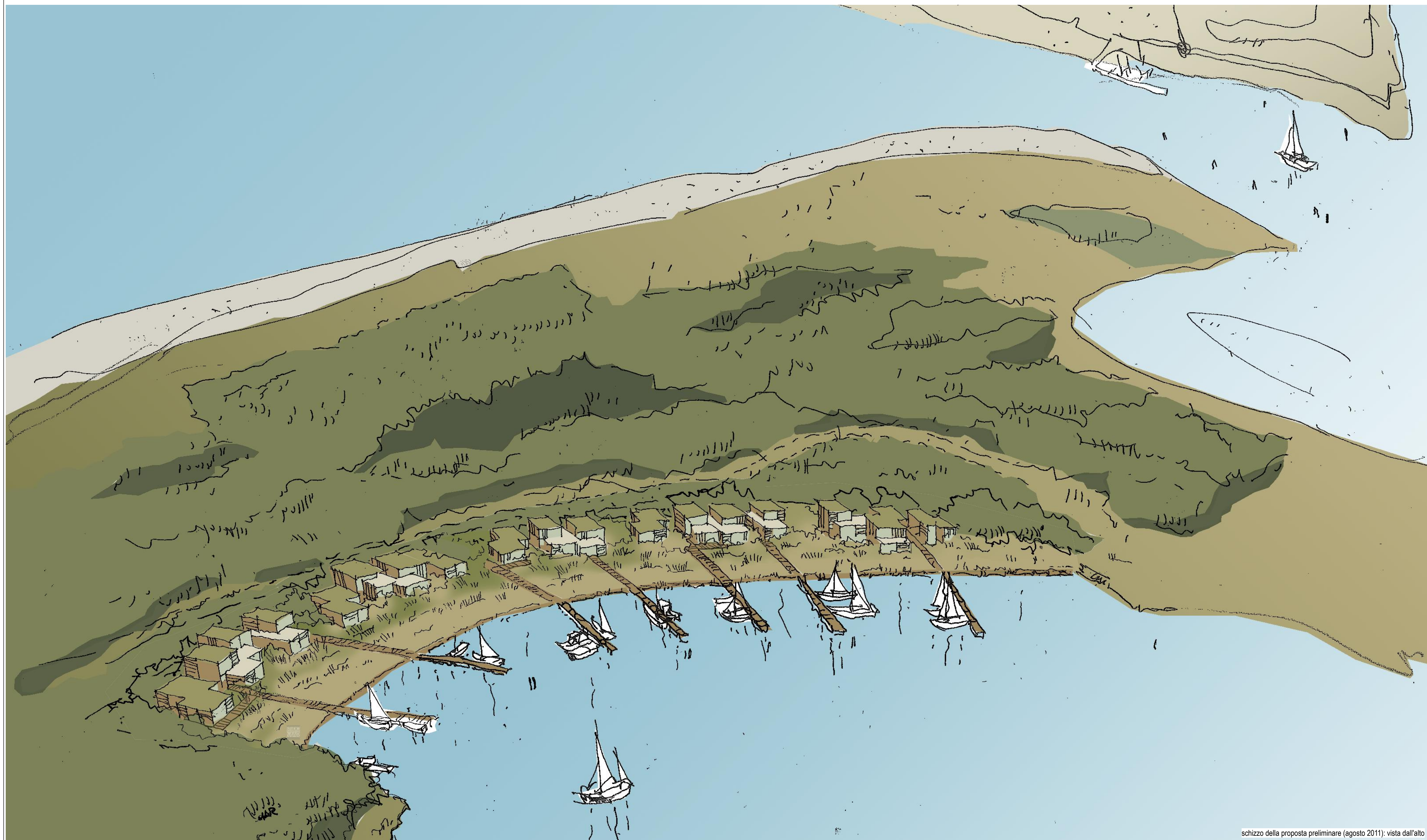
schizzo della proposta preliminare (agosto 2011): vista dall'alto