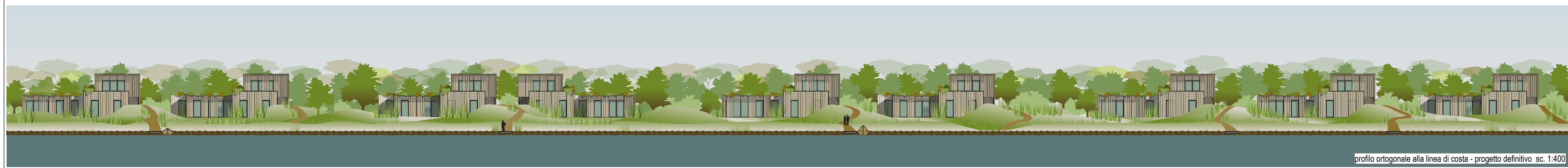
profilo ortogonale alla linea di costa - progetto definitivo sc. 1:400