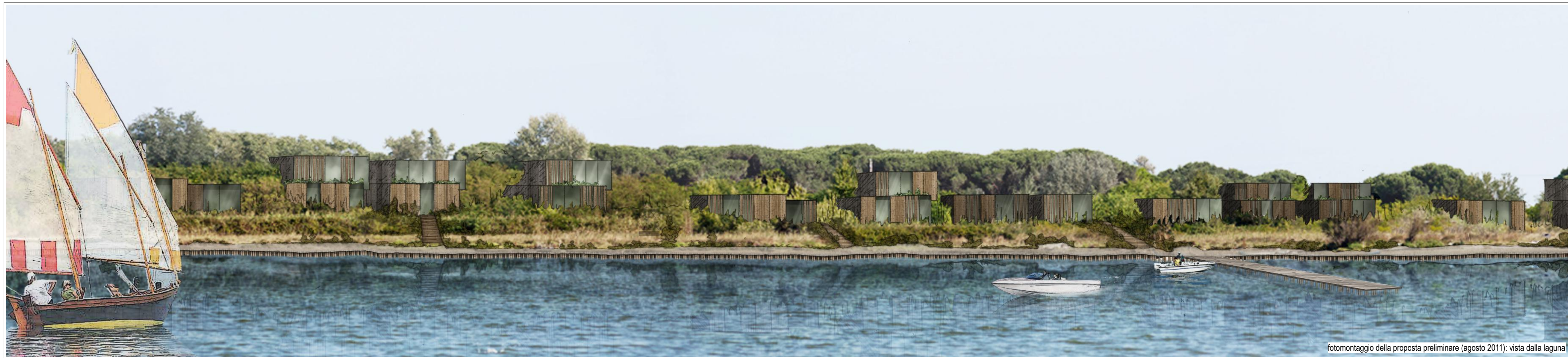
fotomontaggio della proposta preliminare (agosto 2011): vista dalla laguna