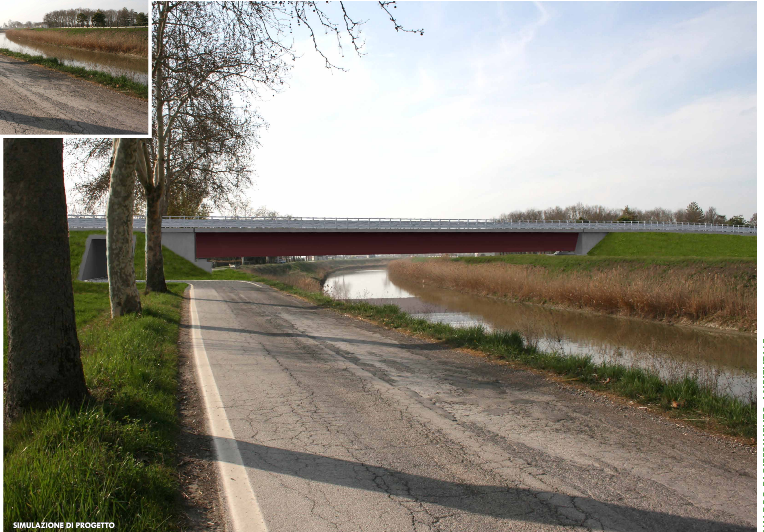
SIMULAZIONE DI PROGETTO