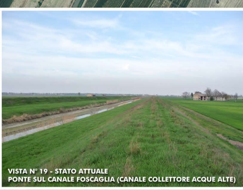
VISTA N° 19 - STATO ATTUALE PONTE SUL CANALE FOSAGLIA (CANALE COLLETORE ACQUE ALTE)