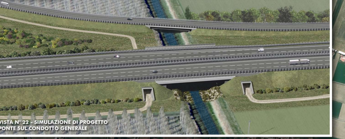
VISTA N° 22 - SIMULAZIONE DI PROGETTO PONTE SUL CONDOTTO GENERALE