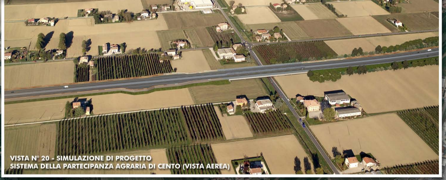
VISTA N° 20 - SIMULAZIONE DI PROGETTO SISTEMA DELLA PARTECIPANZA AGRARIA DI CENTO (VISTA AEREA)