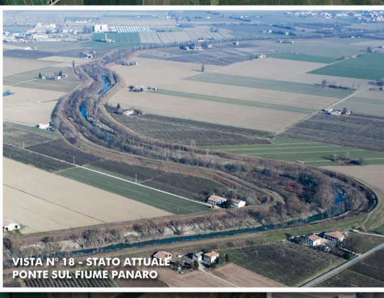
VISTA N° 18 - STATO ATTUALE PONTE SUL FIUME PANARO