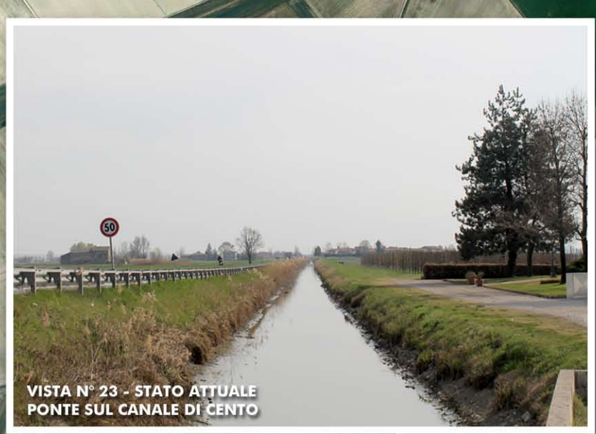
VISTA N° 23 - STATO ATTUALE PONTE SUL CANALE DI CENTO