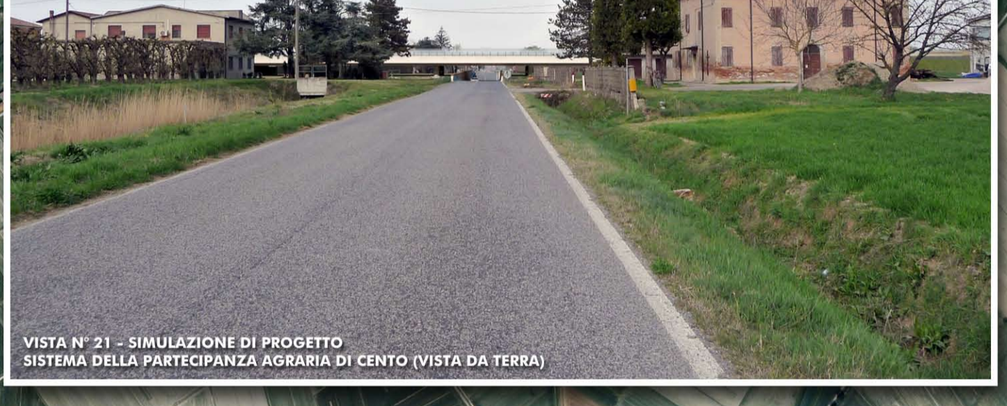
VISTA N° 21 - SIMULAZIONE DI PROGETTO SISTEMA DELLA PARTECIPANZA AGRARIA DI CENTO (VISTA DA TERRA)