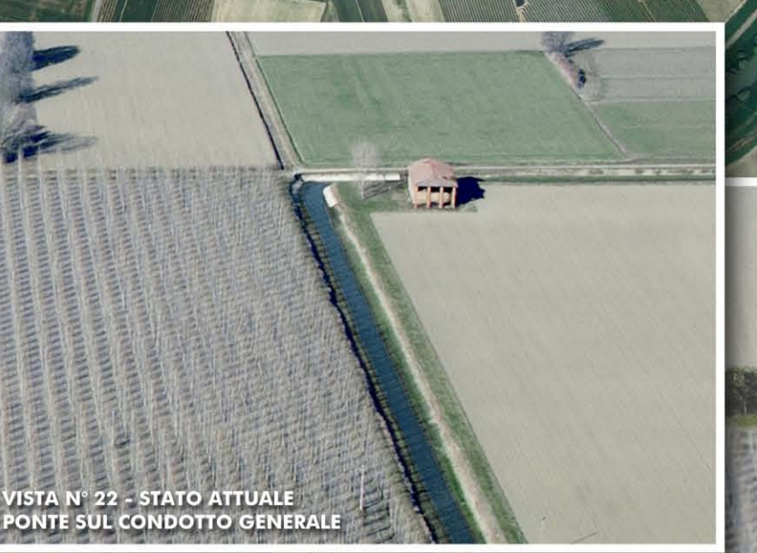
VISTA N° 22 - STATO ATTUALE PONTE SUL CONDOTTO GENERALE