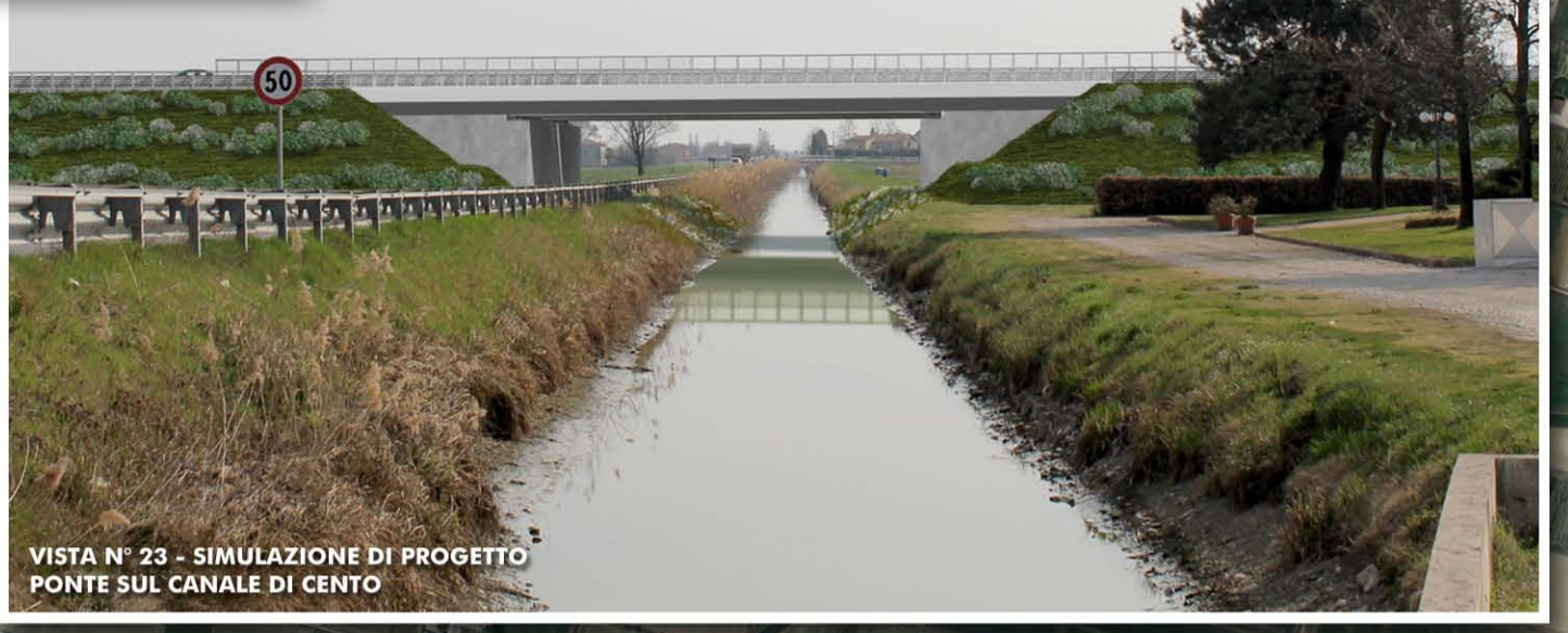
VISTA N° 23 - SIMULAZIONE DI PROGETTO PONTE SUL CANALE DI CENTO