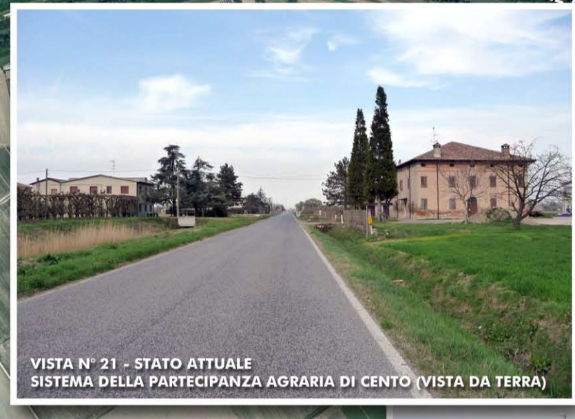
VISTA N° 21 - STATO ATTUALE SISTEMA DELLA PARTECIPANZA AGRARIA DI CENTO (VISTA DA TERRA)