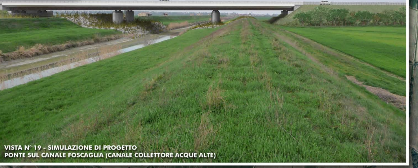
VISTA N° 19 - SIMULAZIONE DI PROGETTO PONTE SUL CANALE FOSAGLIA (CANALE COLLETORE ACQUE ALTE)