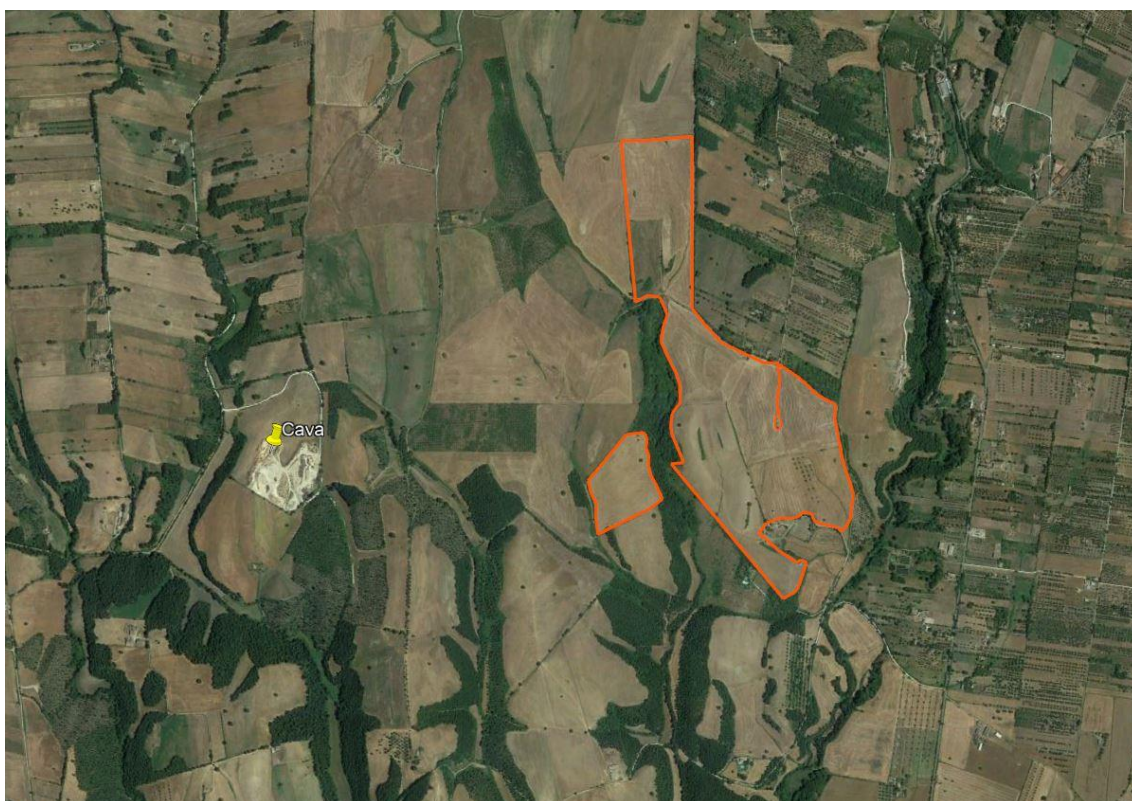
Figura 1: Aerofotogrammetrico – Impianto denominato EG ULIVO

Nella figura seguente si riporta la collocazione del sito su vista aerofotogrammetrica.