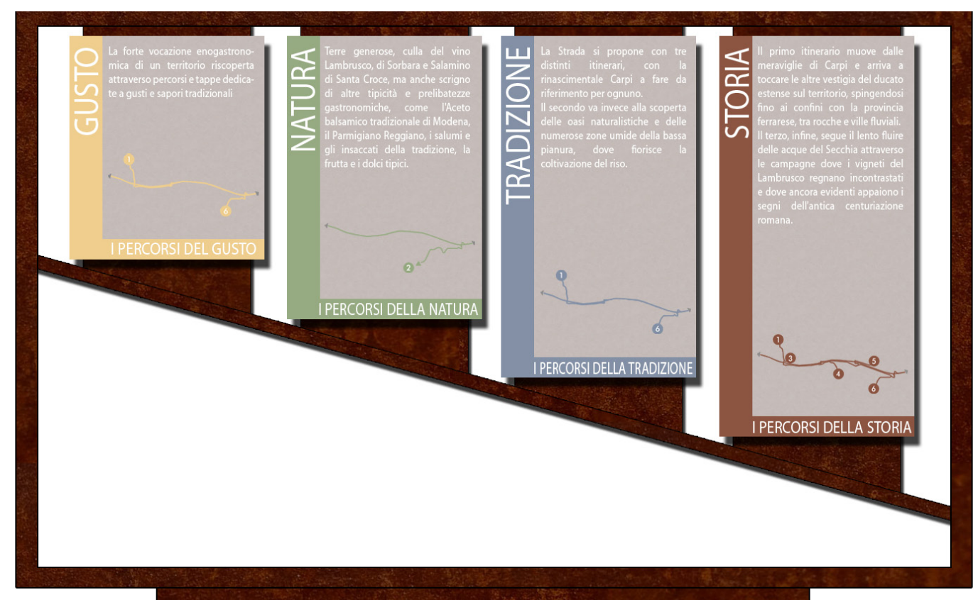
PANNELLI INFORMATIVI SUI VALORI DEL TERRITORIO