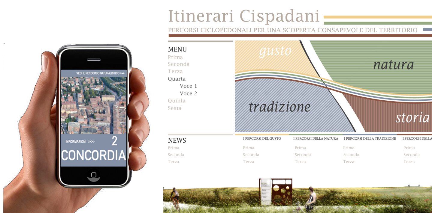
APPLICAZIONI PER DISPOSITIVI MOBILI