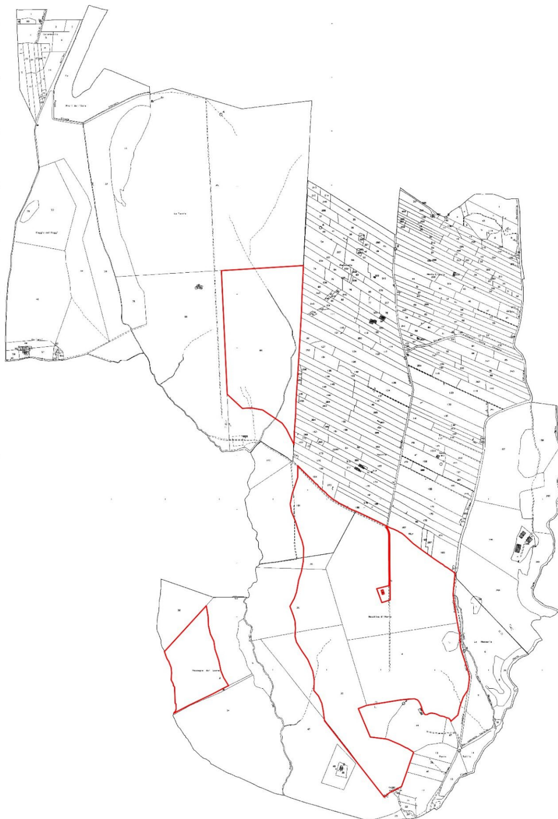
Figura 3 – MAPPA CATASTALE DEI LOTTI

EG ULIVO S.R.L. | Socio Unico | Cap. Soc. 10.000 € i.v. | P.IVA: 12084660963 | Sede Legale: Via Dei Pellegrini 22 | 20122 Milano | Italia PEC: egulivo@pec.it | www.enfinityglobal.com