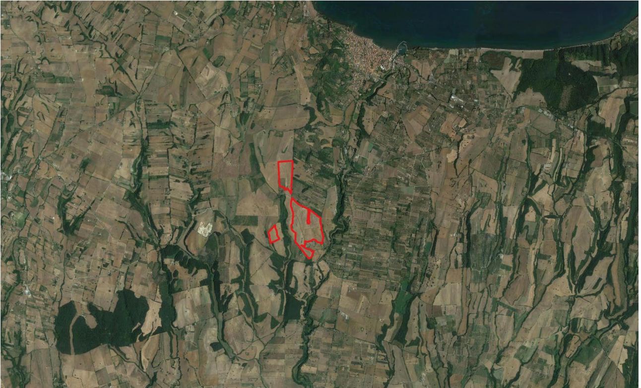
Figura 2 - Inquadramento territoriale

I terreni interessati dall’impianto fotovoltaico si trovano in località Pontone del Leone, sita a circa 2 km a sud rispetto al centro abitato di Marta (VT).