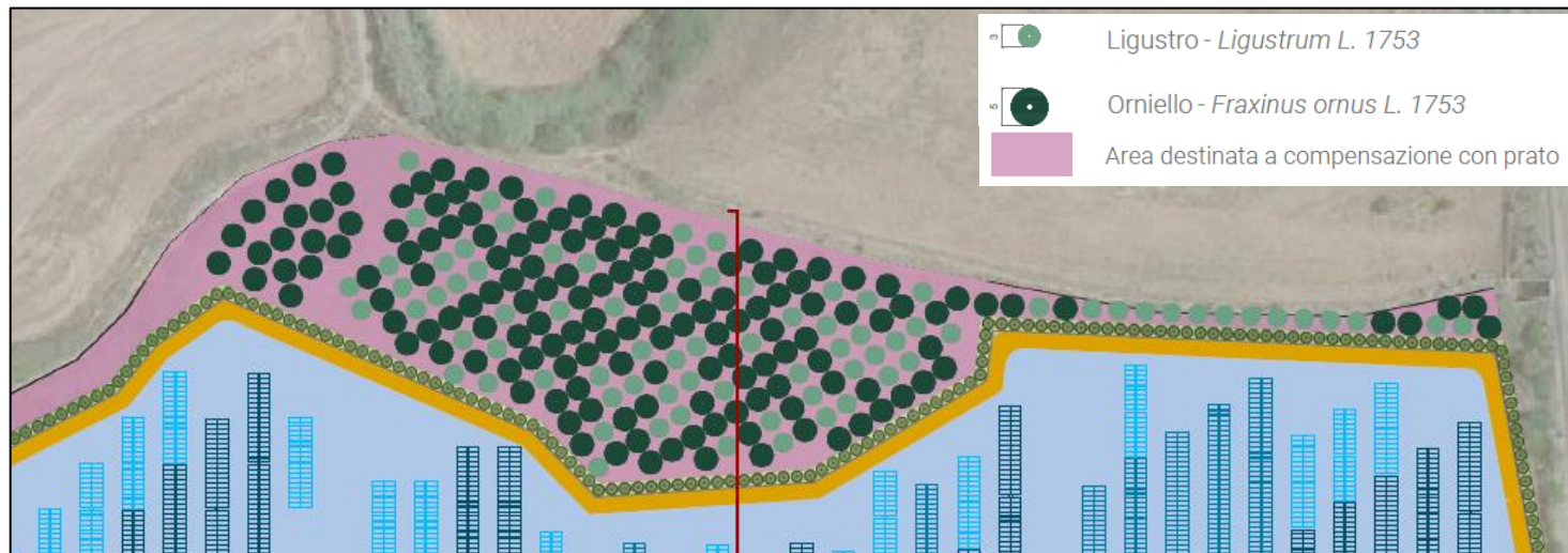
Figura 3: porzione Nord dell'area di progetto per la quale sarà previsto il prato, oltre che la piantumazione di ligustro e orniello.

Il ligustro è un arbusto caratterizzato da infiorescenze organizzate in pannocchie. Questa specie, da aprile a luglio, risulta attrattiva per le api in quanto produce il nettare, sostanza fondamentale per il sostentamento delle colonie di questi insetti.