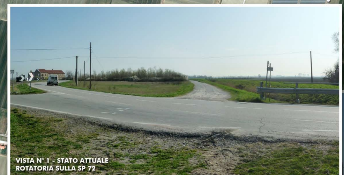
VISTA N° 1 - STATO ATTUALE ROTATORIA SULLA SP 72