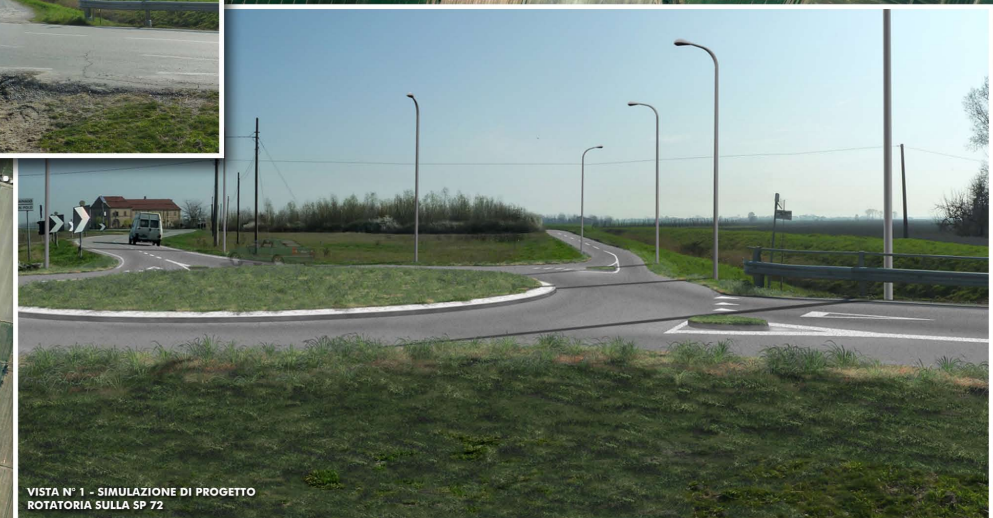
VISTA N° 1 - SIMULAZIONE DI PROGETTO ROTATORIA SULLA SP 72