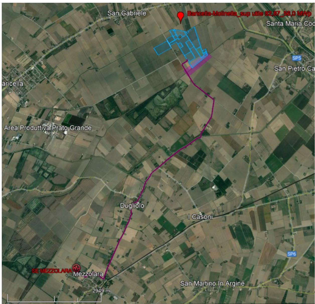
FIGURA 2: INQUADRAMENTO GEOGRAFICO DEL SITO CON CAVIDOTTO DI CONNESSIONE

Il terreno interessato dall'impianto fotovoltaico oggetto del presente Studio si trova in località San Gabriele lungo la Via Camerone, sita a circa 3,5 km dal centro abitato di Baricella (BO) e a circa 5,20 km dal centro abitato di Molinella (BO). Il lotto agricolo è accessibile mediante viabilità comunale, via Camerone.