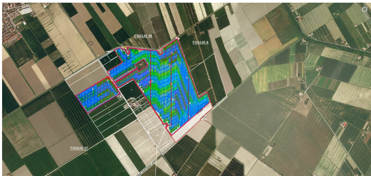
FIGURA 1: INQUADRAMENTO GEOGRAFICO DEL SITO

In Figura 1 e Figura 2 si riportano rispettivamente l'inquadramento geografico del sito con cavidotto di connessione.