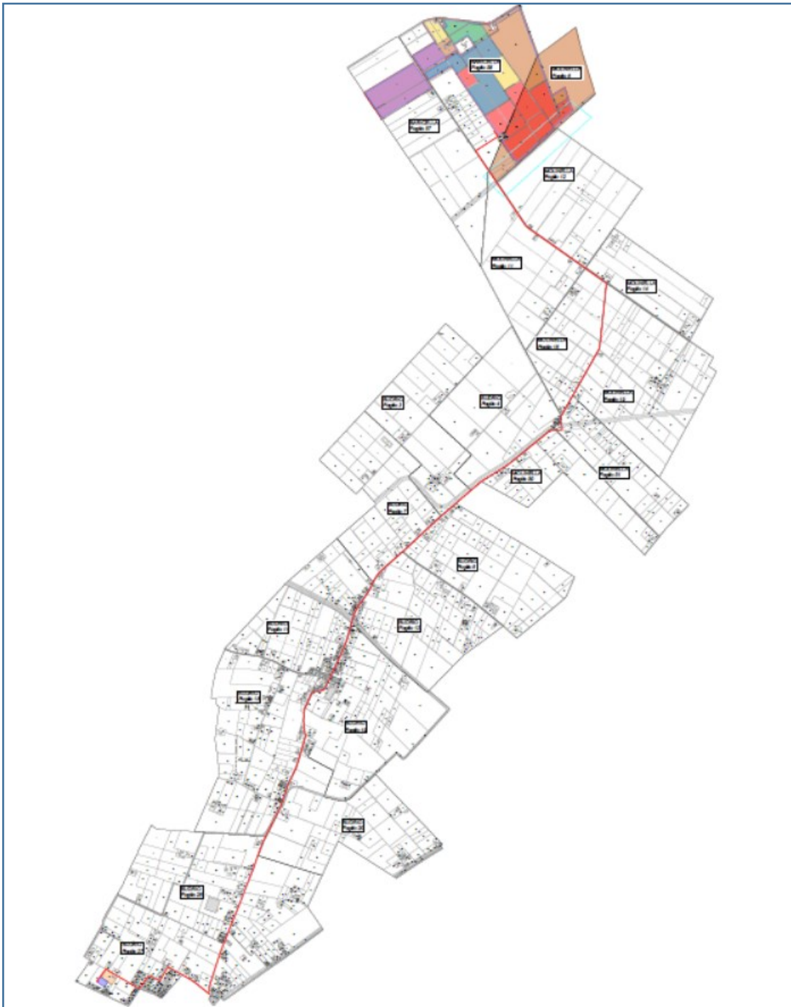
FIGURA 4: INQUADRAMENTO CATASTALE DELLE OPERE CON I CAVIDOTTI DI CONNESSIONE

Un cavo interrato in media tensione, lungo 10,00 km, collegherà la Cabina Elettrica e Control Room con la Cabina Utente, nei territori comunali di Baricella, Molinella, e Budrio (di seguito cavidotto esterno MT Cabina elettrica Cabina Utente AT tra Cabina Utente e Punto di Consegna);