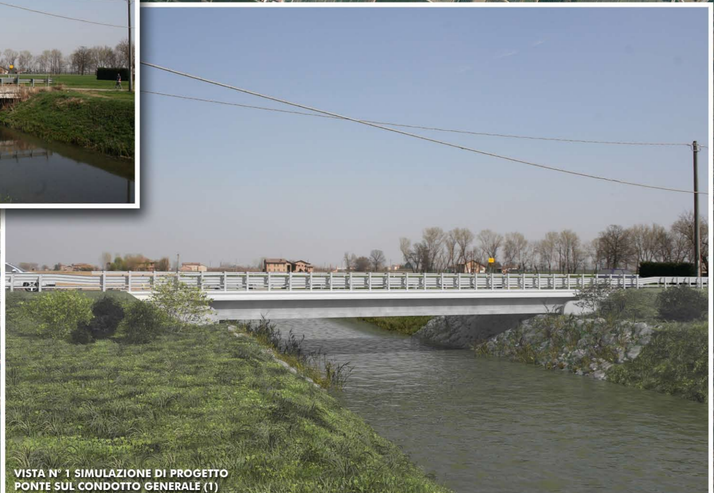
VISTA N° 1 SIMULAZIONE DI PROGETTO PONTE SUL CONDOTTO GENERALE (1)