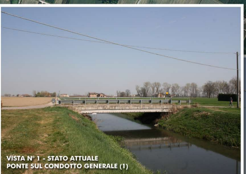
VISTA N° 1 - STATO ATTUALE PONTE SUL CONDOTTO GENERALE (1)