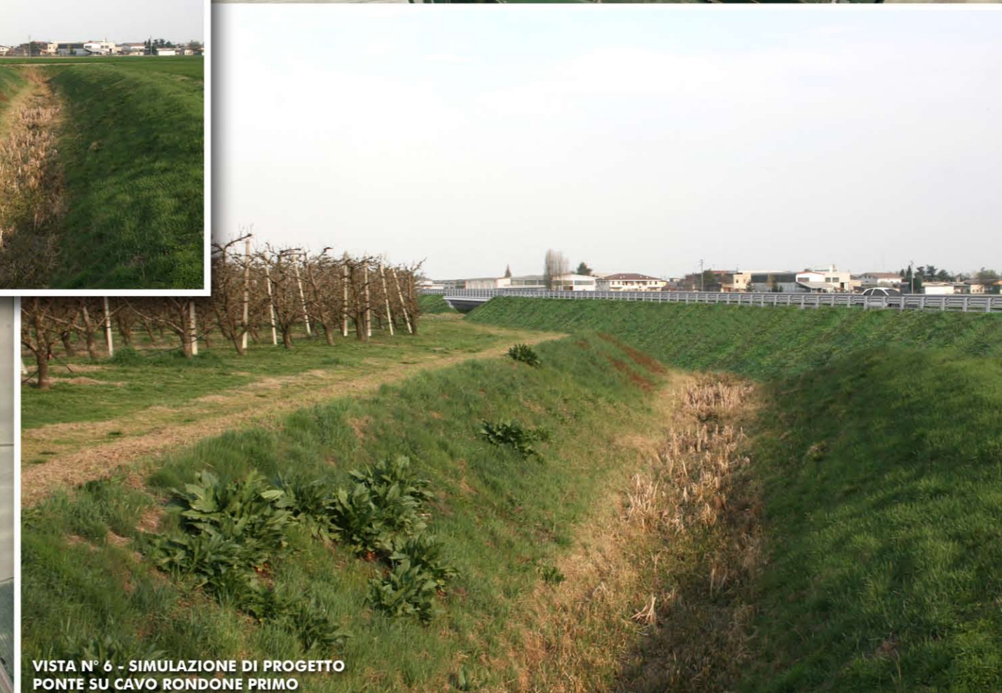
VISTA N° 6 - SIMULAZIONE DI PROGETTO PONTE SU CAVO RONDONE PRIMO