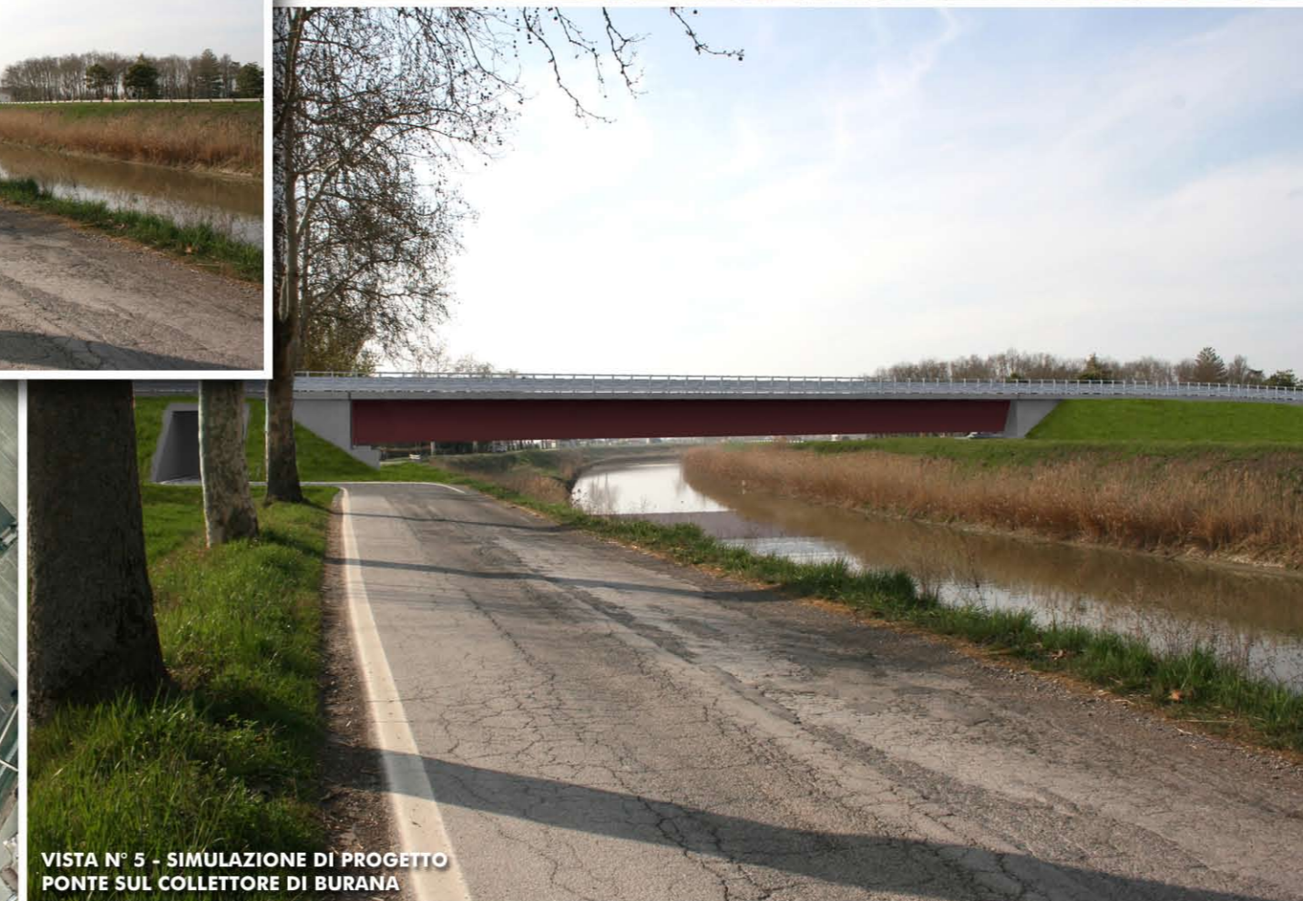
VISTA N° 5 - SIMULAZIONE DI PROGETTO PONTE SUL COLLETTORE DI BURANA