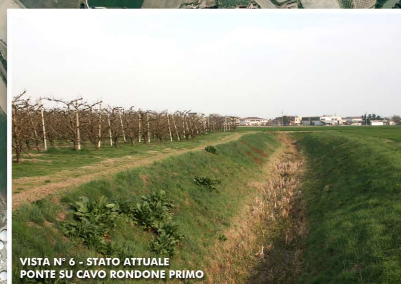
VISTA N° 6 - STATO ATTUALE PONTE SU CAVO RONDONE PRIMO