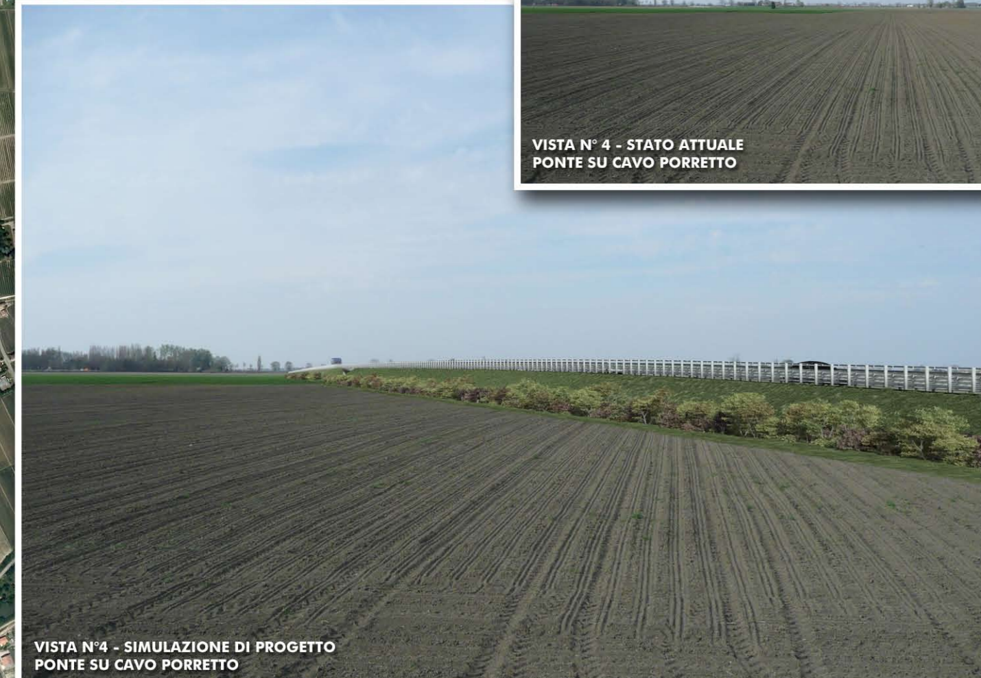
VISTA N° 4 - SIMULAZIONE DI PROGETTO PONTE SU CAVO PORRETTO