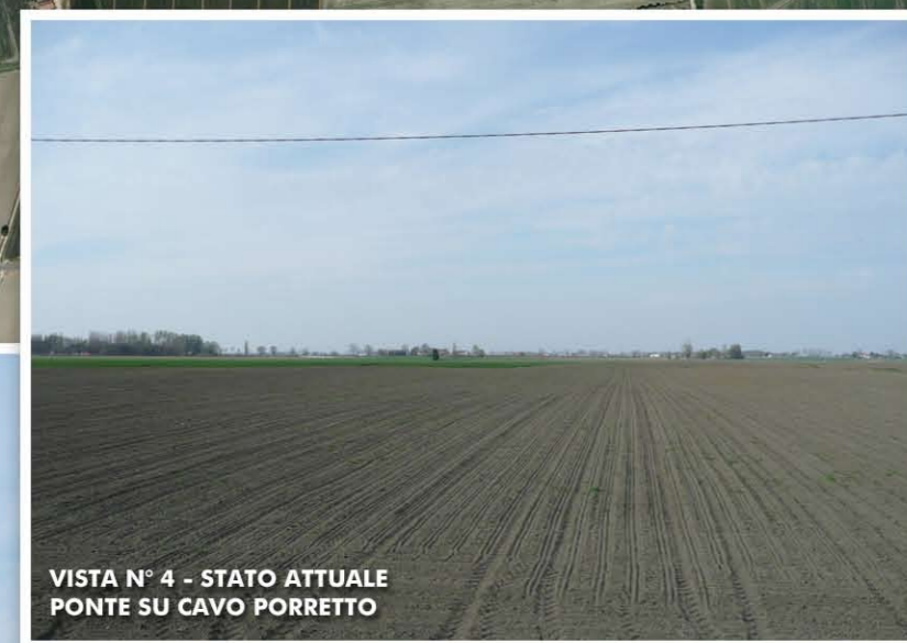
VISTA N° 4 - STATO ATTUALE PONTE SU CAVO PORRETTO