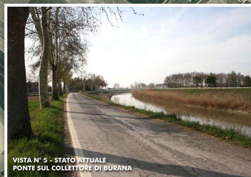
VISTA N° 5 - STATO ATTUALE PONTE SUL COLLETTORE DI BURANA