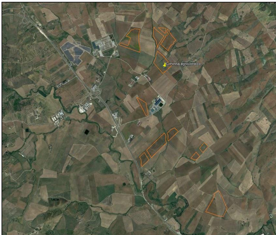
1. Vista satellitare generale ubicazione impianto