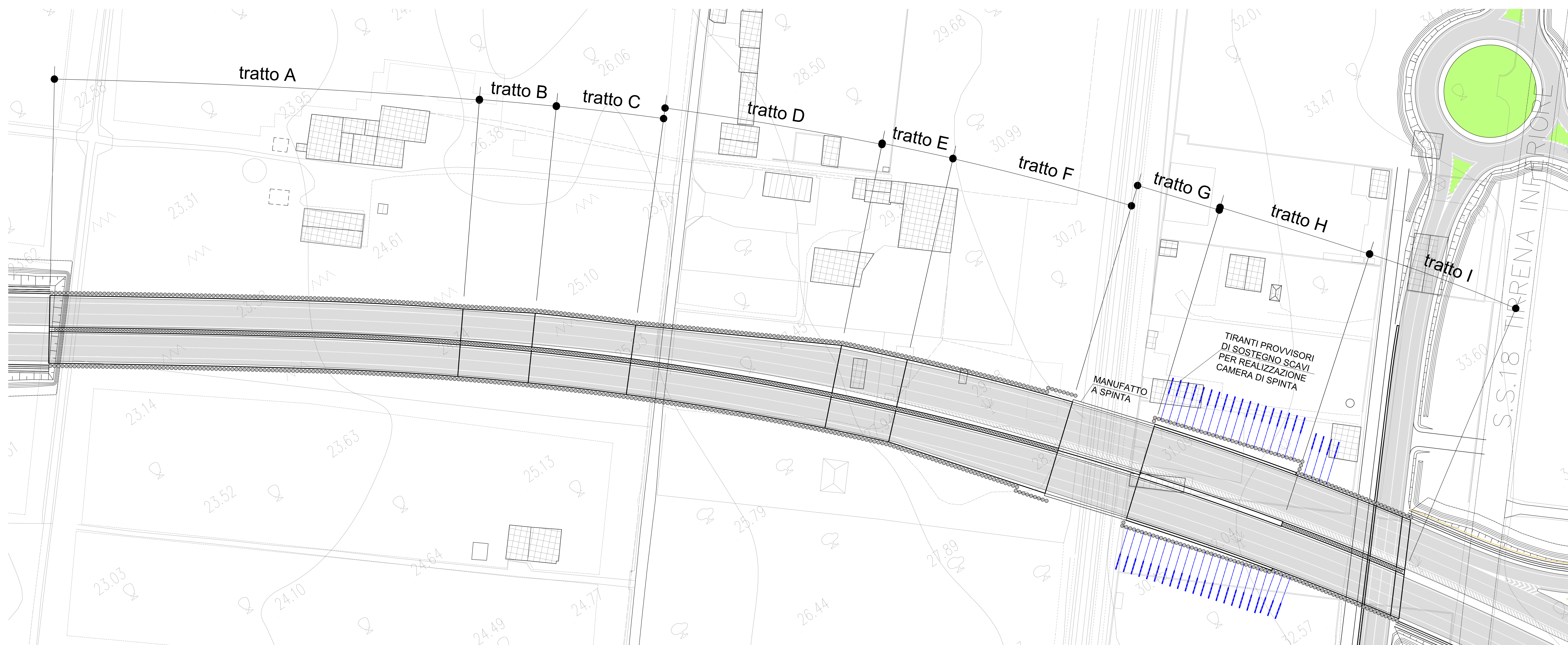
PIANTA GALLERIA - SCALA 1:500