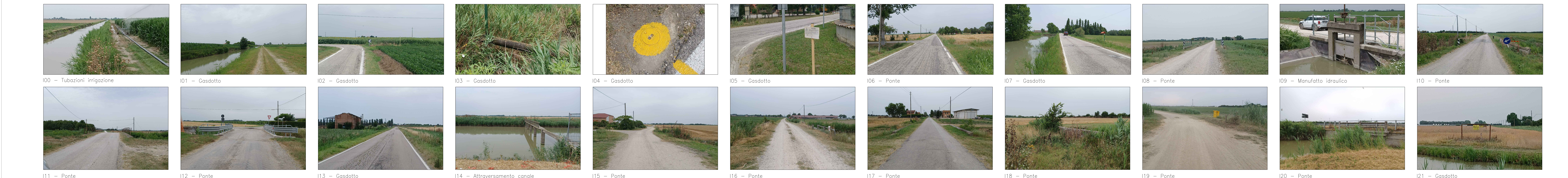
I00 - Tubazioni irrigazione I01 - Gasdotto I02 - Gasdotto I03 - Gasdotto I04 - Gasdotto I05 - Gasdotto I06 - Ponte I07 - Gasdotto I08 - Ponte I09 - Manufatto idraulico I10 - Ponte I11 - Ponte I12 - Ponte I13 - Gasdotto I14 - Attraversamento canale I15 - Ponte I16 - Ponte I17 - Ponte I18 - Ponte I19 - Ponte I20 - Ponte I21 - Gasdotto

COMUNE DI ARGENTA (FE) REGIONE EMILIA ROMAGNA