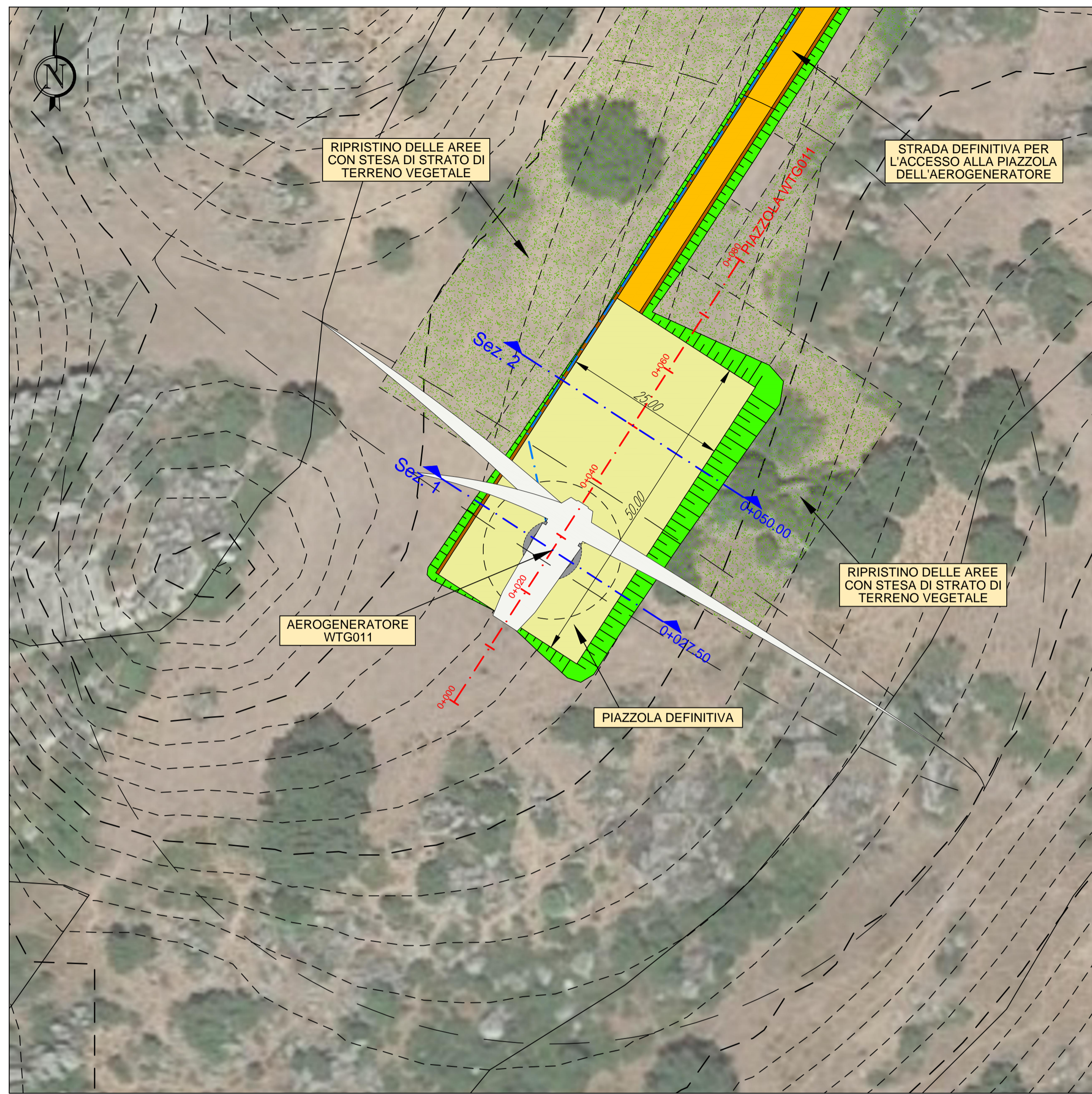
AEROGENERATORE WTG011 PIAZZOLA DEFINITIVA NELLA FASE DI ESERCIZIO Base carta: Ortofoto Google Map e C.T.R. Regione Sardegna