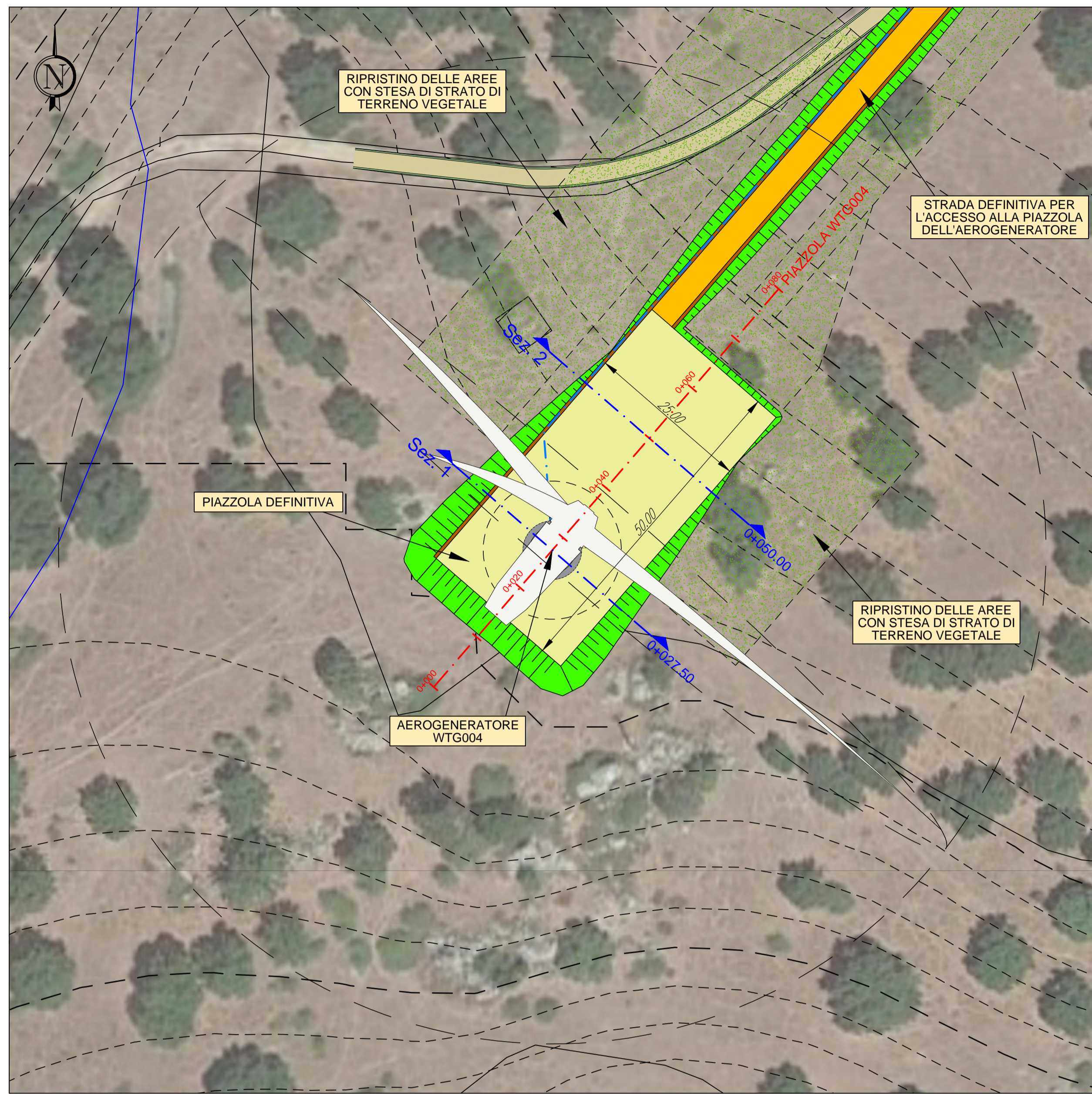
AEROGENERATORE WTG004 PIAZZOLA DEFINITIVA NELLA FASE DI ESERCIZIO Base carta: Ortofoto Google Map e C.T.R. Regione Sardegna Scala 1 : 500