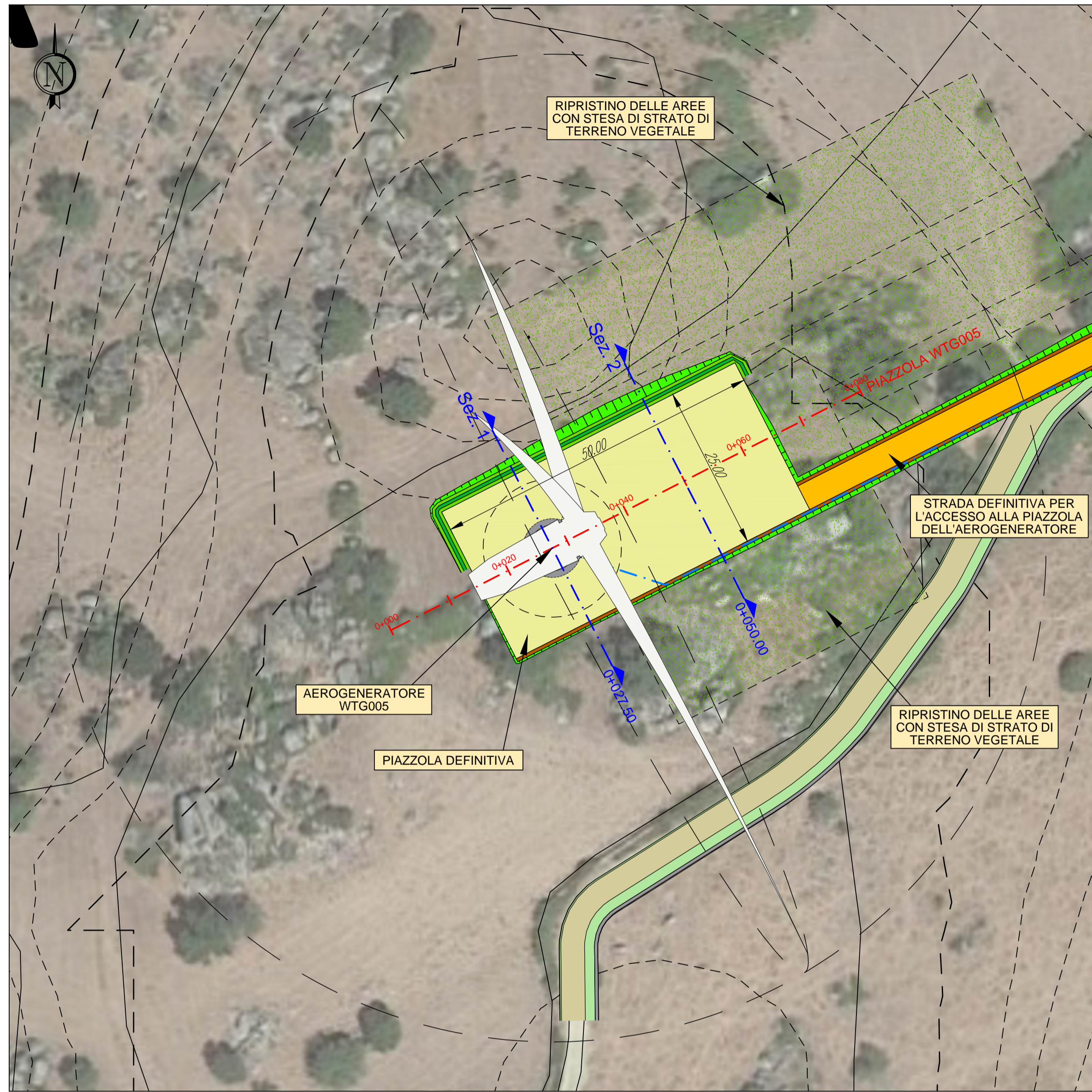
AEROGENERATORE WTG005 PIAZZOLA DEFINITIVA NELLA FASE DI ESERCIZIO Base carta: Ortofoto Google Map e C.T.R. Regione Sardegna