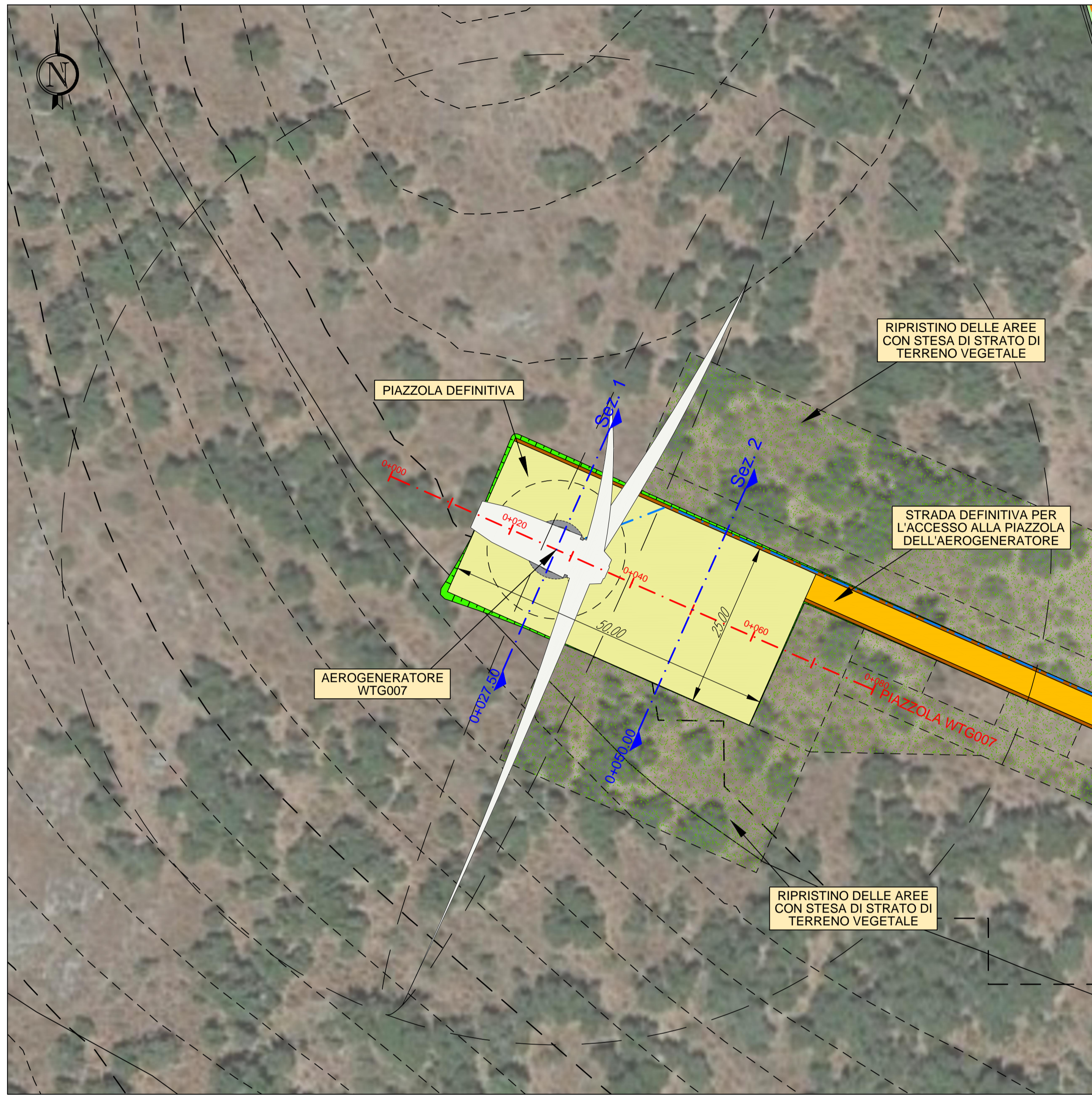
AEROGENERATORE WTG007 PIAZZOLA DEFINITIVA NELLA FASE DI ESERCIZIO Base carta: Ortofoto Google Map e C.T.R. Regione Sardegna Scala 1 : 500