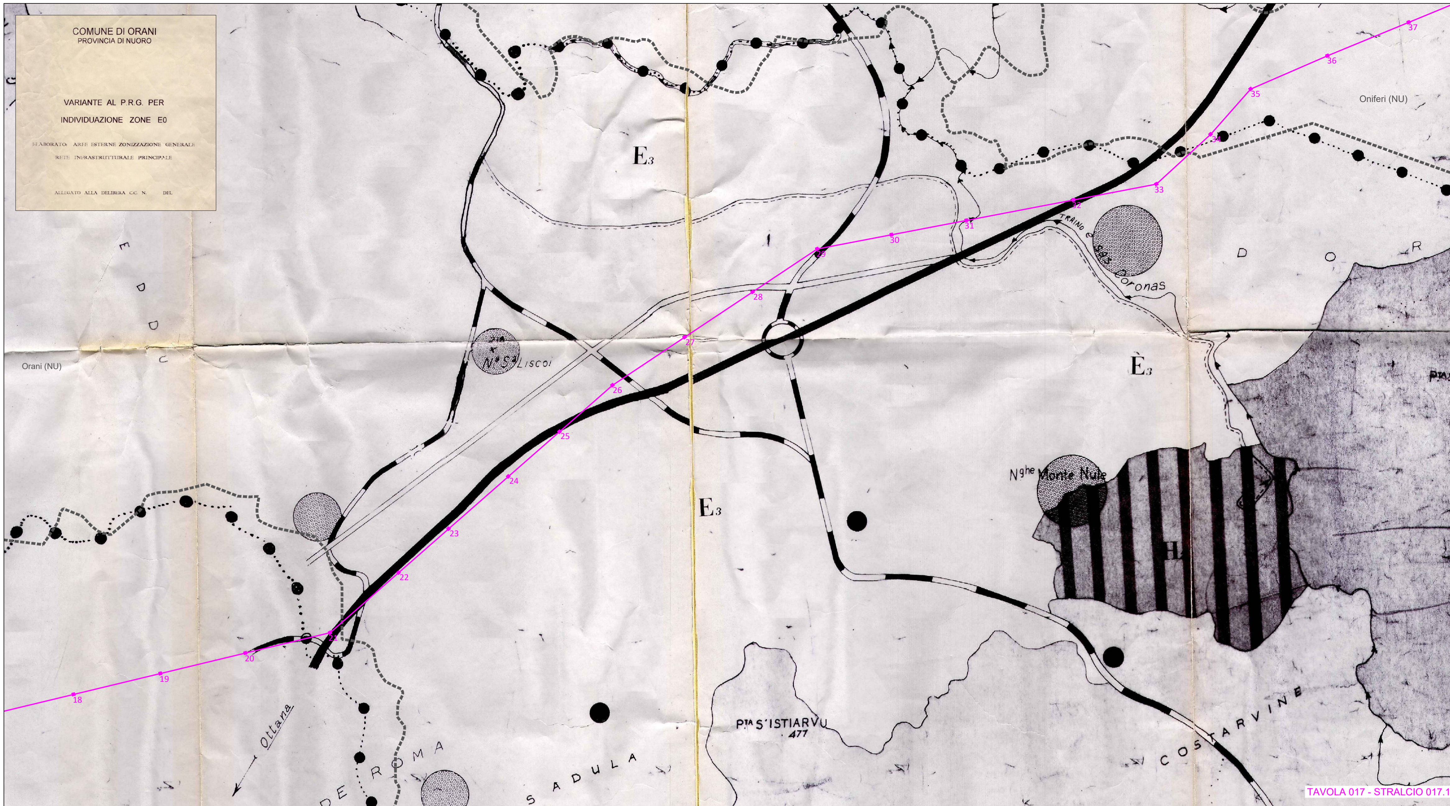
TAVOLA 017 - STRALCIO 017.1