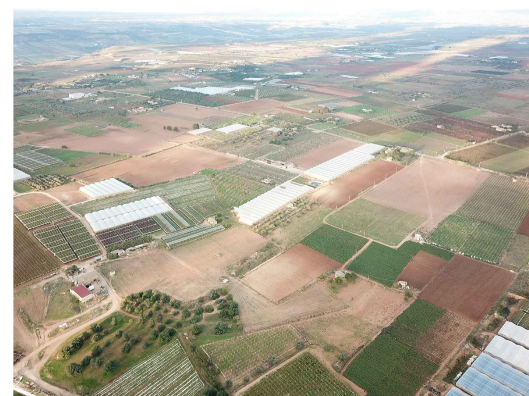
Punto di ripresa n°3 ante operam