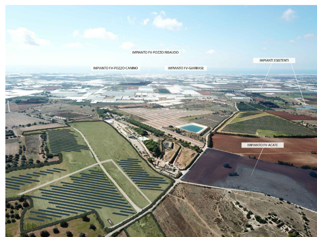
Punto di ripresa n°1 post operam con cumulo impianti FV-Acate, FV-Giarrase, FV-Pozzo Ribaudò, FV-Pozzo Canino e impianti esistenti