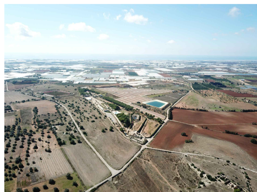
Punto di ripresa n°1 ante operam