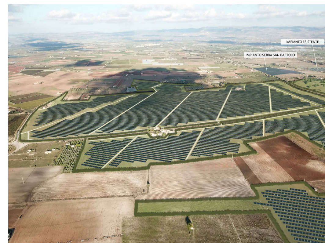
Punto di ripresa n°4 post operam con cumulo impianto Serra S.Bartolo e impianto esistente