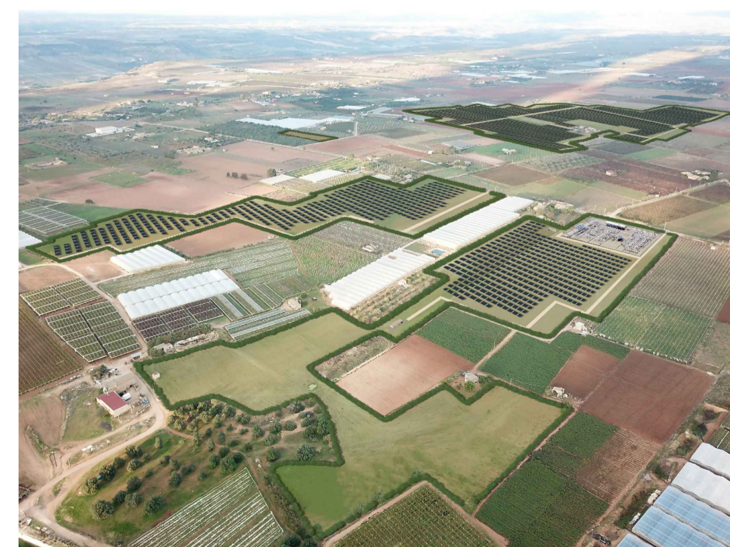
Punto di ripresa n°3 post operam senza cumulo con altri impianti