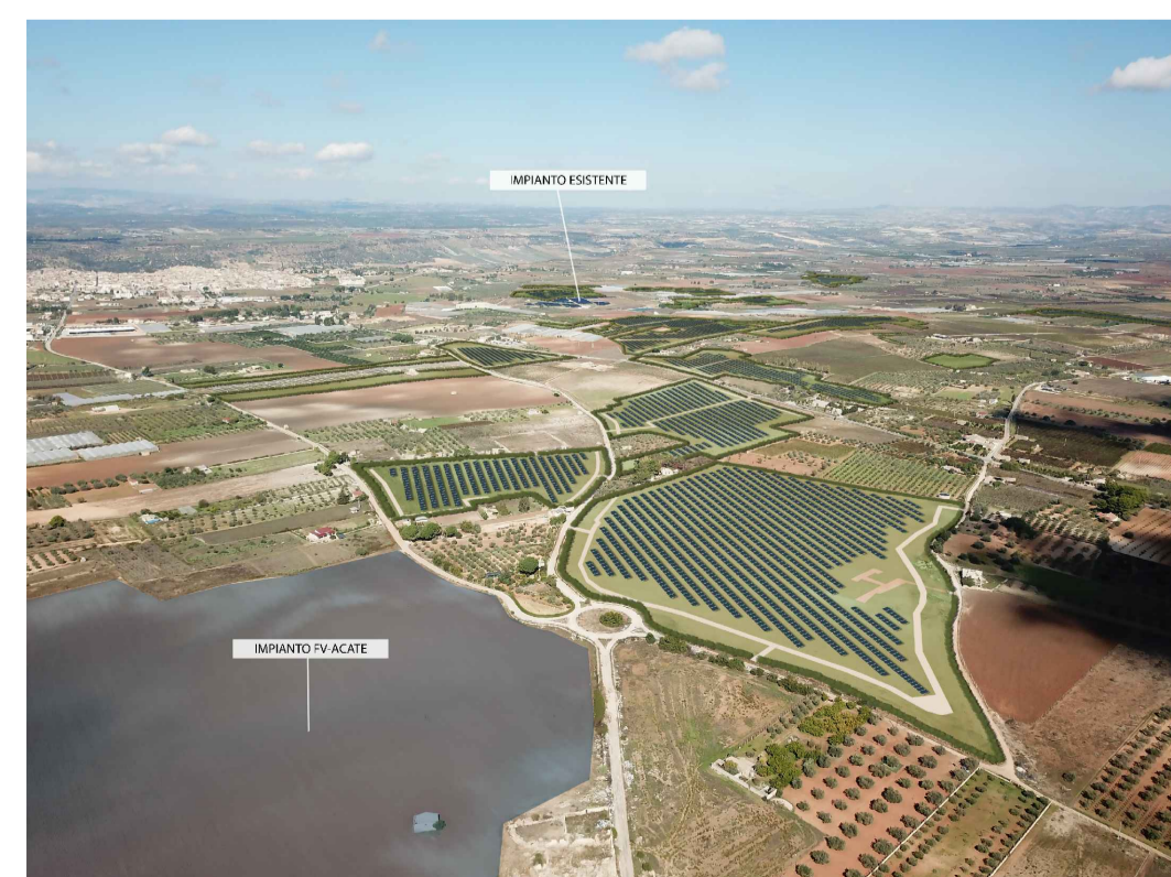
Punto di ripresa n°2 post operam con cumulo impianto FV-Acate e impianto esistente