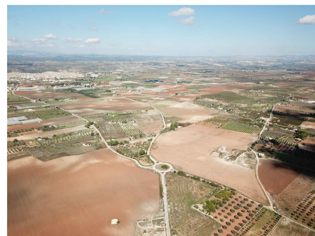
Punto di ripresa n°2 ante operam