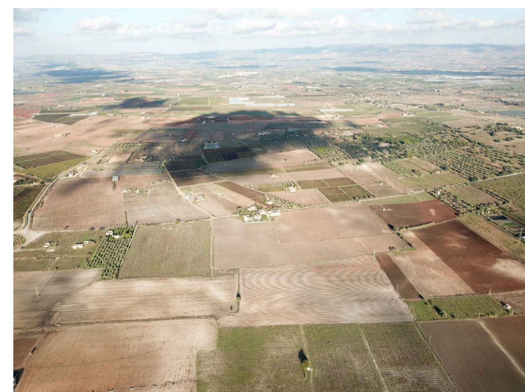
Punto di ripresa n°4 ante operam